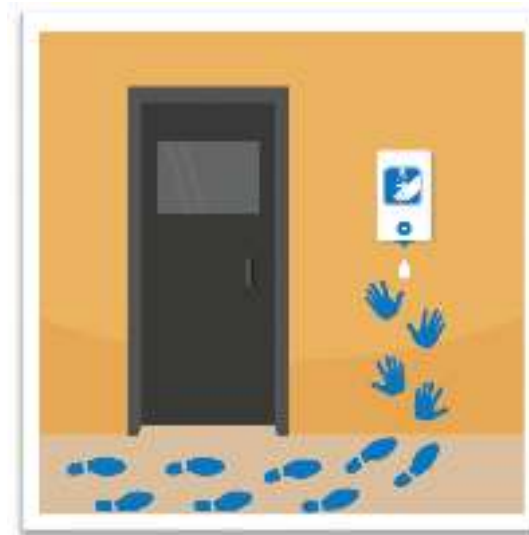
Des repères visuels pour inciter les élèves à désinfecter leurs mains.