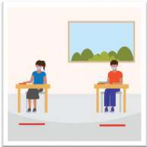
Élèves portant un masque en tissu.