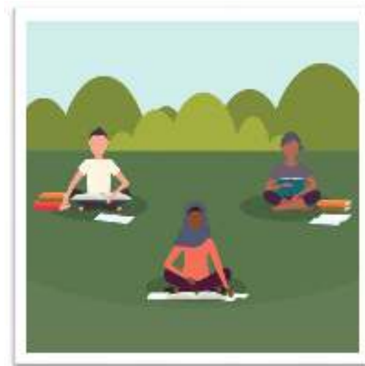
Les cours peuvent être dispensés en extérieur si les conditions sont favorables.