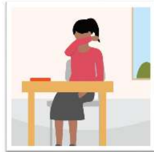
Élève se protégeant avec le coude en cas de toux.