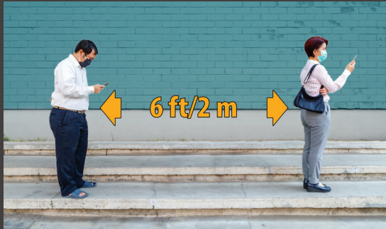
Giữ khoảng cách 6 ft/2 m với những người khác.