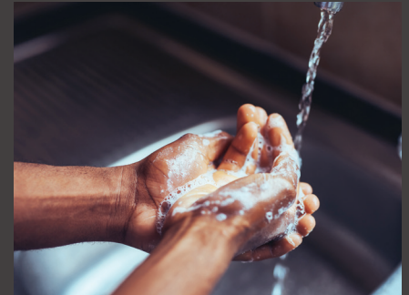
Rửa tay thường xuyên.

Các hoạt động tiếp xúc gần khiến bạn có nguy cơ phơi nhiễm COVID-19.