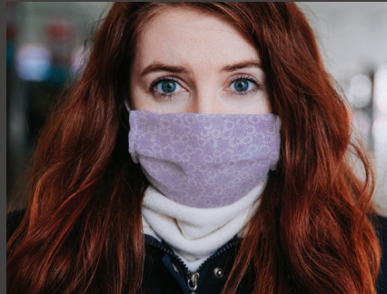
Đeo khẩu trang.