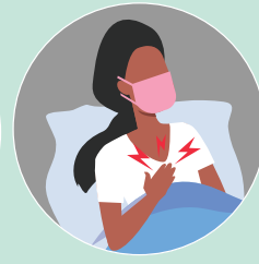
maumivu ya kifua