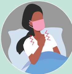
kupumua kwa matatizo

mpeleke mgonjwa huyo kwenye kituo cha afya kilicho karibu ikiwa atazidiwa au kupatwa na dalili zifuatazo: