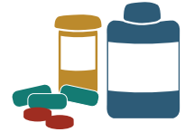
Medicamentos y Suministros Médicos