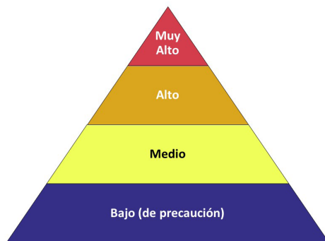
Pirámide de riesgo ocupacional para el COVID-19

El riesgo de los trabajadores por la exposición ocupacional al SARS-CoV-2, el virus que causa el COVID-19, durante un brote podría variar de un riesgo muy alto a uno alto, medio o bajo (de precaución). El nivel de riesgo depende en parte del tipo de industria, la necesidad de contacto a menos de 6 pies de personas que se conoce o se sospecha que estén infectadas con el SARS-CoV-2, o el requerimiento de contacto repetido o prolongado con personas que se conoce o se sospecha que estén infectadas con el SARS-CoV-2. Para ayudar a los empleadores a determinar las precauciones apropiadas, OSHA ha dividido las tareas de trabajo en cuatro niveles de exposición a riesgo: muy alto, alto, medio y bajo. La Pirámide de riesgo ocupacional muestra los cuatro niveles de exposición a riesgo en la forma de una pirámide para representar la distribución probable del riesgo. La mayoría de los trabajadores norteamericanos probablemente estarán en los niveles de riesgo de exposición bajo (de precaución) o medio.