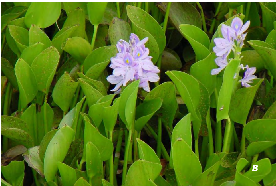
Eichhornia crassipes (Mart.) Solms A, B plantas con inflorescencias/ plants with inflorescences .