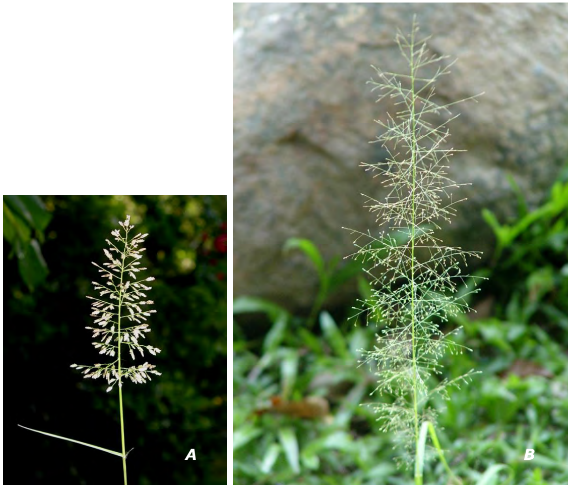
Eragrostis unioloides (Retz.) Nees ex Steud.