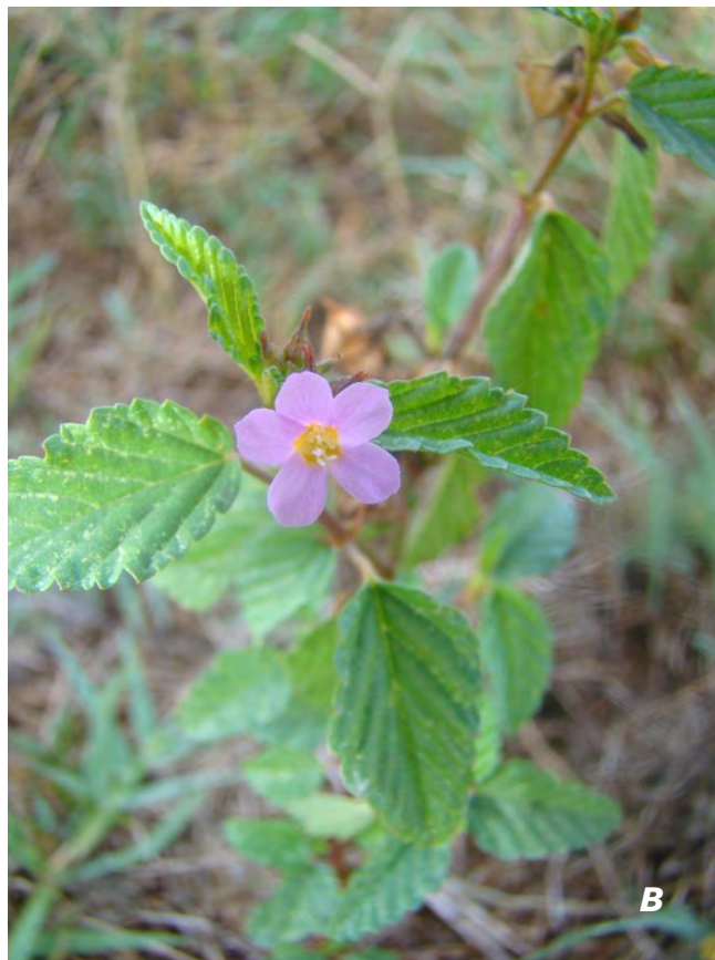
Melochia pyramidata L.