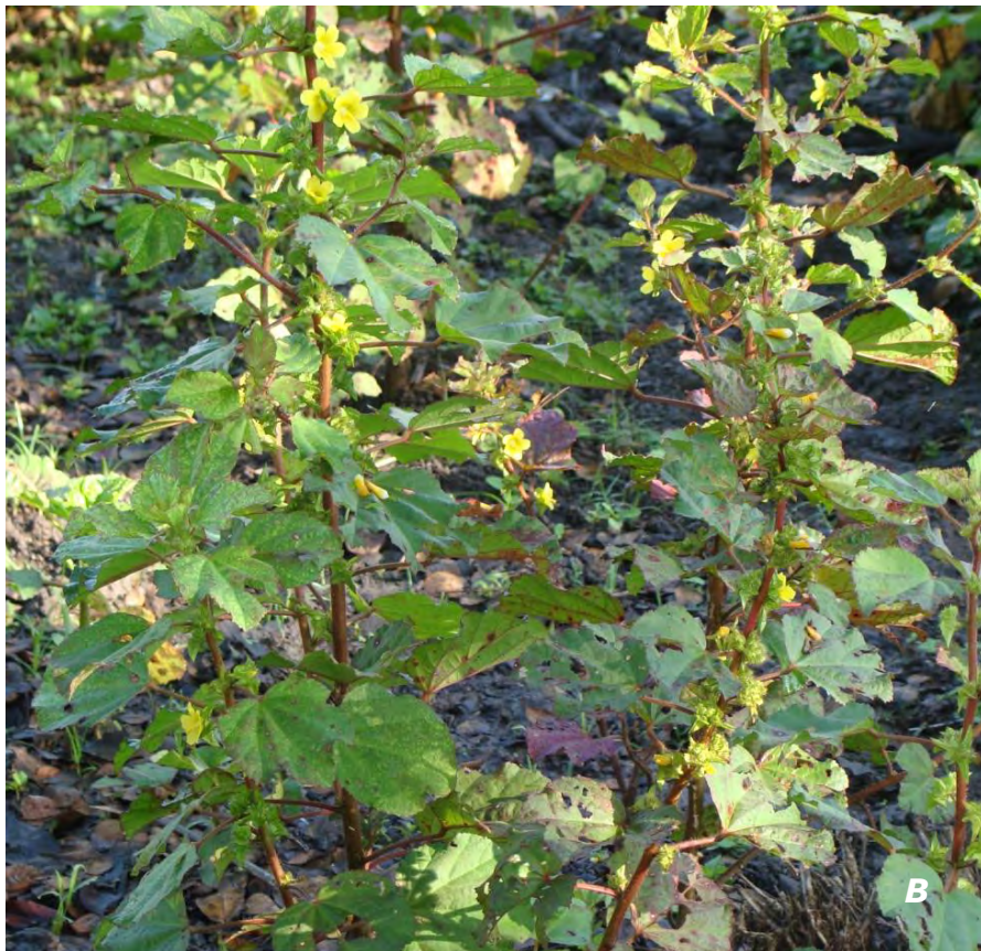
Malachra capitata (L.) L. A flores/flowers; B plantas/plants.