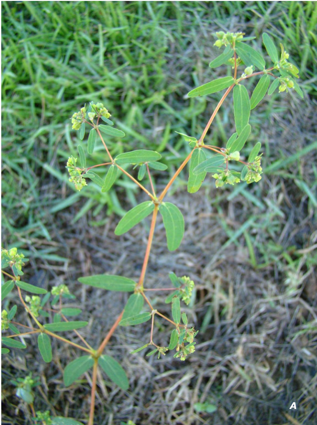
Euphorbia hyssopifolia L. A planta/ plant .