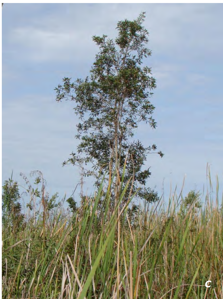
Melaleuca quinquenervia (Cav.) S.T. Blake A inflorescencia/ inflorescence ; B frutos/ fruits ; C planta/ plant .