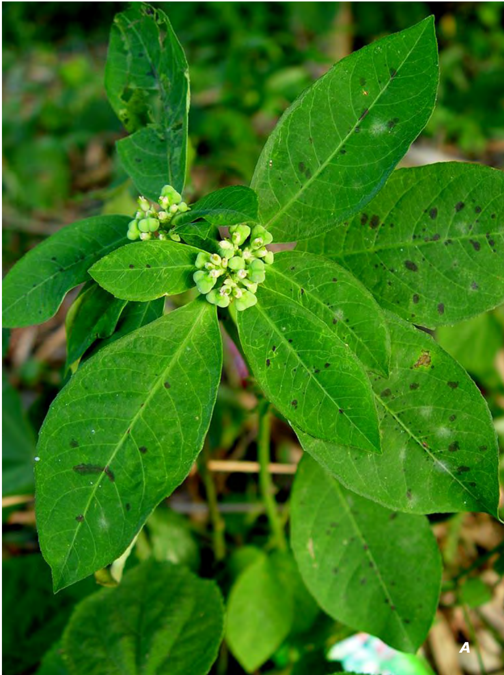
Euphorbia heterophylla L.