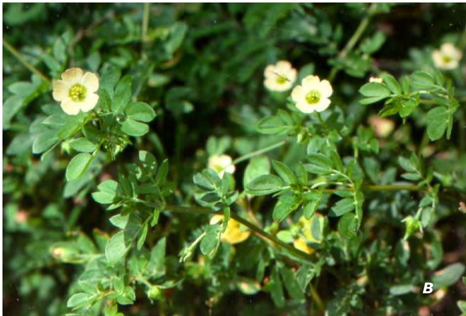
Kallstroemia maxima (L.) Hook. & Arn. A & B plantas/ plants .