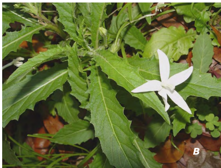
Hippobroma longiflora (L.) G. Don A & B plantas/ plants .