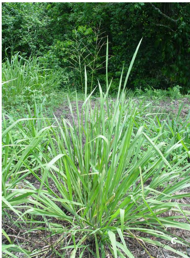
Megathyrus maximus (Jacq.) B.K. Simon & S.W.L. Jacobs A racimo/raceme; B inflorescence/inflorescencia; C planta/plant.