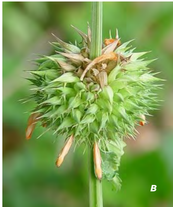
Leonotis nepetifolia (L.) R. Br. A plantas/ plants ; B inflorescencia/ inflorescence .