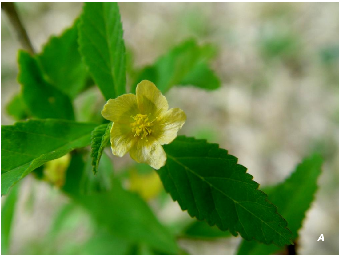
Malvastrum coromandelianum (L.) Garcke A hojas y flor/ leaves and flower .