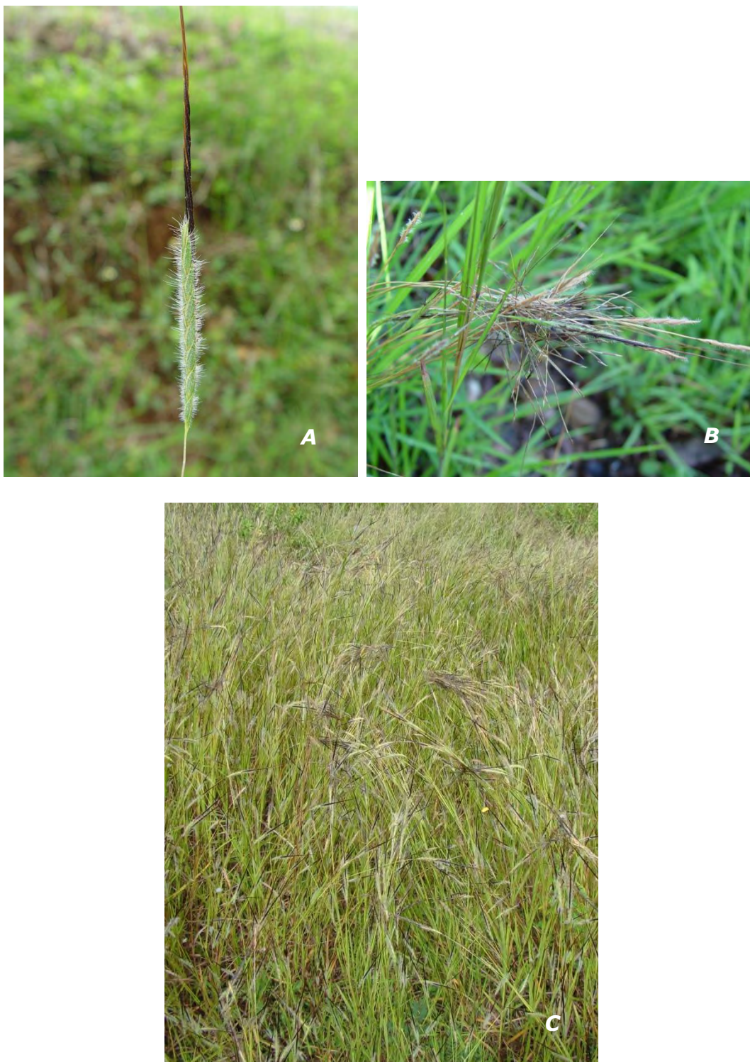
Heteropogon contortus (L.) Beauv. ex Roem. & Shultes A inflorescencia/ inflorescence ; B aristas entrelazadas/ awns interwining ; C plantas/ plants .