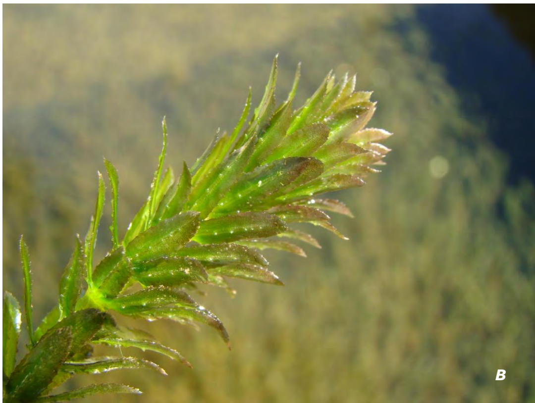
Hydrilla verticillata (L. f.) Royle A plantas/ plants ; B rama/ branch .