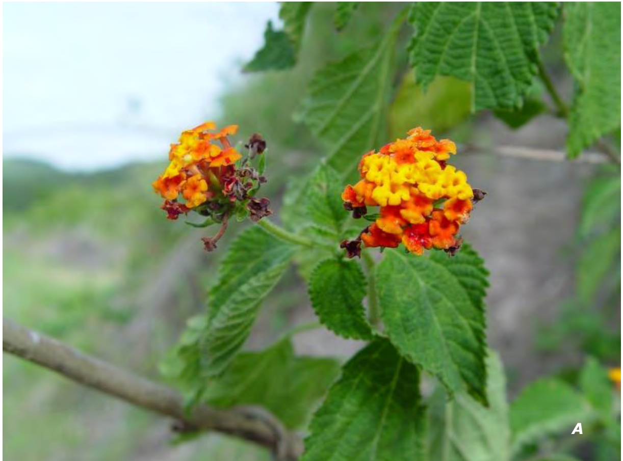
Lantana camara L. A inflorescencia/ inflorescence .