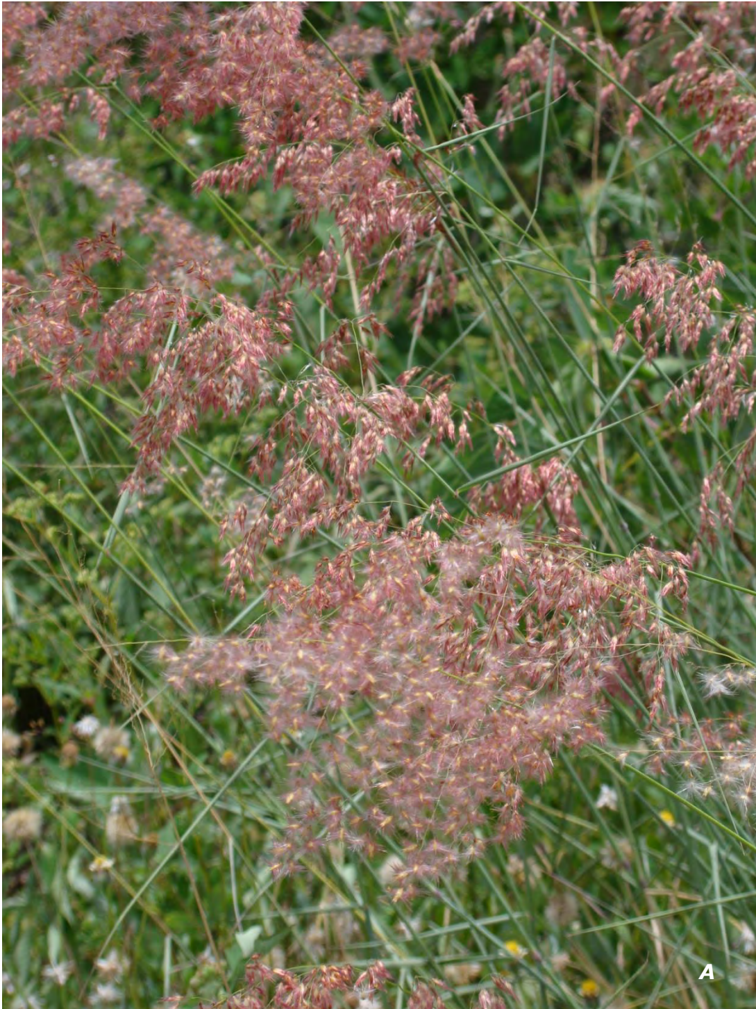
Melinis repens (Willd.) Zizka A inflorescencias/ inflorescences .