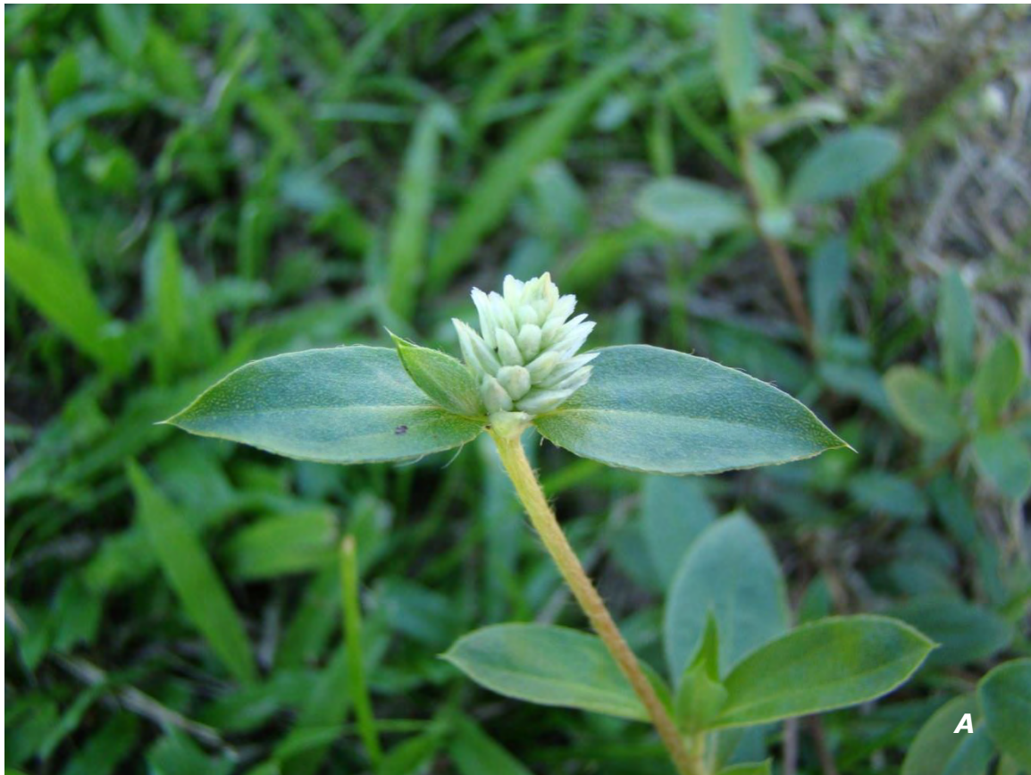
Gomphrena serrata L.