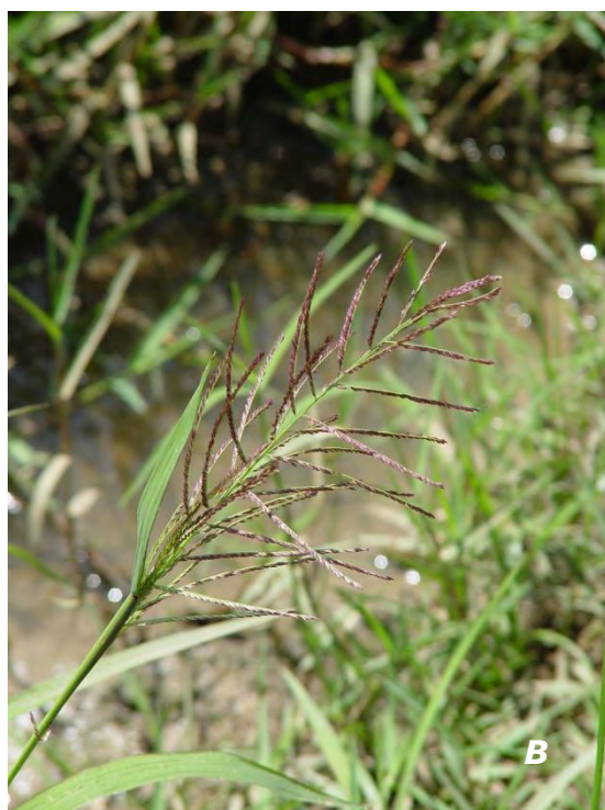
Leptochloa panicea (Retz.) Ohwi subsp. brachiata (Steud.) N. W. Snow A & B inflorescencias/ inflorescences .