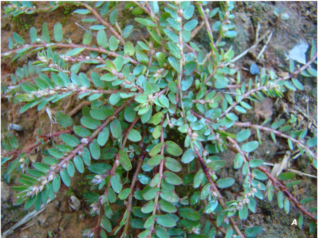
Euphorbia prostrata Aiton