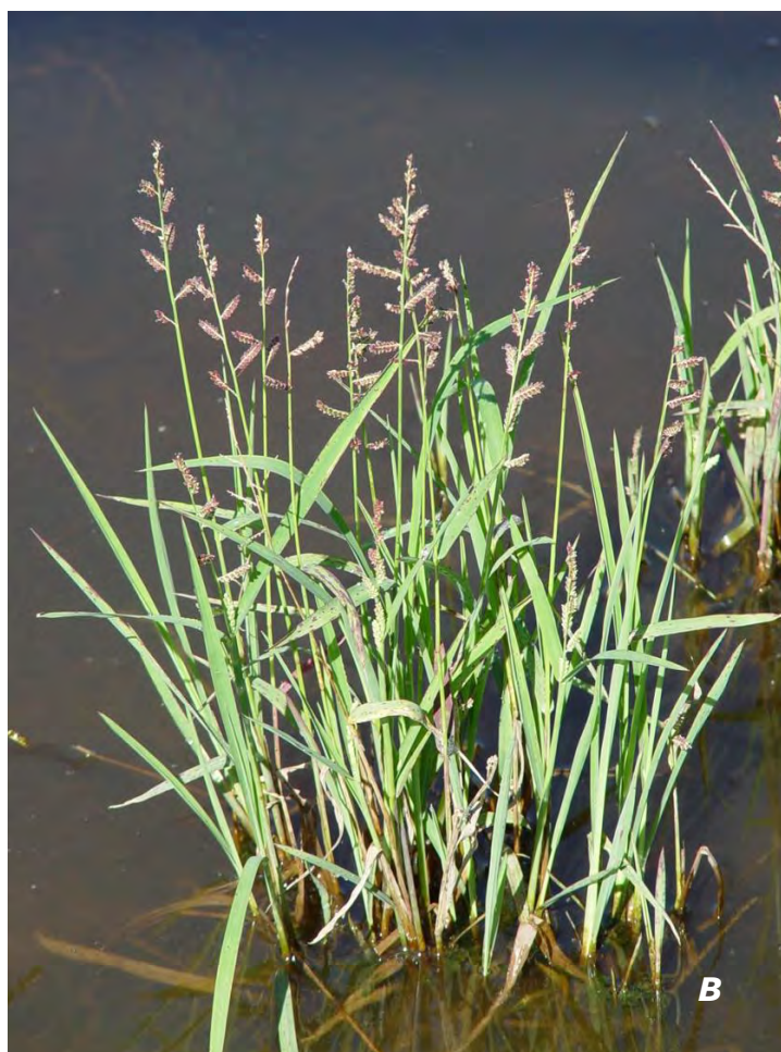
Echinochloa colona (L.) Link A inflorescencias/ inflorescences ; B planta/ plant .