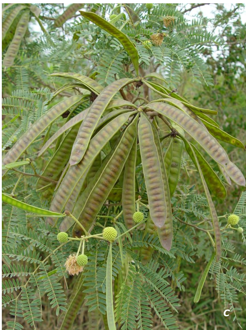
Leucaena leucocephala (Lam.) De Wit A inflorescencia/ inflorescence ; B flor/ flower ; C legumbres/ legumes .