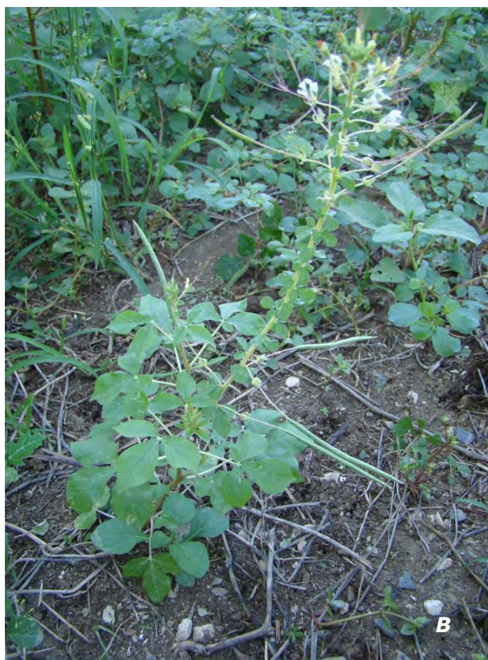
Gynandropsis gynandra (L.) Briq. A inflorescencia/ inflorescence ; B planta/ plant .