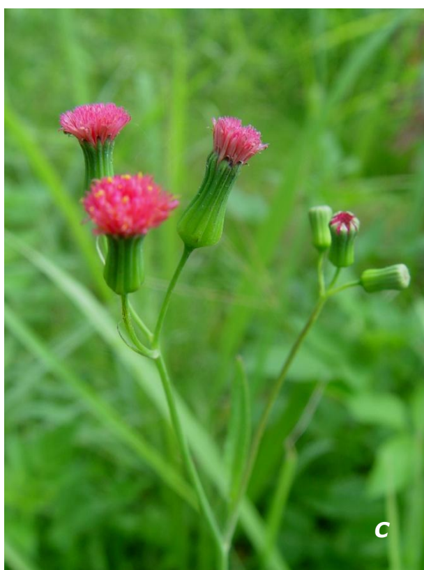
Emilia fosbergii Nicolson

A hoja/leaf; B planta/plant; C inflorescencia/inflorescence.