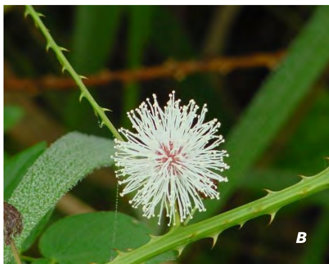
Mimosa casta L. A plantas/plants; B flor/flower.