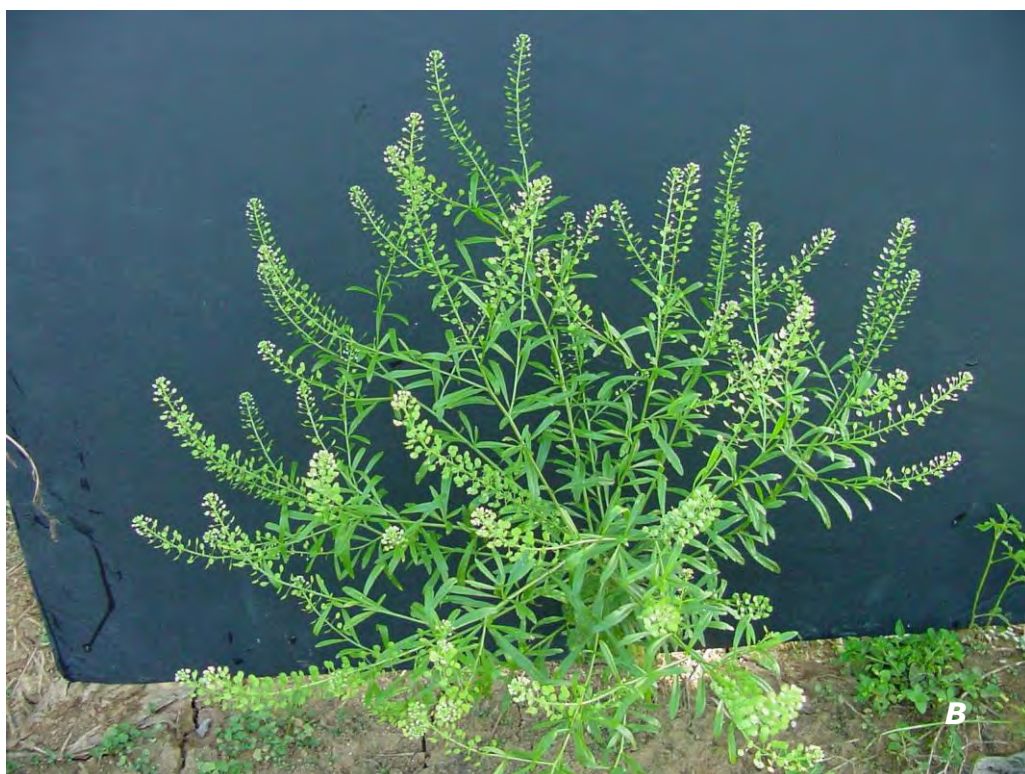
Lepidium virginicum L. A plántula/ seedling ; B planta/ plant .