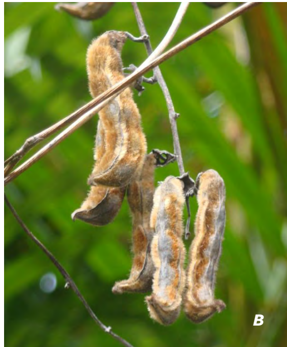
Mucuna pruriens (L.) DC. var. pruriens A hojas/ leaves ; B legumbre/ legume .