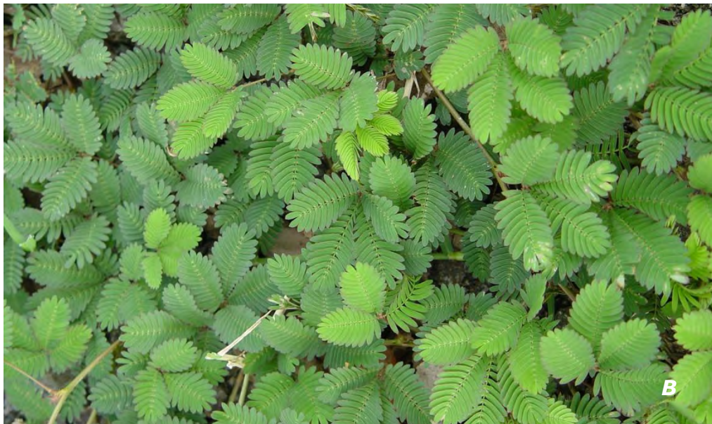
Mimosa pudica L. A flor/ flower ; B plant/ planta .