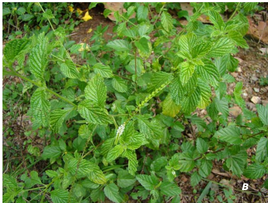
Heliotropium angiospermum Murray A inflorescencia/ inflorescence ; B planta/ plant .