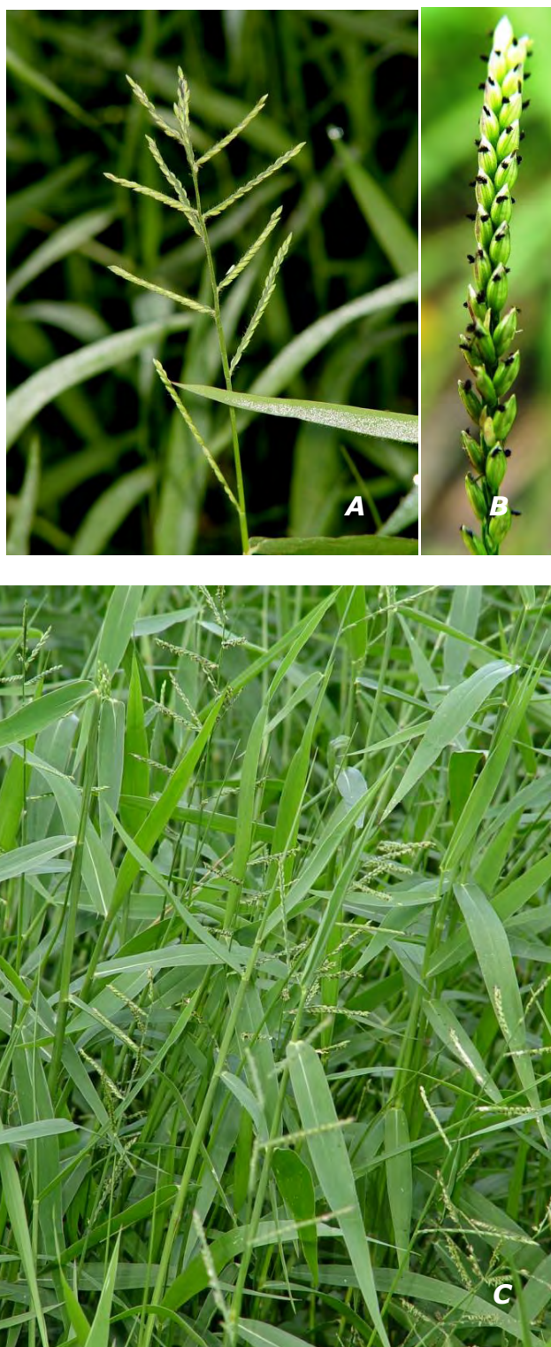
Eriochloa polystachya Kunth

A inflorescencia/ inflorescence ; B racimo/ raceme ; C plantas/ plants .