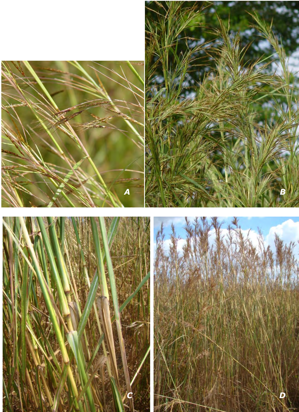
Hyparrhenia rufa (Nees) Stapf

A & B inflorescencias/inflorescences; C tallos/stems; D plantas/plants.