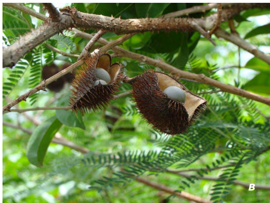
Guilandina bonduc L. A planta/ plant ; B legumbre/ legume .