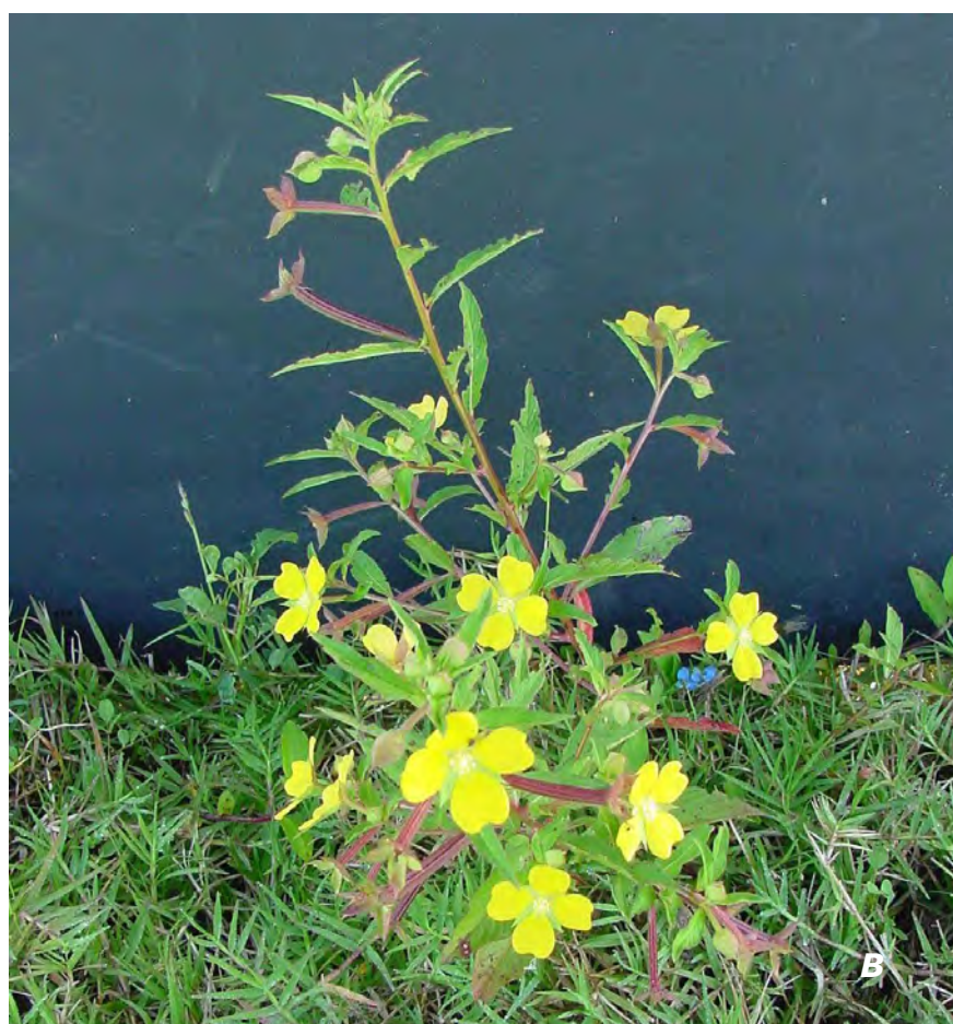
Ludwigia octovalvis (Jacq.) P.H. Raven A flor/ flower ; B planta / plant .