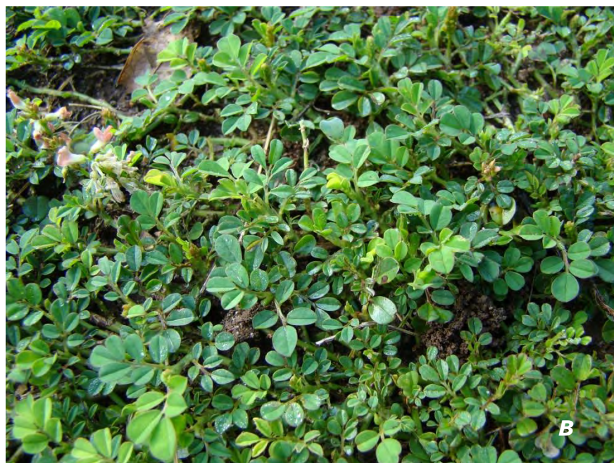
Indigofera spicata Forssk. A flores/flowers; B plantas/plants.