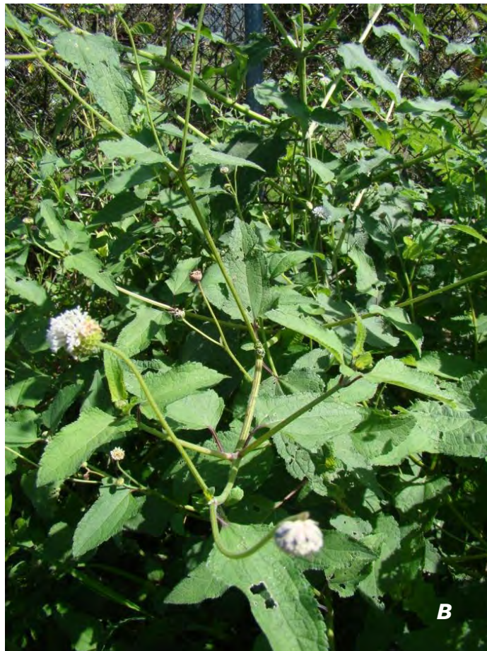
Melanthera nivea (L.) Small A flor/flower; B planta/plant.