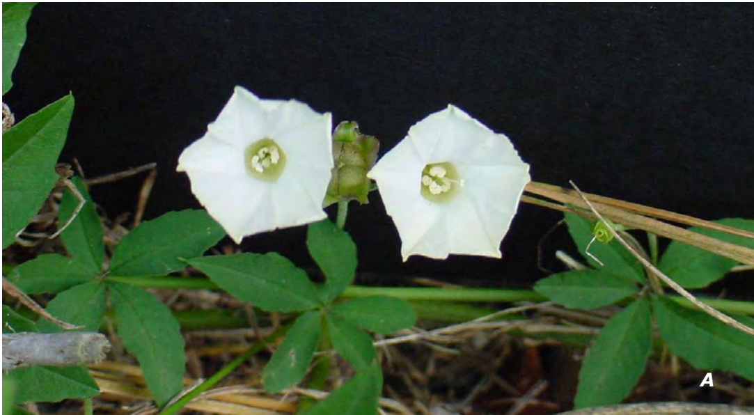
Merremia quinquefolia (L.) Hallier f.