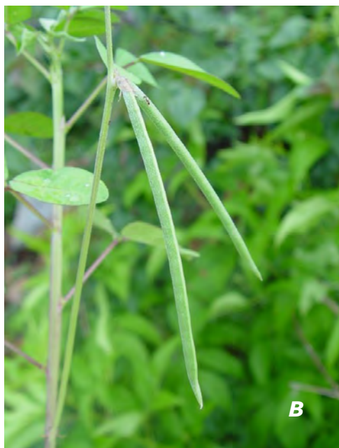
Macroptilium lathyroides (L.) Urb. A planta/ plant ; B legumbre/ legume .