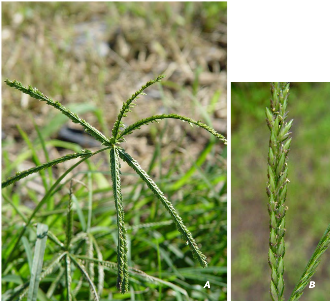
Eleusine indica (L.) Gaertn. A inflorescencia/ inflorescence ; B racimo/ raceme .