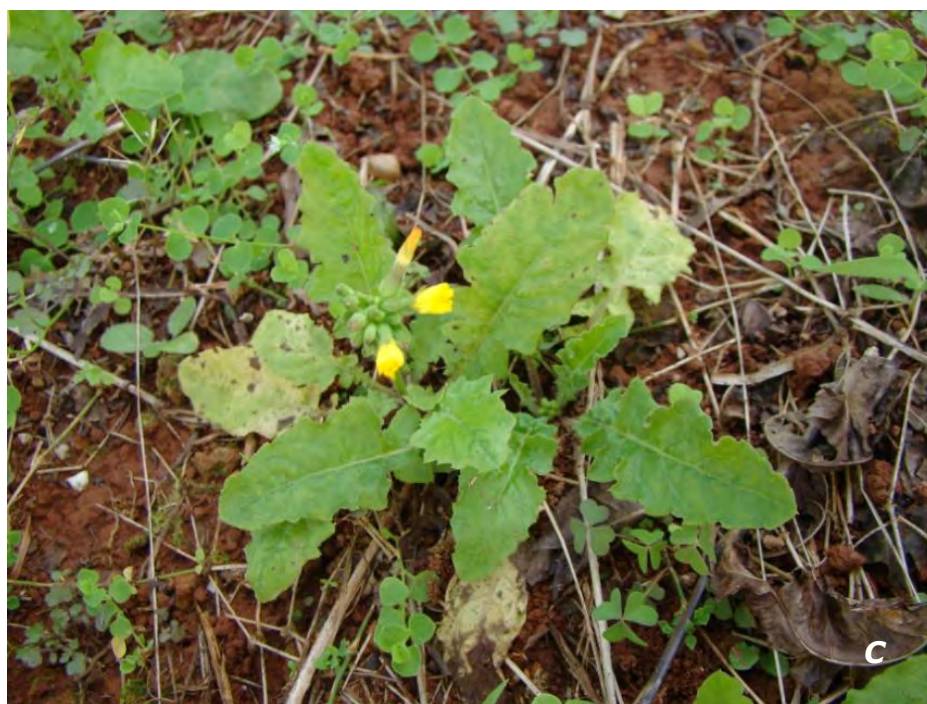
Launaea intybacea (Jacq.) Beauv. A & B inflorescencias/ inflorescences ; C planta/ plant .