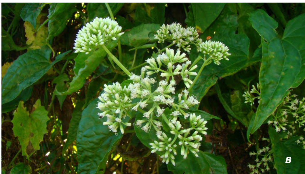
Mikania congesta DC.

A & B hojas e inflorescencias/leaves and inflorescences.