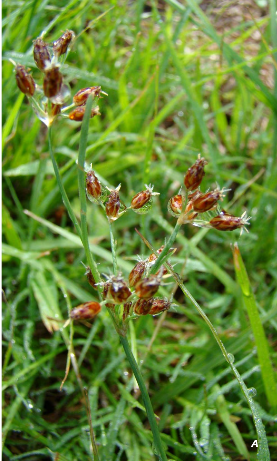
Fimbristylis dichotoma (L.) Vahl A planta/ plant.