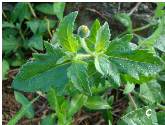
Tridax procumbens L.

A flor/flower; B fruto/fruit; C planta/plant.