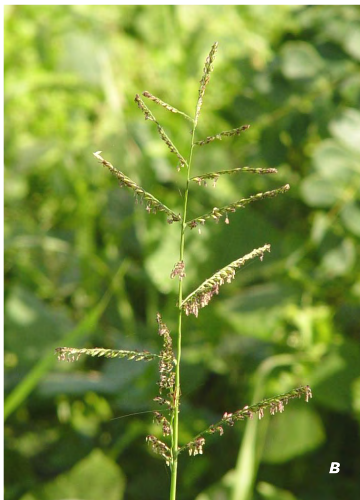
Urochloa mutica (Forssk.) T.Q. Nguyen A tallo y hojas/ stem and leaves ; B inflorescencia/ inflorescence .