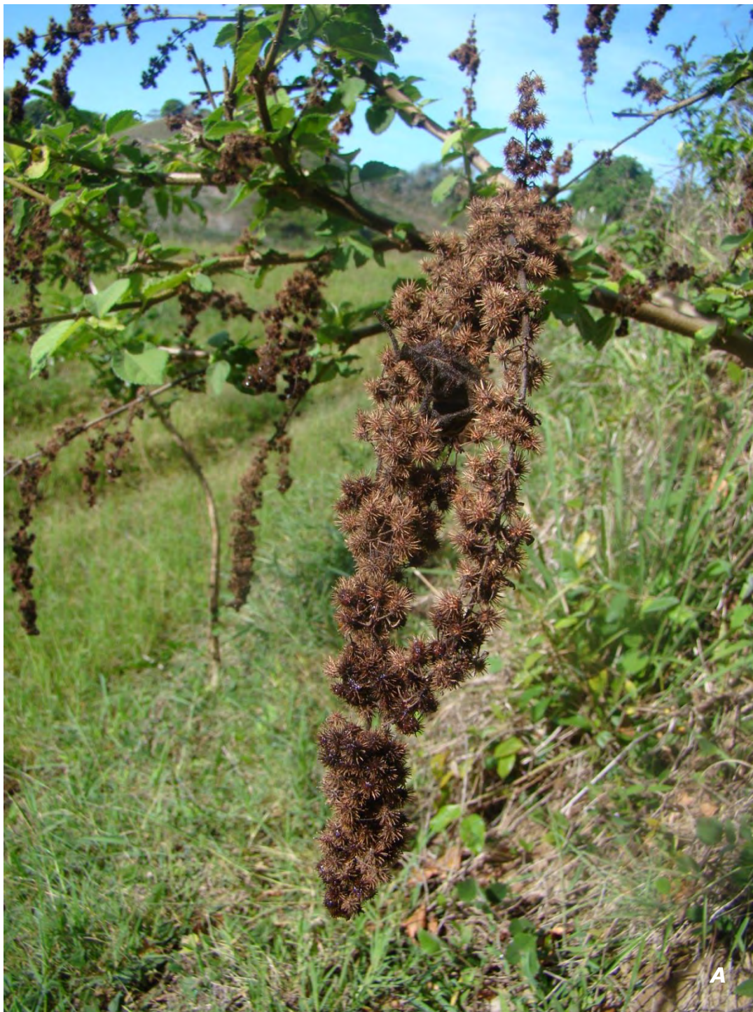
Triumfetta semitriloba Jacq. A inflorescencia/ inflorescence .