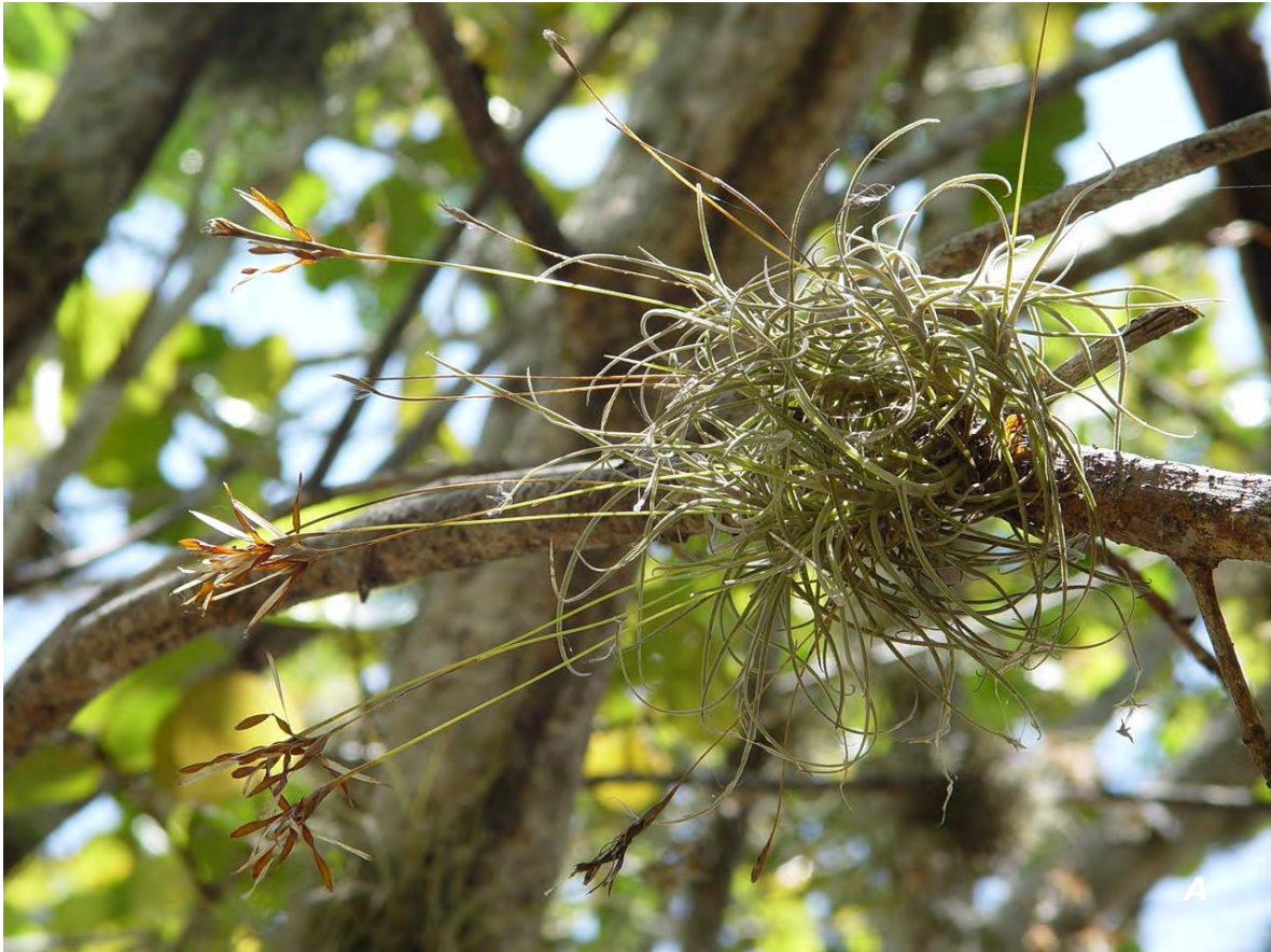
Tillandsia recurvata (L.) L. A planta/ plant .