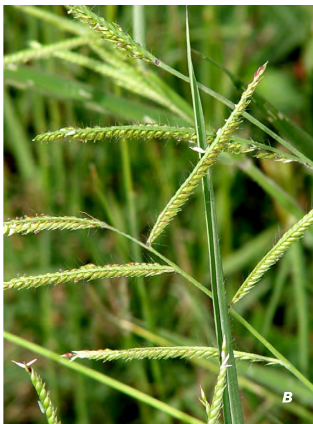
Urochloa mosambicensis (Hack.) Dandy A hojas/leaves; B inflorescencias/inflorescences.