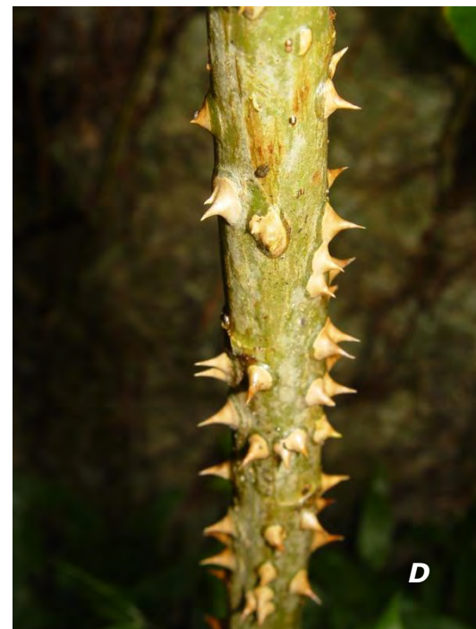
Urea baccifera (L.) Gaudich. A inflorescencia/ inflorescence ; B hojas y tallos/ leaves and stems ; C hoja/ leaf ; D tallo/ stem .