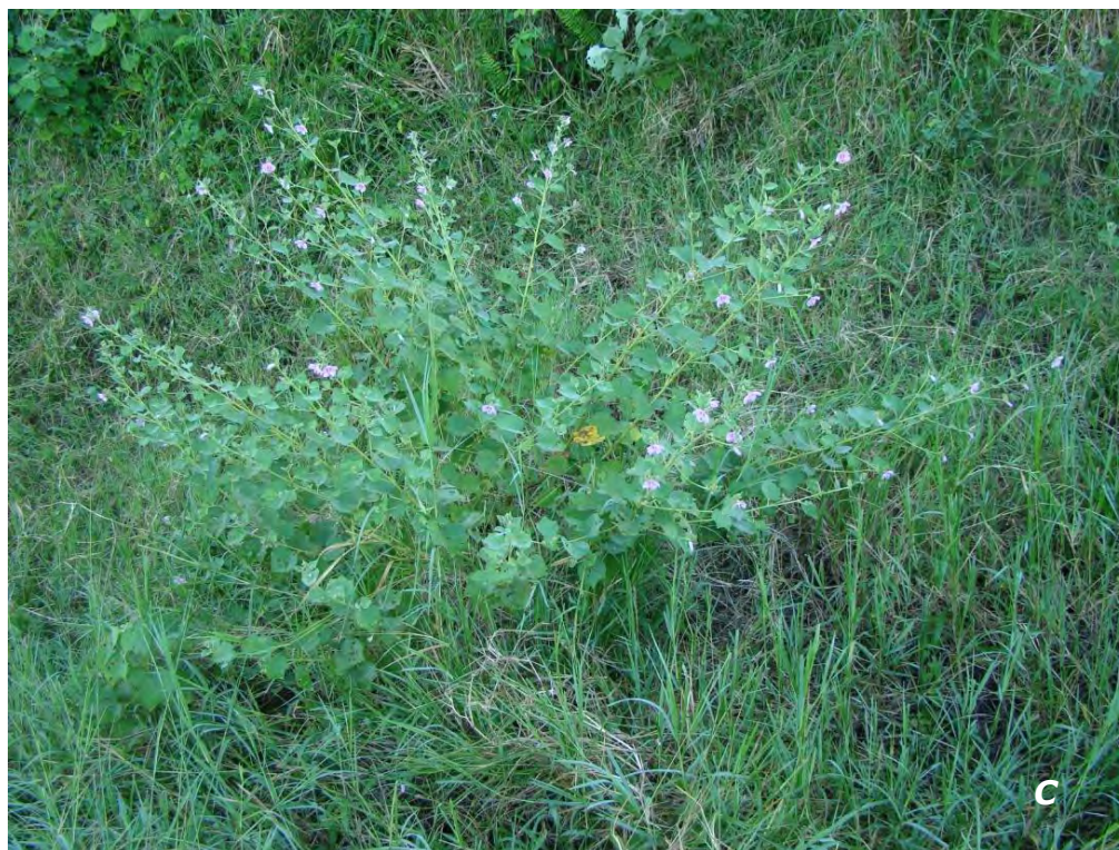
Urena lobata L.

A flor/flower; B hojas/leaves; C planta/plant.