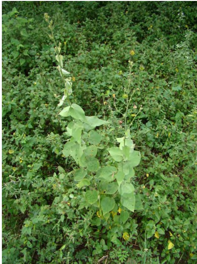
Wissadula hernandioides (L' Hér.) Garcke A flor/flower; B fruto/fruit; C planta/plant.