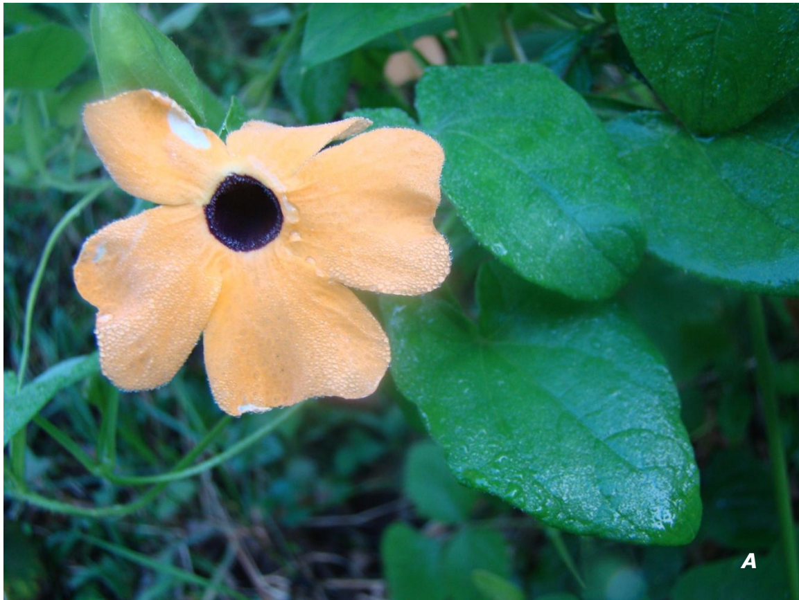
Thunbergia alata Bojer ex Sims A hojas y flor/ leaves and flower .