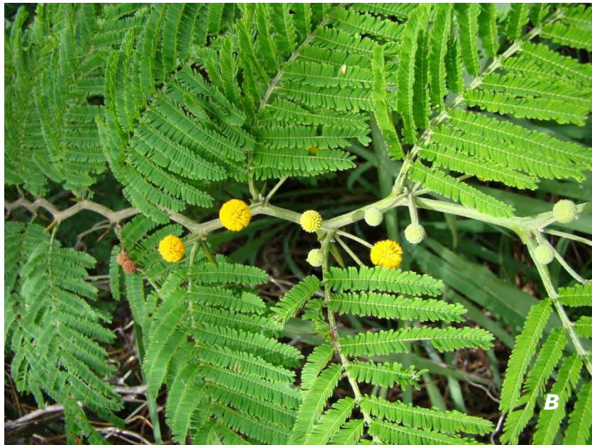
Vachellia macracantha (Humb. & Bonpl. ex Willd.) Seiger & Ebinger A tallo y legumbres/ stems and legumes ; B tallo, hojas y flores/ stem, leaves and flowers .