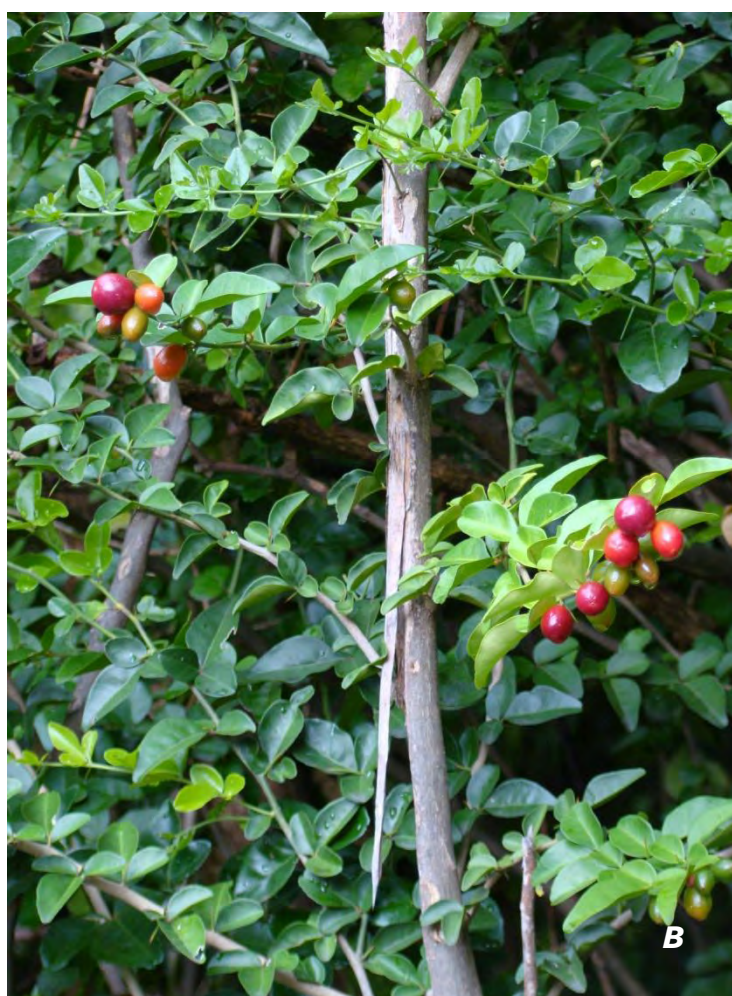
Triphasia trifolia (Burm.f.) P. Wilson A & B plantas y frutos/ plants and fruits .