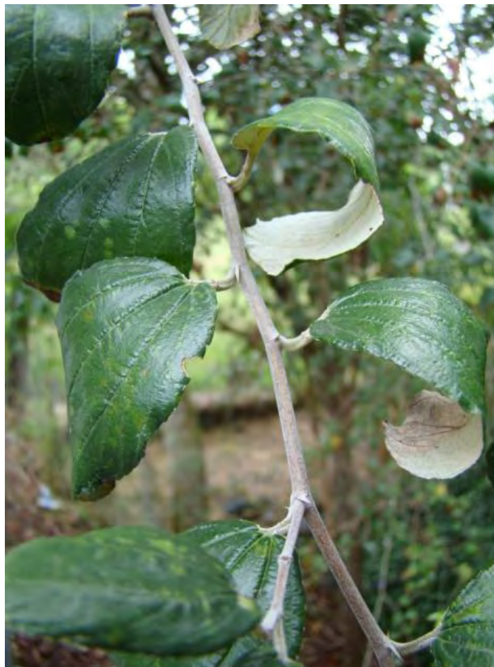
Ziziphus mauritiana Lam.

A inflorescencia/ inflorescence ; B tallos/ stems ; C hojas/ leaves .