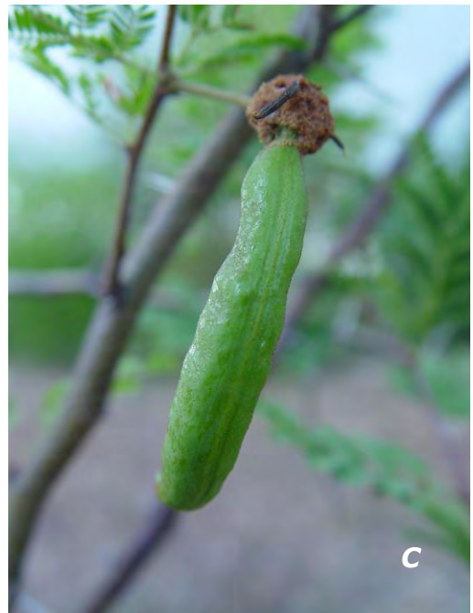
Vachellia farnesiana (L.) Wight & Arn.

A tallo/ stem ; B inflorescencias/ inflorescences ; C legumbre/ legume .