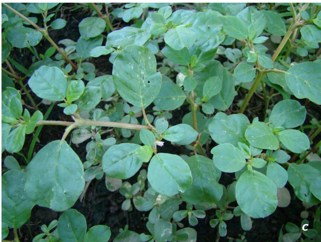
Trianthema portulacastrum L.