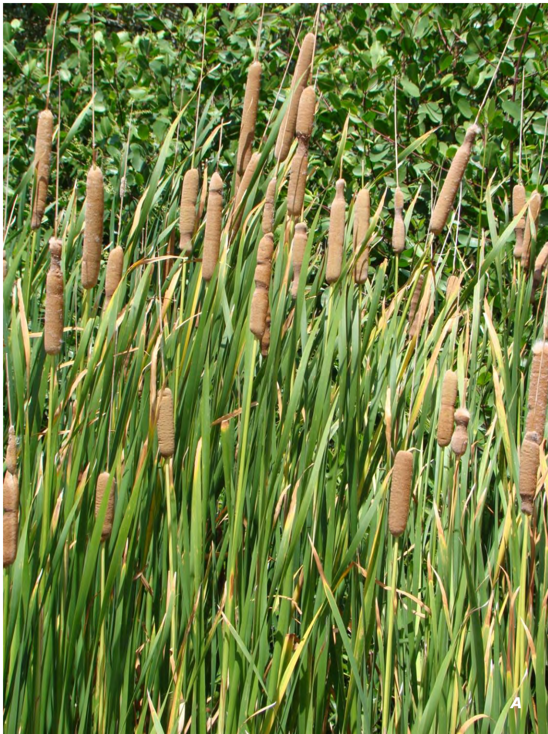
Typha domingensis Pers.