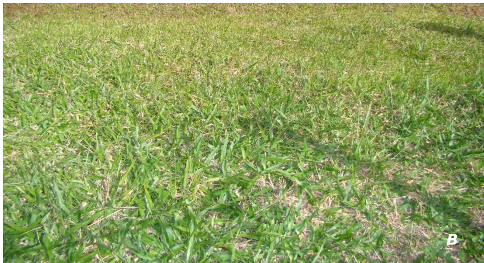
Urochloa brizantha (Hochst. Ex A. Rich) R. D. Webster A inflorescencia/ inflorescence ; B plantas/ plants .