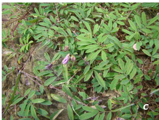
Tephrosia cinerea (L.) Pers. A flores/ flowers ; B legumbre/ legume ; C planta/ plant .