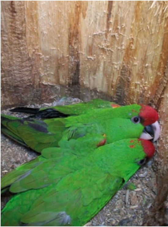
Cotorras serranas

Las cotorras serranas se reproducen en colonias de anidación y el número promedio de crías es de 2 pollos por nido (Macías Caballero 1999, Monterrubio-Rico et al. 2002), aunque en años poco favorables la productividad puede disminuir drásticamente. Una pareja de cotorra serrana occidental pone en promedio 2.7 huevos por nidada y tiene un desempeño reproductivo de 1.6 volantones por nidada (Monterrubio-Rico y Enkerlin, 2004). Los pollos son criados en sincronía con la maduración de semillas de pino, usualmente a finales del verano y el otoño (Juniper y Parr, 1998). En el Parque Nacional Cumbres de Monterrey, se registró que la cotorra serrana oriental produjo 1.09, 1.31, 1.9, 1.8 y 1.3 pollos en promedio por nido en 2003, 2004, 2005, 2006 y 2007 respectivamente (CONANP 2006; Ortiz-Maciél y Valdez Peña, 2007). Asimismo, Valdez-Juárez (2006) registró en una colonia de dicho Parque, que el 86% de los nidos iniciados tienen éxito en la