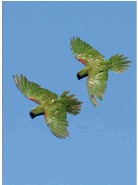
Cotorras serranas / Fotografía: René Valdés

Otros problemas que se han mencionado para estas especies son la baja tasa de reclutamiento y el tamaño pequeño de las poblaciones (SEMARNAP-INE, 2000). Esto ocasiona que sean pocos los nuevos individuos que reemplacen a los que mueren o son robados, agravando el problema del poco incremento en el tamaño poblacional. El pequeño tamaño poblacional causa susceptibilidad hacia eventos catastróficos, como incendios que pueden acabar súbitamente con el grupo de individuos entero.