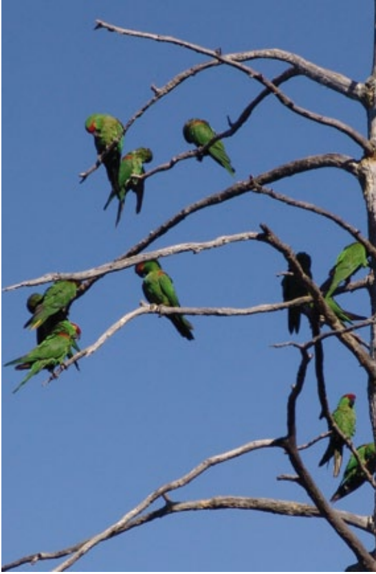
Cotorras serranas / Fotografía: ITESM

y San Antonio de la Osamenta). Estos autores indican que la especie anida cerca de fuentes de agua (ríos) en un rango igual o menor a la distancia de recorrido diario promedio de 23.7 km reportado por Ortíz-Maciel (2000).