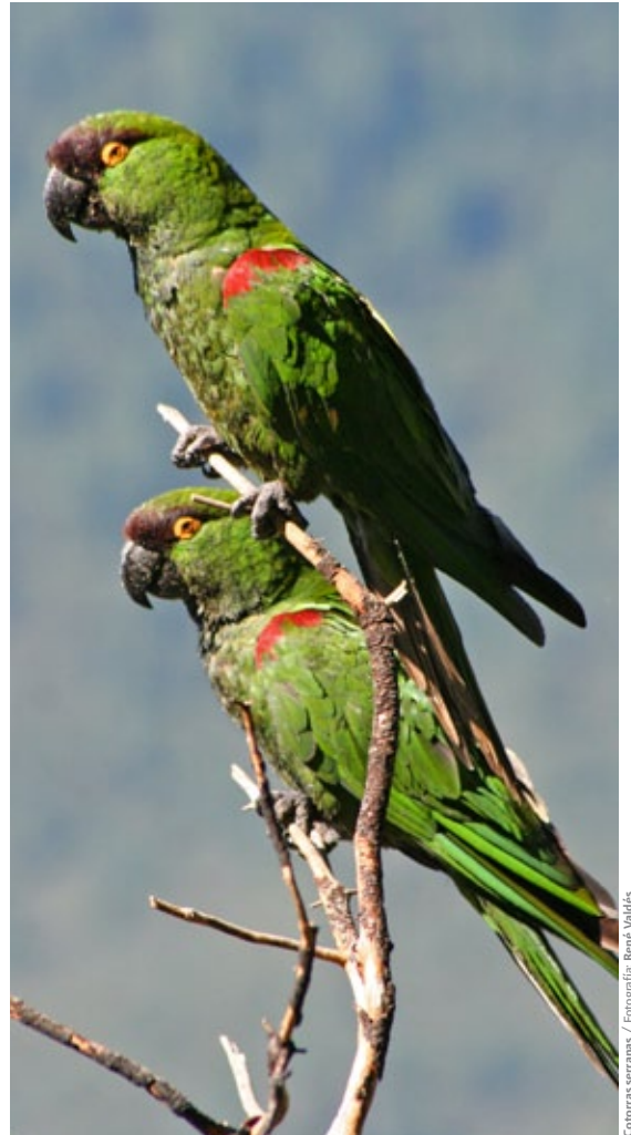
Cotorras serranas

pobladores acceder a recursos económicos derivados de la conservación, intentando con esto, no solo influir en el mejoramiento de las condiciones de las cotorras serranas, sino también en las condiciones y calidad de vida de los habitantes de estas áreas.