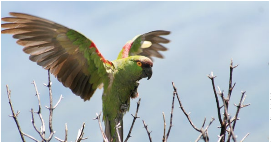
Cotorras serranas

Entre el 40% y el 45% de las parejas reproductivas se concentran en El Taray, en Coahuila (Enkerlin et al. , 1998). Éstas, sumadas a las parejas que habitan en las colonias de Condominios, Santa Cruz y San Antonio de la Osamenta en el Parque Nacional Cumbres de Monterrey, albergan el 80-84% de las parejas reproductivas para esta especie. Enkerlin et al. (1999) reportaron la existencia de 21 colonias de anidación para la cotorra serrana oriental, de las cuales, ocho no habían sido documentadas antes de 1994. En estos sitios de anidación