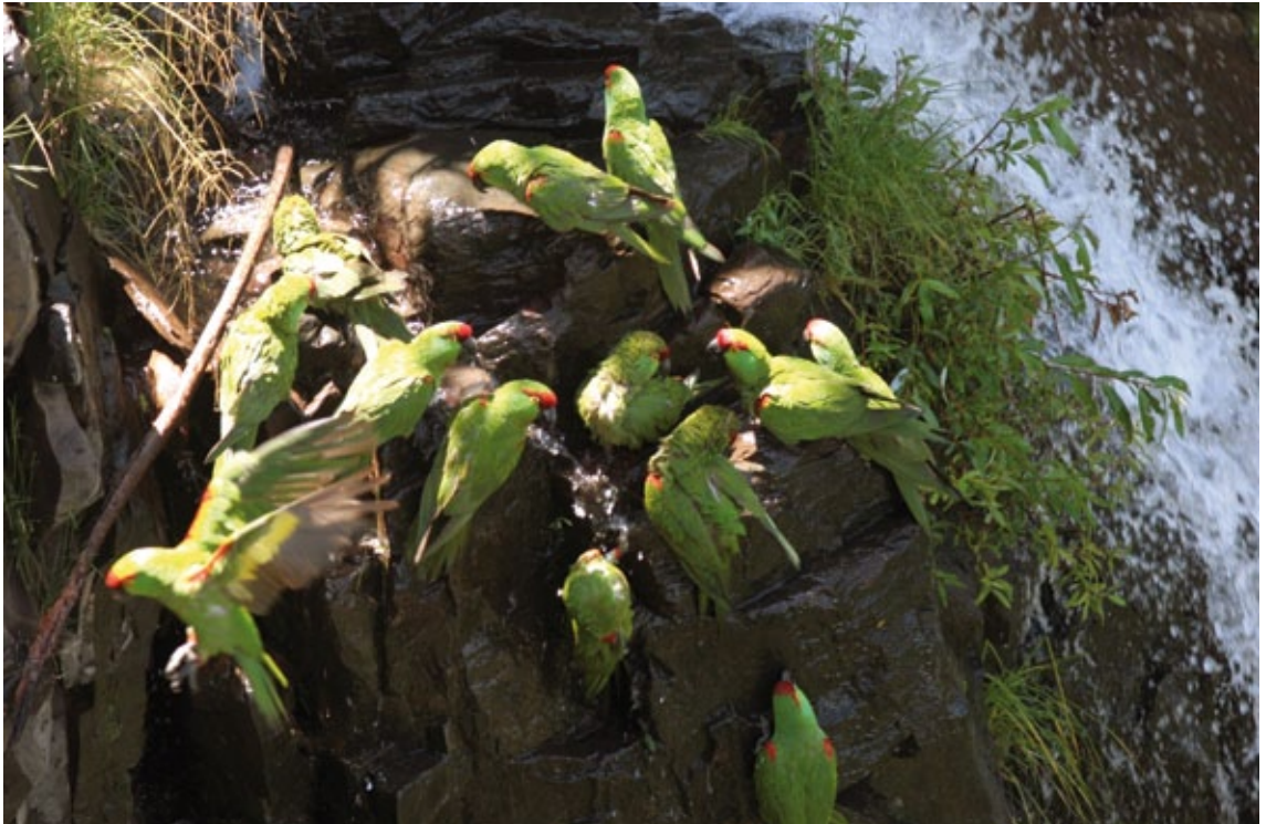
Cotorras serranas

el PNCM, se reporta que los sitios de mejor calidad de hábitat parecen estar dominados por bosque de oyamel, bosque de pino y bosque de encino de igual manera que en regiones como en el municipio de Arteaga, Coahuila y La Huasteca en Santa Catarina, y Puerto La Manteca en Santiago, Nuevo León (CONANP-UANL, 2008). Con respecto a la fauna, la cotorra occidental comparte el hábitat con otras especies como el oso negro ( Ursus americanus ), el jaguar ( Panthera onca ), el puma ( Felis concolor ), el águila real ( Aquila chrysaetos ), el águila solitaria ( Harpyhaliaetus solitarius ), el guajolote silvestre ( Meleagris gallopavo ), (CONANP – Pronatura Sur, 2008), el venado cola blanca ( Odocoileus virginianus ), el coati ( Nasua narica ), el aguililla cola roja ( Buteo jamaicensis ) (Sánchez-Mateo et al., 2007), entre otras, cuyas poblaciones han disminuido por diversas razones por la