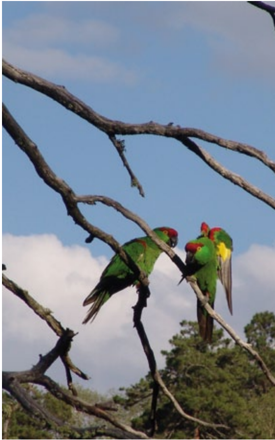
Cotorras serranas