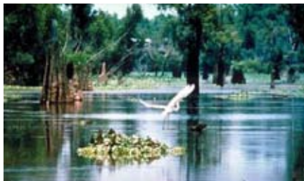
Quang cảnh Vịnh Atchafalaya