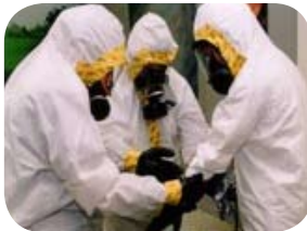
PPE Cấp C cùng bộ áo liền quần Tyvek và Máy Trợ Thở Lọc Không Khí (Kính An Toàn APR)