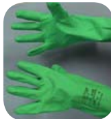
Các Mẫu Găng Tay Nitrile