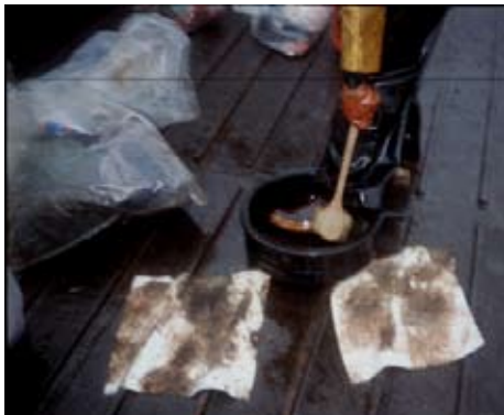
Rửa giày ống khử nhiễm tại hiện trường