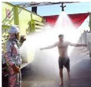
Khử nhiễm chung: ảnh IUOE