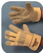
Các Mẫu Găng Tay Da