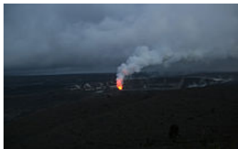
SO 2 Plume