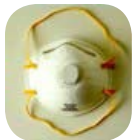
Mặt nạ trợ thở N-95