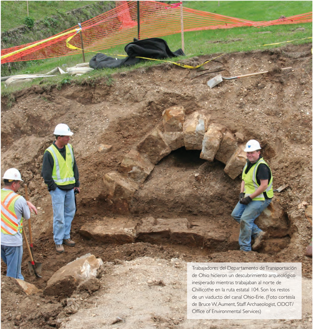
Trabajadores del Departamento de Transportación de Ohio hicieron un descubrimiento arqueológico inesperado mientras trabajaban al norte de Chillicothe en la ruta estatal 104. Son los restos de un viaducto del canal Ohio-Erie.