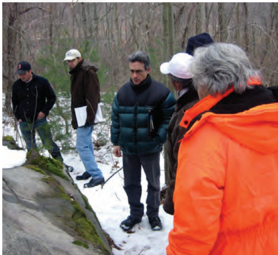
Consulta según la Sección 106 con una tribu indígena