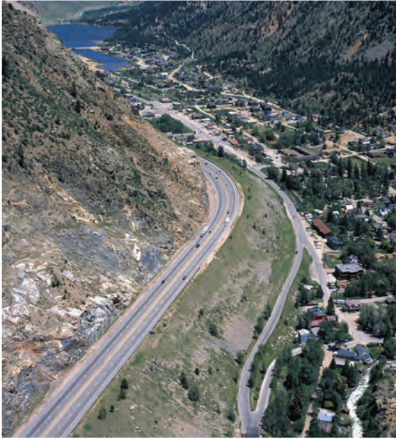
La autopista interestatal I-70 en el Hito Histórico Nacional Georgetown-Silver Plume, Colorado. Se esperaba impacto sobre los históricos pueblos de montaña por la expansión planificada de la ruta.

A veces, la participación federal es obvia. A menudo, no es inmediatamente aparente. Si tiene alguna pregunta, comuníquese con el patrocinador del proyecto para obtener información adicional y averiguar sobre la participación federal. Todas las agencias federales tienen sitios web. Muchos listan contactos regionales o locales e información sobre los proyectos grandes. El SHPO/THPO/tribu, las comisiones de planificación estatales o locales o las organizaciones de conservación histórica del estado también pueden contar con información sobre el proyecto.