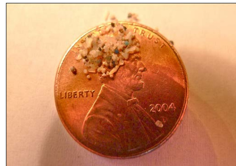
Exemple de microplastiques retrouvés dans les Grands Lacs.

Le Partenariat du lac Supérieur appuie les mesures visant à réduire ces polluants et aide à informer le public sur les nouvelles substances chimiques préoccupantes et les microplastiques. Par exemple, EcoSuperior, à Thunder Bay (Ontario) a créé une fiche de renseignements sur les microplastiques et organise un café scientifique public visant à sensibiliser les gens et à encourager la discussion sur cet enjeu.