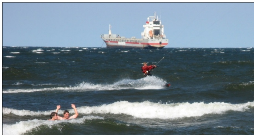
Le lac Supérieur, une destination de choix pour l'écotourisme, soutient également des industries comme le transport maritime de marchandises et l'exploitation minière.

Dans le cadre de l'Accord relatif à la qualité de l'eau dans les Grands Lacs, les intervenants du Partenariat du lac Supérieur élaborent actuellement deux nouveaux outils d'aménagement panlacustre : 1) un Plan d'action et d'aménagement panlacustre (PAAP) de cinq ans et 2) des objectifs liés à l'écosystème du lac visant à évaluer des paramètres tels que la qualité de l'eau et la santé de l'écosystème du lac. De plus, le cadre de gestion des eaux littorales permettra à l'avenir de déterminer les secteurs près de la côte qui ont une valeur écologique élevée et qui sont potentiellement vulnérables à des facteurs de stress élevés. Vous trouverez plus d'information sur ces outils à binational.net .