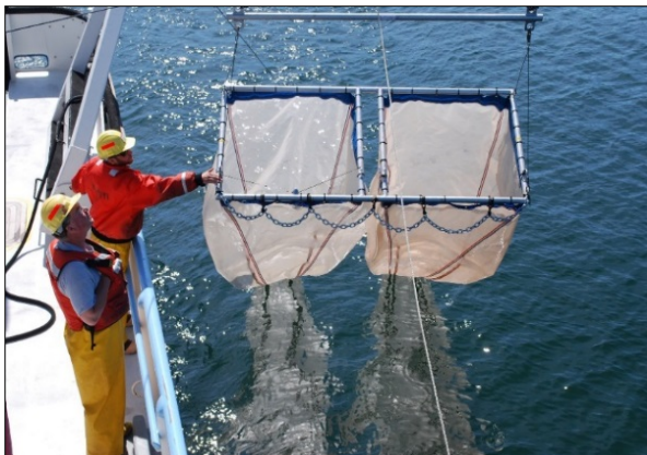
La prochaine année de surveillance intensive du lac Supérieur est 2016.