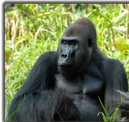
Gorille à dos argenté ( Gorilla gorilla )

oppement d'une gestion soutenable de leurs ressources naturelles et en continuant le programme d'éducation à l'environnement en cours en mettant un accent accru sur les communautés clés pour la conservation des Orangs-outans.