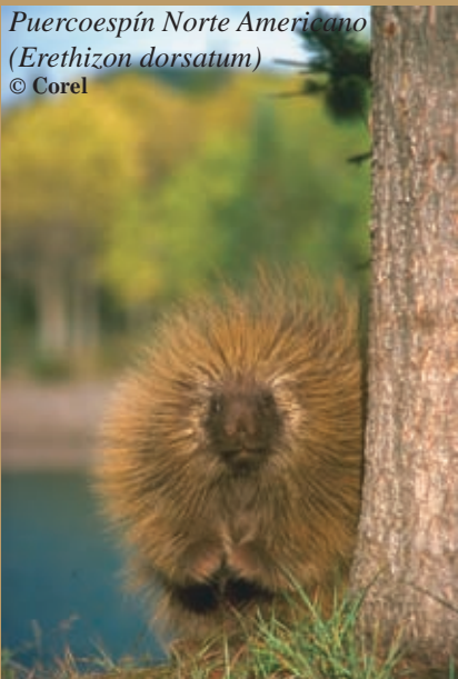
Puercoespín Norte Americano ( Erethizon dorsatum )