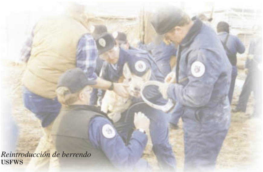
Reintroducción de berrendo USFWS