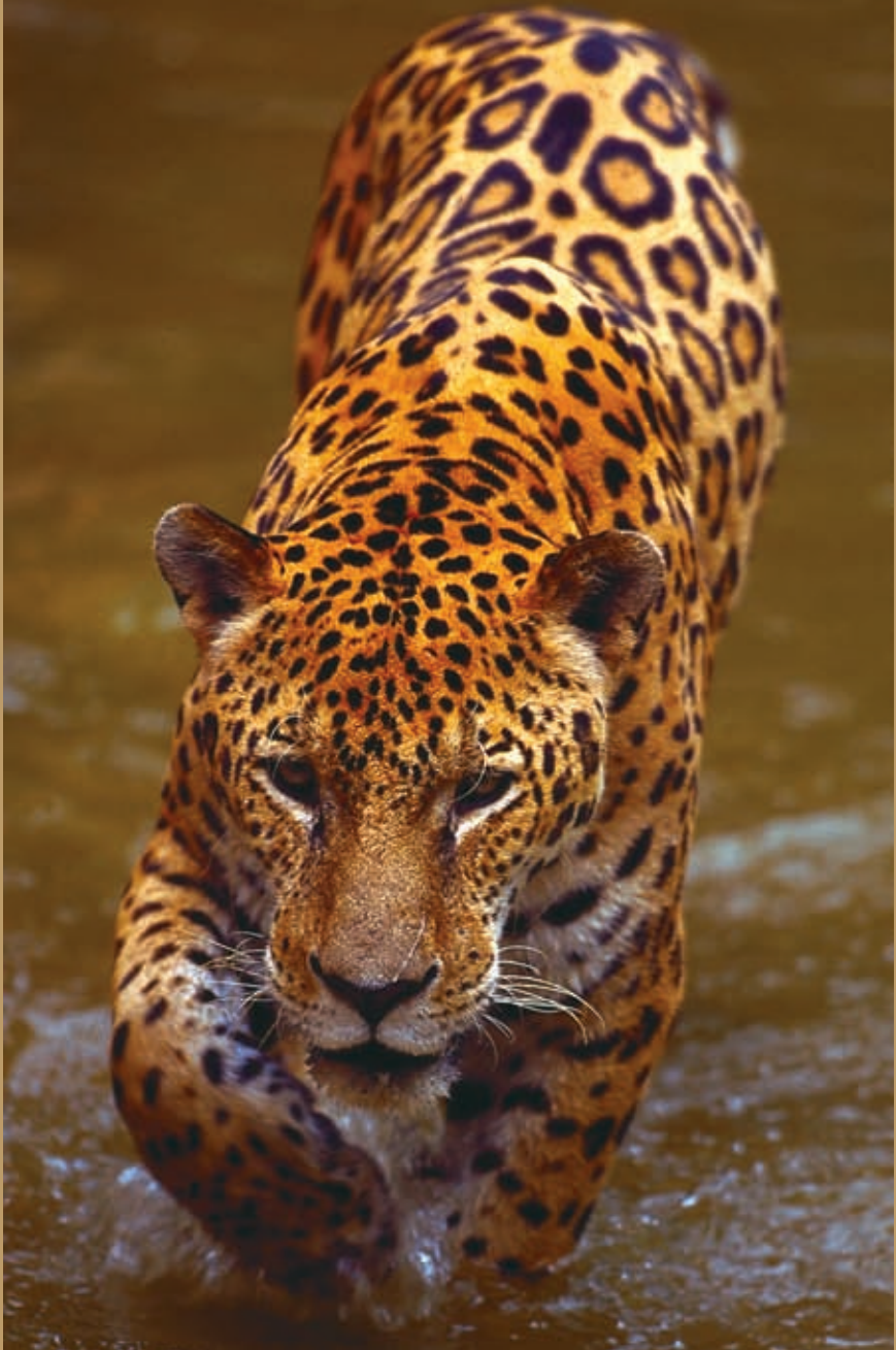
Jaguar (Panthera onca)

“Promover estrategias cooperativas e integrales y la aplicación de acciones trilaterales para la conservación de plantas y animales silvestres nativos de interés y el control de las especies invasoras a través de América del Norte.”