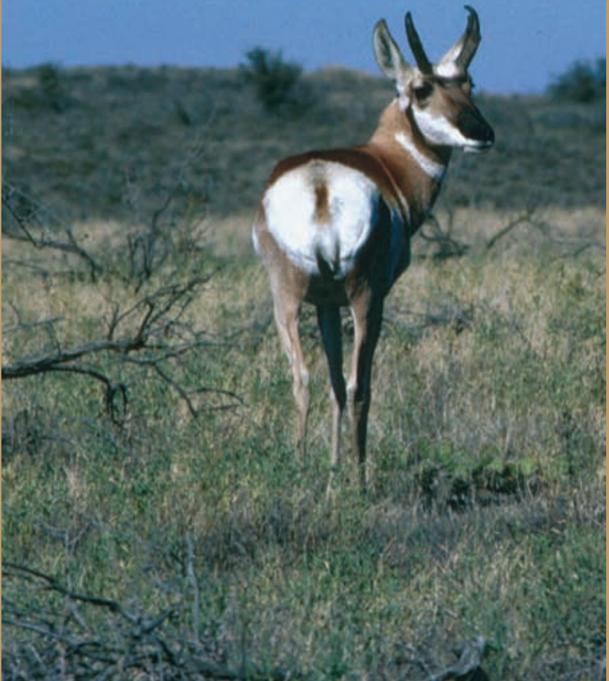
Berrendo (Antilocapra americana)

“Propiciar la colaboración con respecto a áreas designadas para la conservación, a fin de asegurar la protección, manejo y restauración de los ecosistemas de América del Norte y su biodiversidad.”