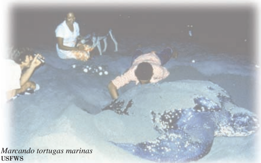
Marcando tortugas marinas USFWS

Como una entidad líder para la conservación de la biodiversidad en América del Norte, el Comité Trilateral proporciona un mecanismo efectivo y eficiente para atender la conservación y manejo de los recursos naturales a escala continental. Aquí se presentan algunos de los aspectos más relevantes logrados en la historia de este Comité. Igualmente importantes son los muchos logros intangibles que no se pueden medir fácilmente. El Comité Trilateral proporciona un foro único para entender mejor los diferentes factores que influyen las políticas nacionales en cada país. Trabajando juntas, las naciones asociadas al Comité Trilateral pueden enfrentar mejor los desafíos que representa avanzar hacia un futuro sustentable para América del Norte.