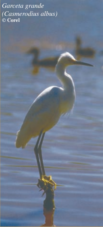
Garceta grande ( Casmerodius albus )