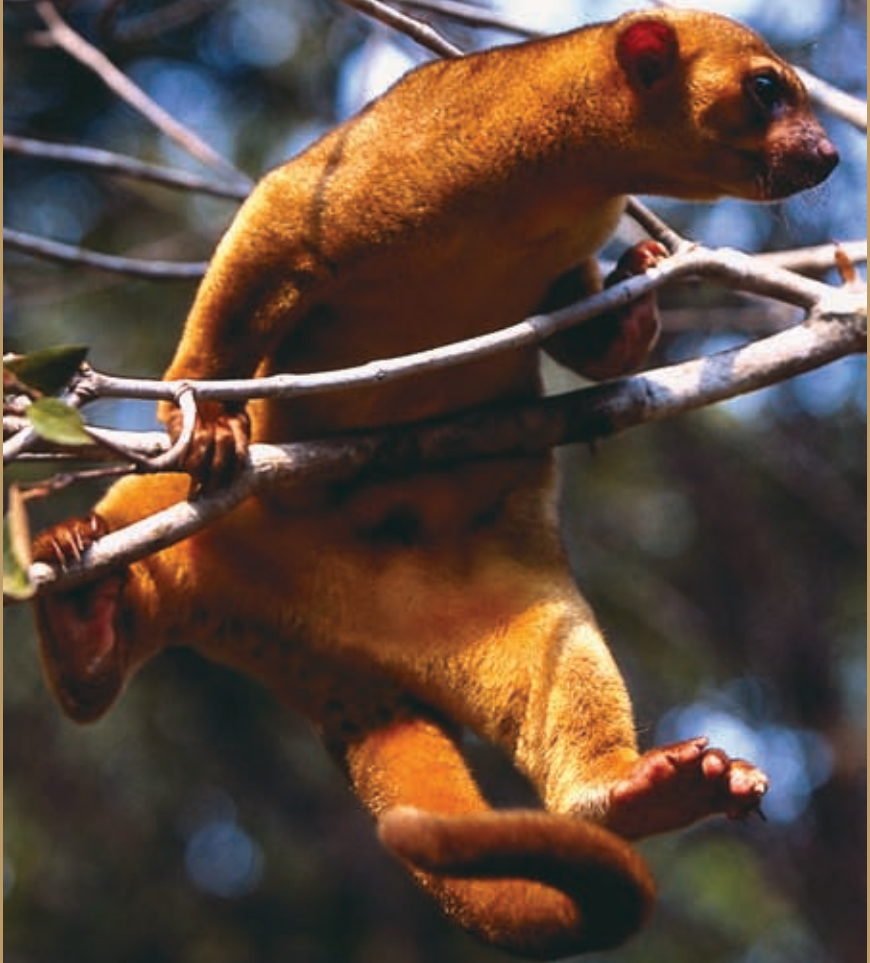
Martucha (Potos flavus)

Chan K'in Anciano de los Lacandones Chiapas, Mexico