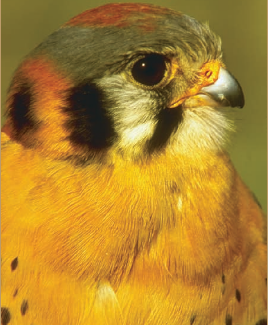
Cernícalo americano (Falco sparverius)

“Propiciar la colaboración para la conservación de las aves migratorias de América del Norte para asegurar la salud y sustentabilidad de las poblaciones compartidas de aves, al mismo tiempo que se contribuye a la conservación de la biodiversidad.”