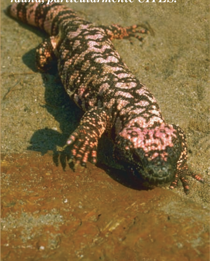
Monstruo de gila (Heloderma suspectum)

“A través del establecimiento de estructuras operativas y administrativas, el Grupo de Aplicación de la Ley sobre Vida Silvestre de América del Norte (NAWEG, por sus siglas en inglés) contribuye a fortalecer la capacidad regional para implementar leyes nacionales y acuerdos internacionales con respecto a fauna, particularmente CITES.”