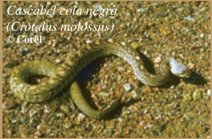
Cascabel cola negra ( Crotalus molossus )