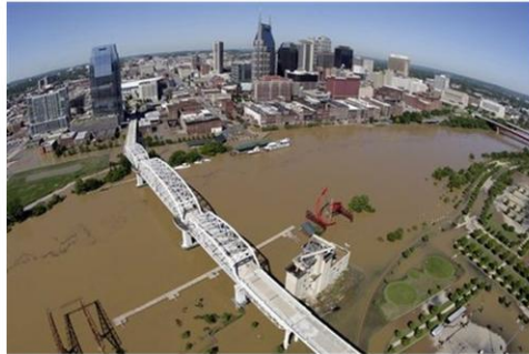
纳什维尔航拍