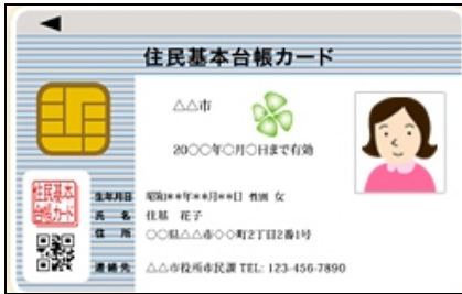
Basic Resident Registration Card (Jyumin Kihon Daichyo Card) Pictured Form Only

Must present one of the below listed official IDs to obtain One Day Guest Pass: