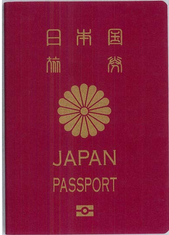
Japan, or Foreign Passport