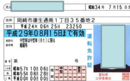
Japanese Driver's License

If your guest has the new form of Japanese driver's license, one of the below listed supplements are accepted to verify nationality: