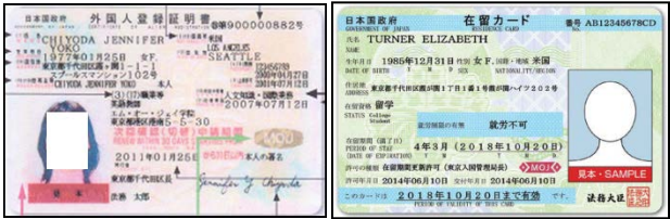
Alien Registration Card or Resident Card Both visa and expiration date must be valid.

“Non Japanese nationals must present passport, Resident card or Alien Registration card.”