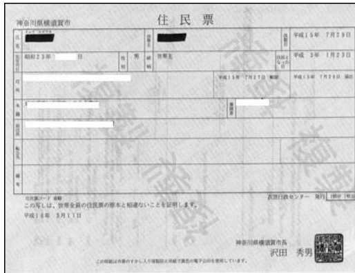
Address Certificate with Permanent Address Obtain after the driver's license's issuance Valid until expiration date of the driver's license