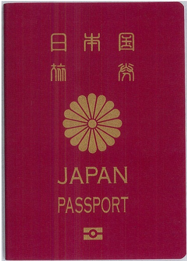
Japan/Foreign Passport Valid visa required for alien.

“Non Japanese nationals must present passport, Resident card or Alien Registration card.”