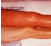
Imagen de una trombosis venosa severa en la pierna izquierda de este paciente.

No todas las TVPs causan síntomas perceptibles, pero los más comunes son el edema y enrojecimiento de la pierna afectada, frecuentemente asociada con algún grado de dolor en la misma zona. Dolor torácico severo o dificultad para respirar podrían indicar una tromboembolia pulmonar (TEP) y esta condición debe de ser evaluada en un centro hospitalario inmediatamente.