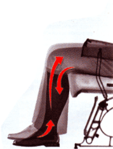
Imagen de calcetines de compresion