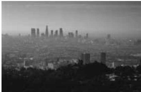
El ozono es el ingrediente principal del smog.

E l ozono, el ingrediente principal del smog, presenta un problema serio para la calidad del aire en muchas partes de los Estados Unidos. Aún a niveles bajos, el ozono puede causar un número de problemas respiratorios. Usted puede tomar unos pasos sencillos, descritos en este folleto, para protegerse del ozono.