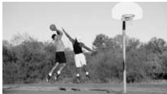
Los niños y adultos de todas las edades que realizan actividades al aire libre tienen mayor riesgo de salud al exponerse al ozono.

En general, a medida que las concentraciones de ozono al nivel del suelo aumentan, más personas sienten los efectos de salud, más serios se vuelven los efectos, y más personas son admitidas a los hospitales por problemas respiratorios. Cuando los niveles de ozono son muy altos, todos nos debemos preocupar por la exposición al ozono.