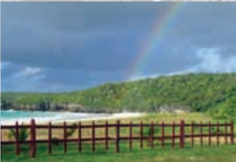
Playa Caracas, lado este del Refugio

blanco. Las praderas de hierbas marinas cerca de las costas sirven como refugio y área de alimento para el carey, el peje blanco y el manatí Antillano. Además de su valor ecológico, el refugio contiene recursos arqueológicos