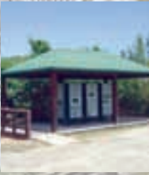
Kiosko en Laguna Kiani y tablado

fotografiar, interpretación y educación ambiental. También, proveemos acceso para usar las playas, pescar y pasear en kayak. Las playas abiertas al público son consideradas por muchos las más hermosas del mundo y son las atracciones principales al área. Además de las playas, hay lagunas marinas, salitrales y bosques de mangles. Las extensiones de bosques subtropicales secos y húmedos son otros ecosistemas que se pueden apreciar.