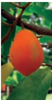
Fruta de Goetzea elegans