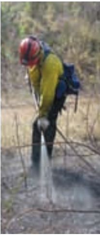
Programa de fuego