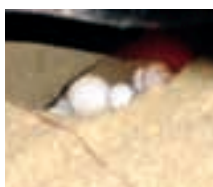
Nido de tinglar