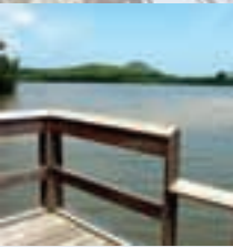
Area de pescar en Laguna Kiani

La oficina de USFWS está abierta de lunes a viernes de 8:00 a.m. a 3:00 p.m., excepto los días feriados federales.