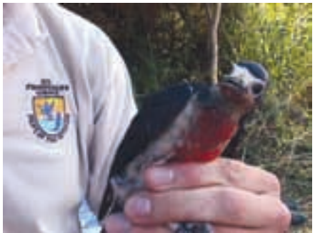
Proyecto de anillar aves

Dirección Postal: PO Box 741, Vieques, PR 00765