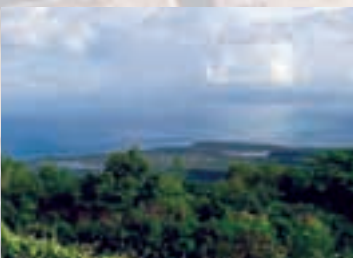
Refugio de Vida Silvestre, lado oeste