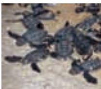
Tortuga Marina, Peje blanco