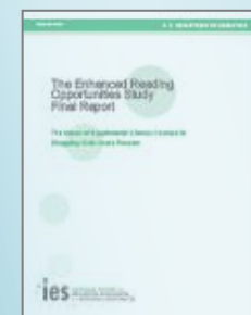
The Enhanced Reading Opportunities Study Final Report

http://www.gmfus.org/galleries/ct_publication_attachments/TTImmigration_2010_final.pdf