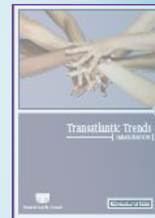
Transatlantic trends: Immigration 2010

http://www.brookings.edu/testimony/2011/0331_counternarcotics_felbabbrown.aspx