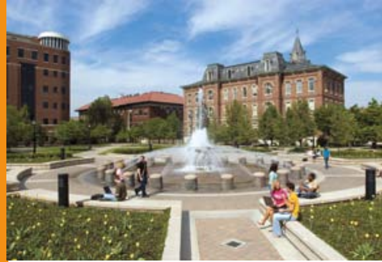
Purdue Üniversitesi'ndeki Loeb Çeşmesi ve arka planda University Hall