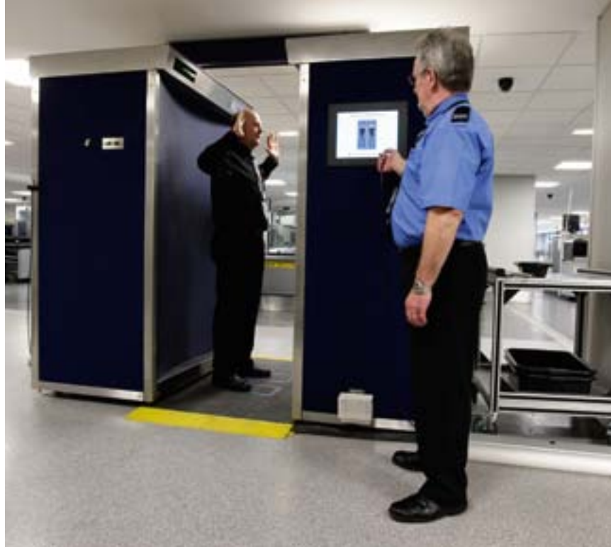
Birleşik Krallıklar'daki bu havalimanında olduğu gibi, bir yolcu beden tarayıcısından geçiyor.