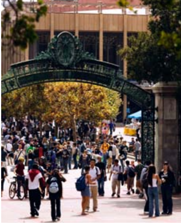
California Üniversitesi, Berkeley'den kampus görüntüsü