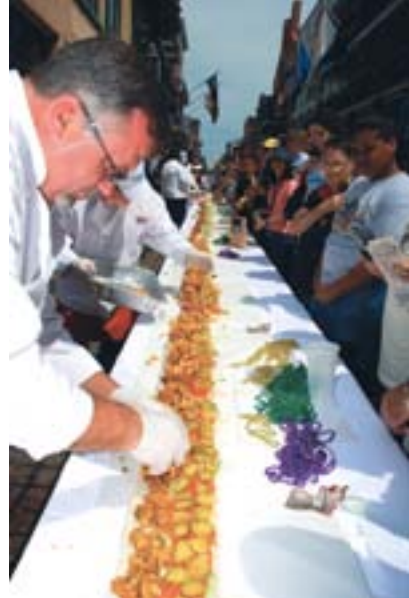
New Orleans’da yapılacak bir sokak festivalinden önce, dünyanın en uzun ıstırdiyeli po’ boy sandviçi hazırlanırken