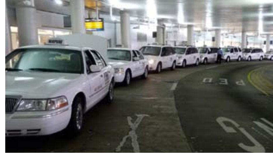
Baltimore/Washington Uluslararası Havalimanı'nda gelen yolcuları taşımayı bekleyen taksiler.

noktası Baltimore'a kadar toplam 26 saatlik bir uçuş. Seyahat acentasındaki görevli aktarmaları nasıl yapacağımı, her transit ve varış havalimanında hangi tabelalara bakmam gerektiği konusunda beni bilgilendirerek çok yardımcı oldu. Havalimanlarındaki güvenlik taramaları elçiliktekenden daha sıkı. Bu nedenle geçerli tüm evrakların kolayca ulaşılabilir bir yerde bulundurulması gerekiyor.