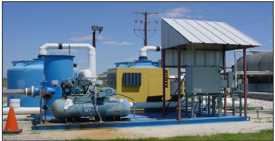
Un sistema de extracción de vapor en la tierra usado en la antigua base aérea Kelly.