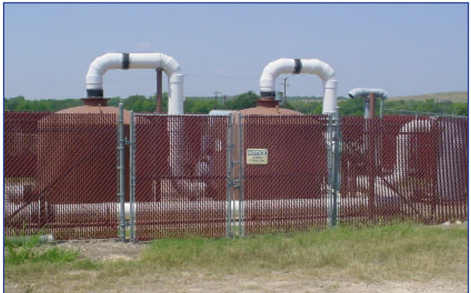
A bioventing system in use on the former Kelly AFB.