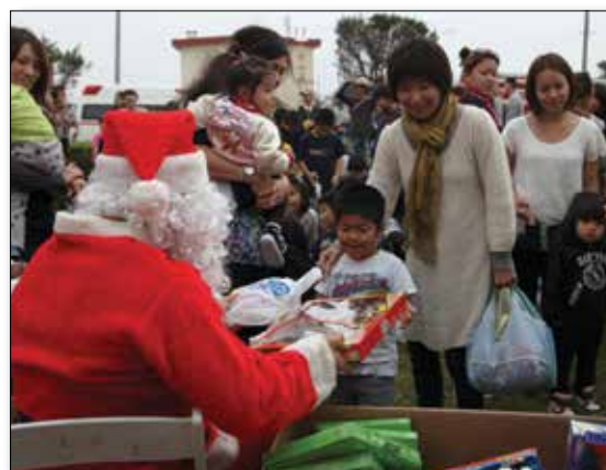
Children from Henoko district ages 2-12, along with their families, gather around Santa Claus to receive presents at the 31st annual Christmas children's day Dec. 8. 12月8日、第31回クリスマス・チルドレンズデーでサンタクロースからプレゼントを受け取る辺野古区の2歳から12歳の子供たちとその家族。

海兵隊員、海軍兵、民間人を代表して、新しい年が慶びと幸せに満ちた一年でありますようお祈り申し上げます。