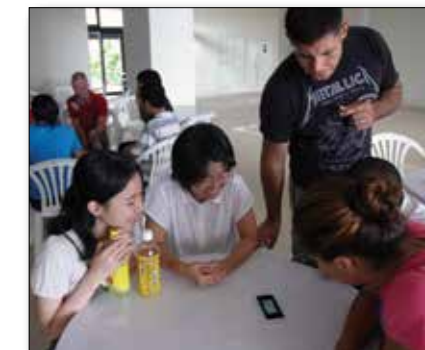
Marines help students of various information technology schools with their English communication skills at Okinawa IT Shinryo Park in Uruma City July 21 to prepare them for their trip to San Francisco. 7月21日、サンフランシスコに研修旅行に行く予定の専門学校生のために、英会話の練習相手になる海兵隊員たち。