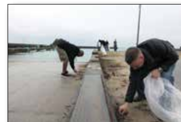
Marines of the III Marine Expeditionary Force work to clean up Henoko Beach Jan. 7. More than 30 volunteers showed up to clean the beach as part of an annual community relations event. 1月7日、辺野古の海岸清掃を行う第三海兵遠征軍の海兵隊員。この毎年恒例の地域貢献プロジェクトに30人以上のボランティアが参加した。