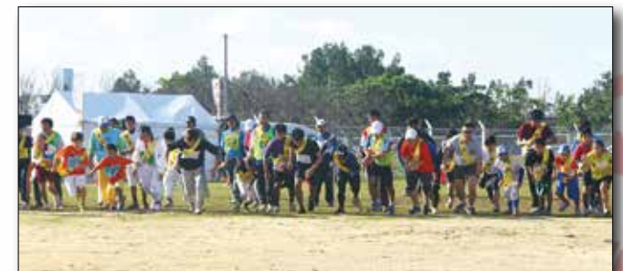
Runners take off during the first leg of the 35th Annual Ginowan City Traffic Safety Campaign Relay Run Jan. 28. Marines based on Marine Corps Air Station Futenma finished 4th overall. 6月28日、第35回宜野湾市交通安全キャンペーン市内一周駅伝でスタートを切る第一走者。普天間基地の海兵隊員らは全体で4位になった。