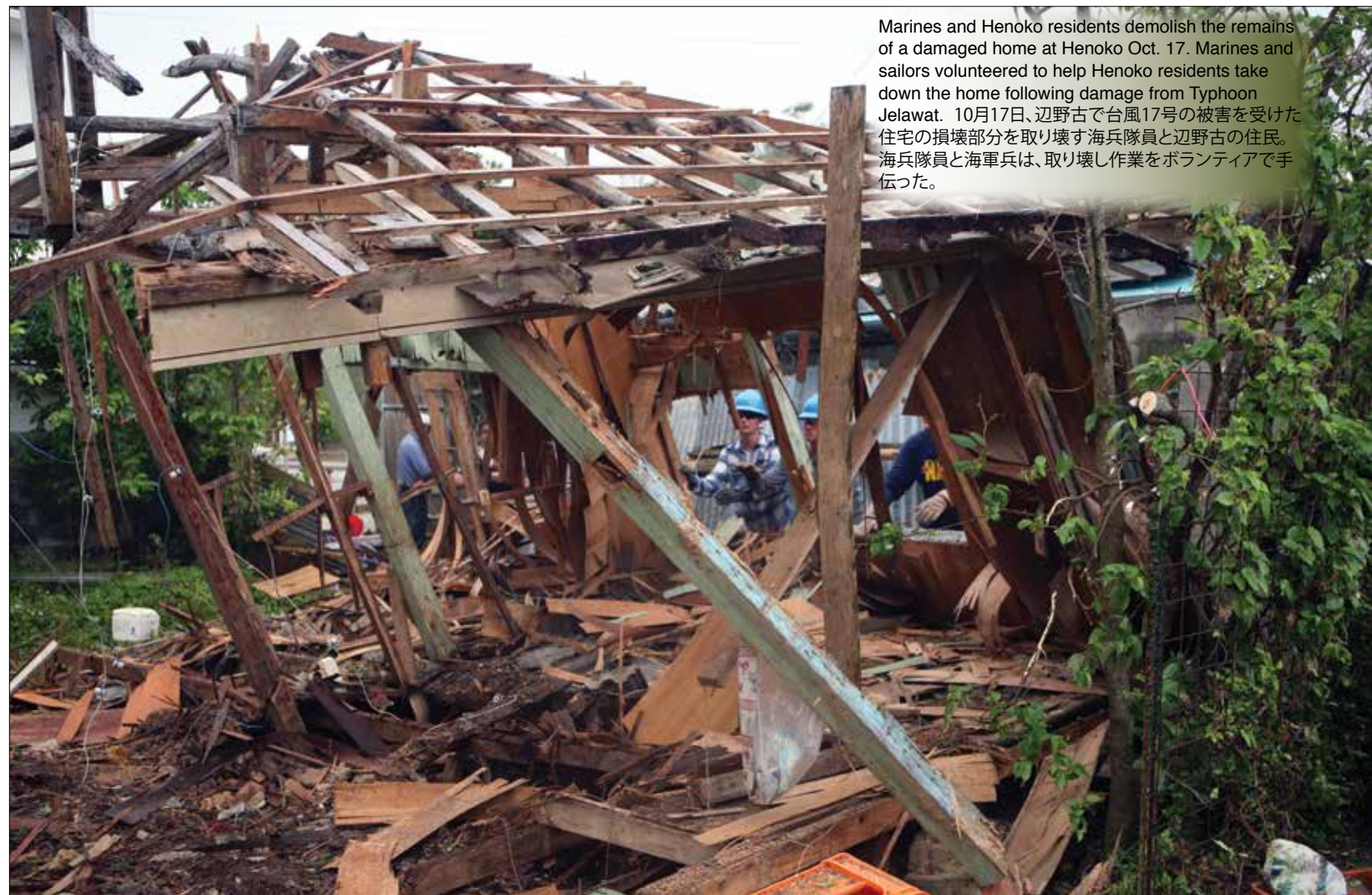
Marines and Henoko residents demolish the remains of a damaged home at Henoko Oct. 17. Marines and sailors volunteered to help Henoko residents take down the home following damage from Typhoon Jelawat. 10月17日、辺野古で台風17号の被害を受けた住宅の損壊部分を取り壊す海兵隊員と辺野古の住民。海兵隊員と海軍兵は、取り壊し作業をボランティアで手伝った。