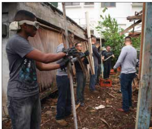
Marines and sailors form a line and take out debris from a partially collapsed home damaged by the Typhoon Jelwat at Henoko Oct. 17. 10月17日、辺野古で台風17号の被害を受けた住宅の損壊部分の一部を片付ける海兵隊員と海軍兵。

"We are appreciative," said Tokuda. "We thank the service members for their hard work."