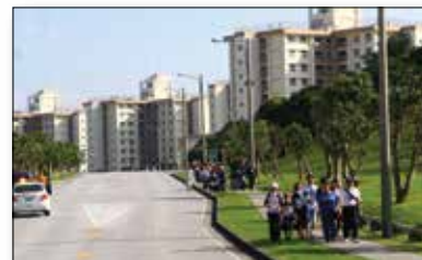
Urasoe City residents walk through Camp Kinser during the Tedako walk Feb. 5. The camp has opened its gate for the event since 2002. 2月2日、キャンプキンザーの中を歩くてだこウォークの参加者。2002年以降、この日は基地を開放している。