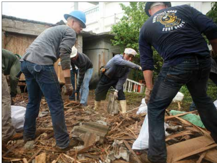
Neighbors in Henoko and service members work together cleaning the land where a home once stood at Henoko Oct. 17. 10月17日、解体した家の跡地で協力して木材などを片付ける近隣住民と米軍人。