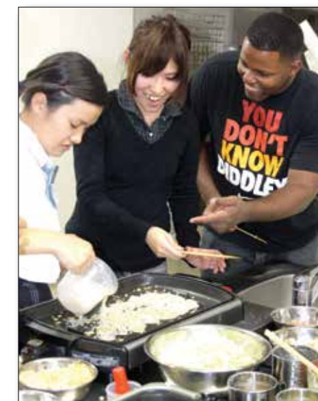
Students in the Camp Courtney English language class cooked Japanese food at the Urumin Welfare Center Dec. 10 in appreciation to the Marines for teaching them English. 12月10、健康福祉センターうるみんで、英語クラスの生徒が日本食を用意し、英会話を教えてくれた海兵隊員にふるまった。