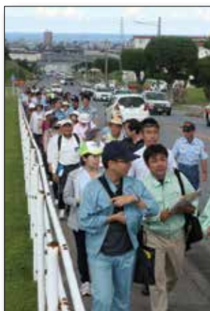
Residents of Ginowan City and Chatan Town walk up the hill on Camp Foster during a humanitarian evacuation drill Sept 12. 9月12日に行われた避難訓練で、キャンプフォスターの坂を上る宜野湾市と北谷町の住民。

I look forward to 2013 and all the promises it holds. My family and I have spent many years on Okinawa, and we all consider it a special place. On behalf of them, my Marines, sailors and civilians, I wish everyone a happy and prosperous New Year!