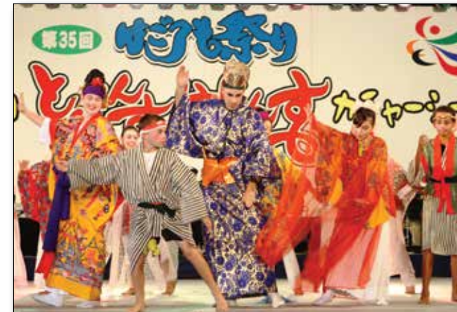
Members of MCAS Futenma perform their routine during the Kachashi Contest at the 35th Annual Hagaromo Festival at Ginowan Kaihin Park Aug. 12. 8月12日に宜野湾海浜公園で行われた第35回はごろも祭り、カチャーシーを披露する普天間基地のメンバー。