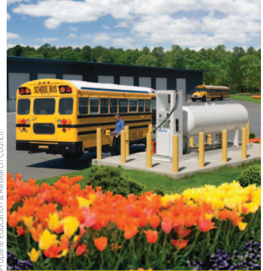
Propane Education &amp; Research Council

Los vehículos a propano funcionan de la misma manera que los vehículos a gasolina con motores de encendido a bujía. Existen dos tipos de sistemas de inyección de combustible: Inyección a vapor y líquida. En ambos tipos, el propano se almacena en forma líquida en un tanque, a presión relativamente baja (alrededor de 300 psi). En un sistema con inyección a vapor, el propano líquido es controlado por un regulador o vaporizador, que lo convierte de líquido a vapor. El vapor se alimenta a un mezclador ubicado cerca del múltiple de alimentación, donde se lo mide y combina con aire filtrado antes de ser aspirado en la cámara de combustión y encendido para producir energía, de la misma manera que un motor