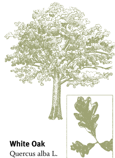
White Oak Quercus alba L.