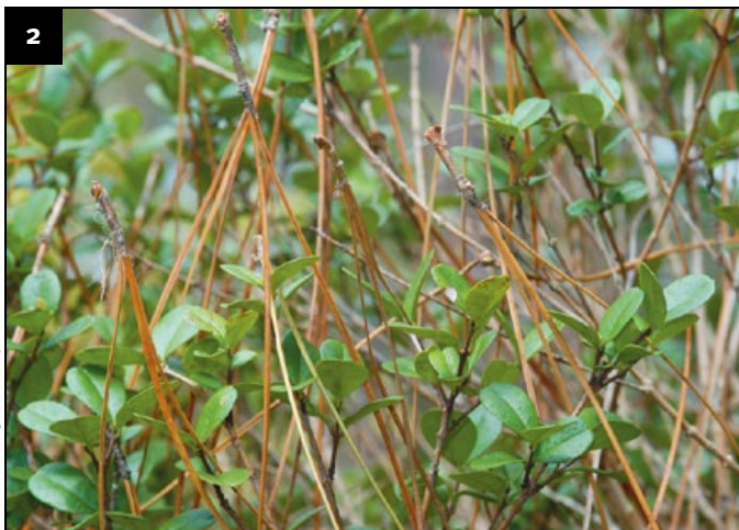
FIGURA 2. Como se aprecia en esta fotografía, las acículas muertas que caen de los pinos altos pueden acumularse o caer en las ramas de árboles más pequeños y arbustos. Las acículas secas, muertas, aumentan dramáticamente la combustibilidad de los arbustos y la vegetación alrededor.