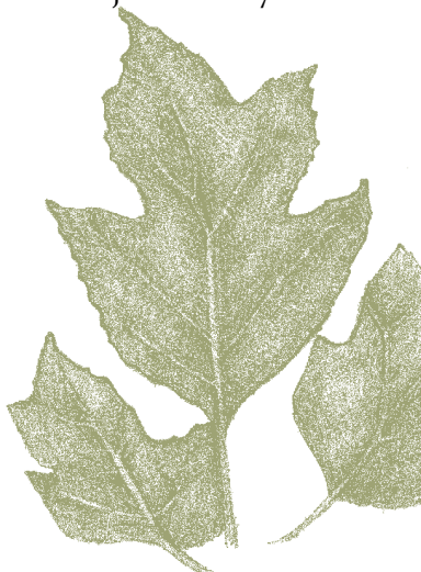
Oak Leaf Hydrangea Hydrangea quercifolia

Patrón de distribución de las ramas abiertas y poco densas