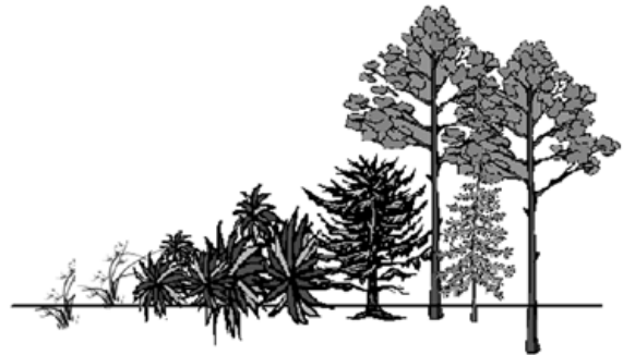
FIGURA 6. Los “escalera de combustibles” son arbustos o árboles de tamaño mediano que conectan el material combustible desde el suelo del bosque hasta la parte alta de los árboles.

FIGURA 5. El saw palmetto tiende a crecer en grupos densos o copiosos, como se muestra aquí, lo cual aumenta su combustibilidad general.