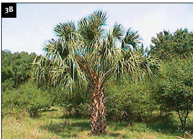
FIGURA 3. Las frondas muertas o a punto de morir en esta palma (cabbage palm) (A) aumentan su combustibilidad general y crean un riesgo al fuego cuando la palma está localizada cerca de la casa. Mediante la remoción de las frondas muertas (B) el riesgo puede ser reducido.