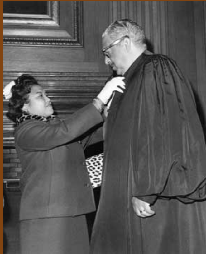
Thurgood Marshall y su esposa Cecilia.

Thoroughgood (nombre real de nacimiento) Marshall, nieto de un esclavo, nació en Baltimore, Maryland, el 2 de julio de 1908. En segundo grado, el joven Marshall acortó su nombre al de Thurgood. Se recibió en el segregado Colegio Secundario para Gente de Color y en la Lincoln University, “la primera institución que se haya fundado en alguna parte del mundo que proporcionó educación en artes y ciencias a niños descendientes de africanos.” Marshall se transformaría luego en el primer afronorteamericano ministro de la Corte Suprema de Estados Unidos.