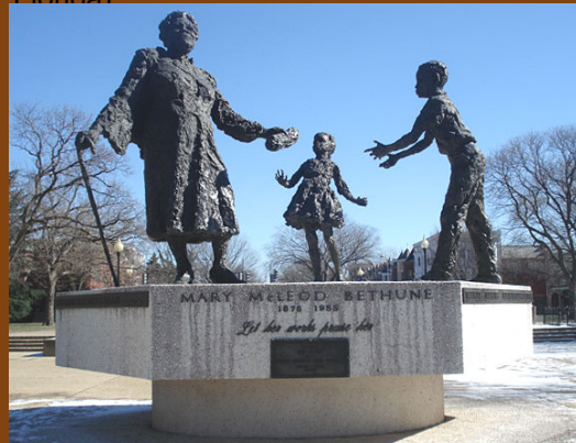
Estatua de Bethune en Washington, D.C.