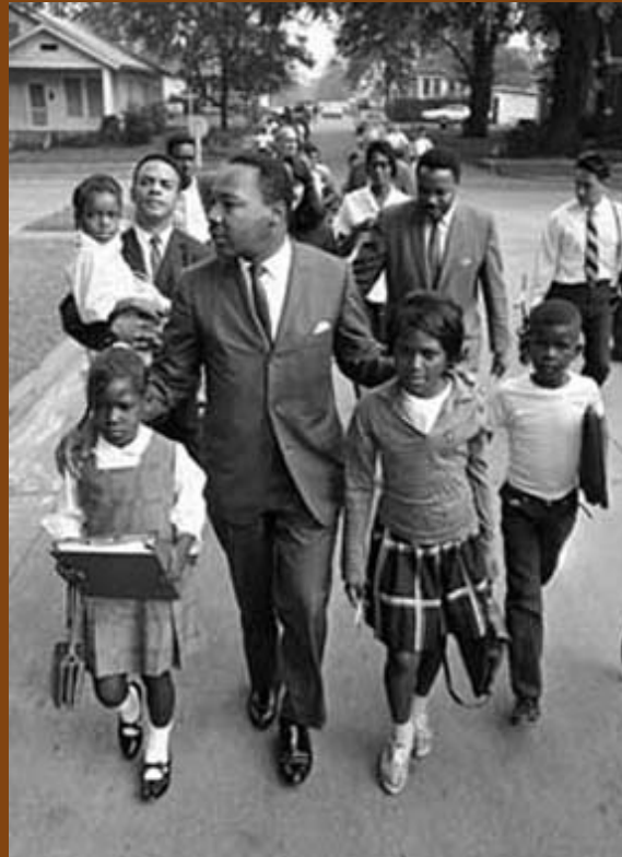
Dr. Martin Luther King, Jr.