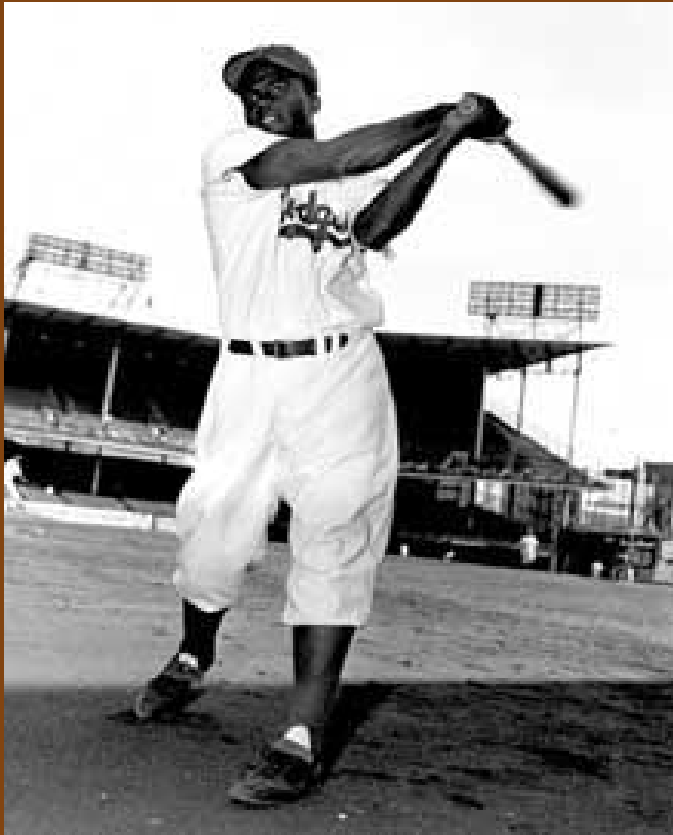
Jackie Robinson (1919 - 1972)

Nacido en Georgia de una familia de agricultores, Jack Roosevelt Robinson fue el primer afronorteamericano en jugar en las ligas mayores de baseball, como parte del deporte profesional de Estados Unidos. Su logro fue reconocido al retirarse el número 42, el de su camiseta, de los equipos de baseball de la Liga Mayor. El número no volverá a ser asignado a otro jugador. En 1962, pasó a formar parte del Salón de la Fama del Baseball.