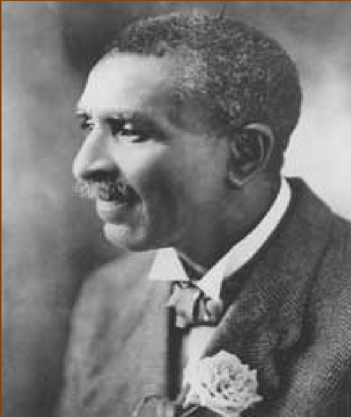
George Washington Carver (1864 - 1943)

Nació en la esclavitud en el condado de Newton, Ciudad de Marion, cerca de Diamond Grove, conocida actualmente como Diamond, Missouri. Carver fue un botánico afronorteamericano en el Tuskegee Institute de Alabama. Enseñó a ex esclavos las técnicas de agricultura para autoabastecerse. Asimismo, experimentó con maní y otras plantas y es reconocido ampliamente por inventar cientos de usos distintos para plantas.