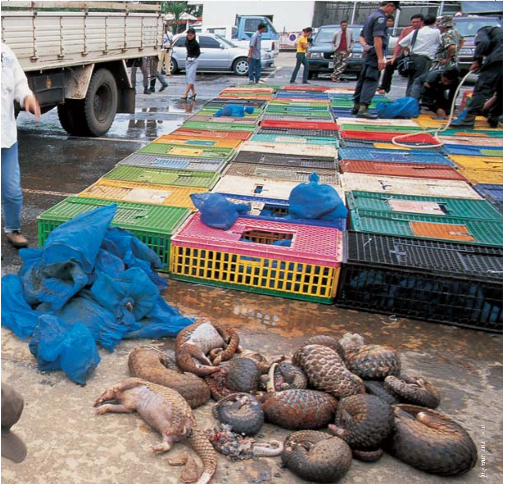
กรมทรัพยากรธรรมชาติและสิ่งแวดล้อม

chain of producers, exporters and consumers, creating huge annual turnover with little risk when compared to drug smuggling.