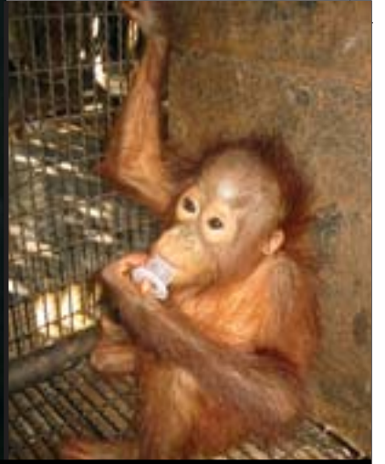
ค้าขายกันอย่างเป็นท่าเป็นสน