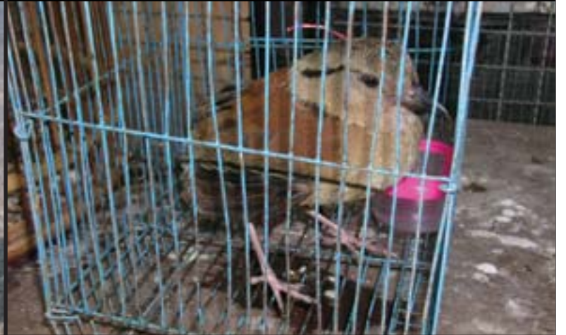
มูลค่าสูงเป็นอันดับสองของโลก และเป็นธุรกิจสกปรก