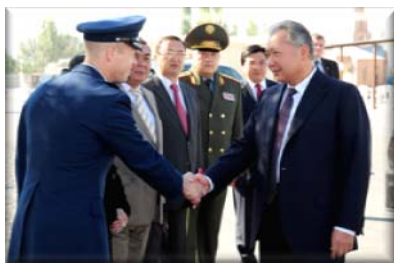
Учреждение Транзитного Центра в Манасе открывает новую страницу в кыргызско-американских отношениях

Круглосуточная деятельность, осуществляемая в Транзитном Центре, это вклад в спасение жизней в раздираемом войной Афганистане и стабилизацию ситуации в регионе и