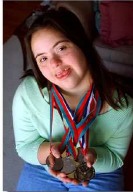
帮助每个人实现其最佳潜力对所有人有益；社会是最大受益者。

身体残疾会直接或间接影响一个人过正常生活。直接的影响一般显而易见，例如失去视力直接妨碍行动、正常阅读或看电视。但是，间接的影响有时并不明显，得到的关照也较少，而它带来的障碍可能同样严重。对有残疾的人来说，上学可能会有困难，因此，有些没有智力障碍的残疾人无法像其他人一样享受教育机会。基于残疾和扶助条件的不同，残疾造成的影响可能包括：行动不便、社会活动受局限、更难找到工作(或难以前往工作地点或从事需要某种体力的工作)、以及难以保障自己的健康、保健和营养需要，等等。残疾人作为一个整体，往往受教育水平较低、失业率较高、健康状况往往较差。然而，人们认识到，残疾本身并不是造成这些状况的直接原因。为改变这种状况，美国开始建立起各种项目和法律保护措施。