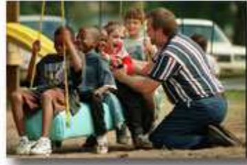
一位教师在帮助这名有行动障碍的孩子与同学们一起玩。