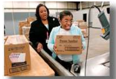
这位妇女在学习如何用机械分理盒子。沃尔格林(Walgreens)药店在南卡罗来纳州建立的训练中心从 2007 年初开始可以接受 200 名残疾人参加训练。

利用技术提供更多方便。 辅助性和通用设计技术(即无须加以改造或专门设计而可供所有人使用的产品和环境)为残疾人提供了比以往任何时候都更方便的受教育、参加工作和社区生活的机会。具体成就包括: