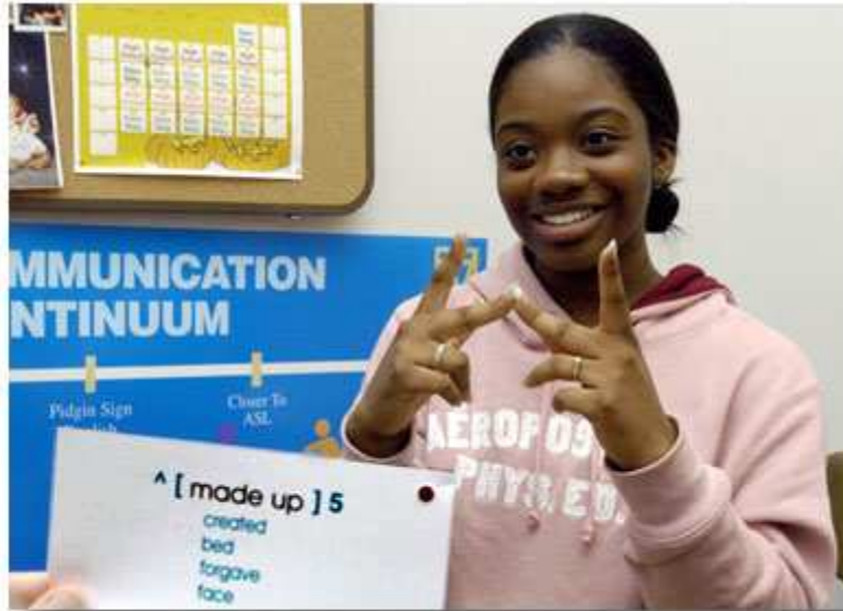
手语学生必须在多义词上特别下功夫。理解手语与英语书面语的不同有助于学生参加标准考试。

就业与残疾全国青年协作项目(National Collaborative on Workforce and Disability for Youth)得到美国劳工部残疾就业政策办公室(Office of Disability Employment Policy)管理下的一项专款的资助,专门帮助残疾青年解决与就业有关的需要。它汇集了多种信息资源和出版刊物,并提供有关的最新活动动态、可搜索的互联网资源链接、常见问题解答、向专家提问专栏、以及一个将各种有效解决残疾青年就业需要的项目和措施汇总的所谓"Pro-Bank"信息库。该网站网址为 http://www.ncwd-youth.info/ 。