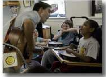
特殊需要儿童班的学生高兴地与他们的音乐理疗师交流。

扩大残疾青年的受教育机会。优质教育对于确保残疾人能够工作和充份参与社区活动至关重要。具体成就包括：