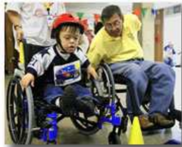
海岸警卫队退役队员、一级轮椅运动员在阿拉斯加安克雷奇举行的轮椅运动会上帮助一名 8 岁男孩操控轮椅。

在网页上点击"The Family Village"(家庭村), 读者便被带入"A Global Community of Disability-Related Resources"(全球残疾信息资源网)。在此处点击"Research"("研究"), 便可得医学、残疾事务、特殊教育、康复、残疾统计数据 and 社区服务帮助等按照栏目分类的信息。如果进一步点击"Medical"("医学"), 读者便进入了一系列更多的选项, 包括医学名词词典、寻找医学杂志和网络期刊的工具, 等等。