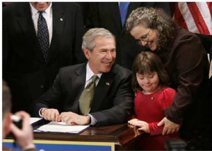
布什总统几年来支持了数项有关残疾人士的项目和法律。这张 2004 年的照片显示他在签署《残疾人士教育法案》前，与一对母女交谈。

《美国残疾人法》帮助实现了美国对数百万残疾人士的承诺。值此具有里程碑意义的法律通过 16 年周年的重要时刻，让我们庆祝过去 16 年来取得的进步，颂扬残疾人士为我国作出的大量贡献。