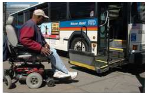
在灾害期间满足残疾人的需要包括：提供医疗、交通、通讯和其他特殊服务。