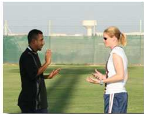
参加国务院赞助的世界杯巡回团的成员与世界各地的年轻运动员相会。图中女子足球世界杯冠军队的金牌队员帕洛(Cindy Parlow)和巴林残疾人运动联合会聋哑运动员通过交流发现足球是世界共通的语言。

国务院还赞助开展有关残疾问题的文化教育项目，有些交流项目面对残疾学生，其中有两个项目派遣美国教师或实习生到其他国家，为聋哑人的项目工作。其他有些项目虽不一定专门针对残疾人，但有可能关系到有特殊需要的人。参加世界杯赛的运动员最近访问了几个国家，会见了很多团体，其中包括来自巴林残疾人运动联合会(Disabled Sports Federation)的聋哑足球运动员。该项目在巴林引起了当地媒体的广泛兴趣，有望导致更多的后续活动。