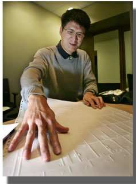
很多技术工作在过去不可能让残疾人做，但像这张可触摸的地图等新工具使残疾学生现在能够从事科学、电脑技术和工程等职业。

克莱恩认为人们的态度也很重要。他说，如果留在欧洲，他不可能从事白领工作，而是会被安排在工厂做工。