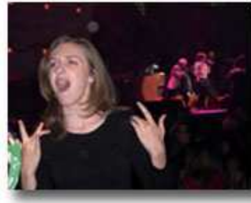
斯特凡尼(Gwen Stefani)在舞台现场作手语翻译。翻译通过使用美国手语和生动的手势及面部表情, 让听力有障碍的观众也能欣赏音乐会。