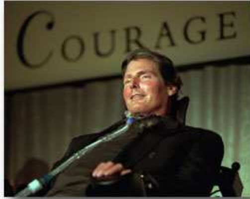
克里斯托弗·里夫

安杰拉说："在事故发生后不久，我在接受理疗期间了解到有关资源中心的消息，我可以成为他们所给予的大量帮助的见证人，即在你绝望无助时，会有人为你提供所需要的信息。有许多下肢和四肢瘫痪的人可以利用他们的帮助——特别是亚裔社区。我准备尽一切努力让他们寻求帮助。"