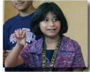
不仅是聋哑学校，很多学校也都使用手语。

2006年，教育部公布了新的实施《残疾人教育法》的指导方针，增加了针对有特殊需要的儿童的学习效果要求，并提供了教育和评估残疾学生的辅助手段，以帮助各校区、教育工作者和家长落实新的责任。新指导方针的主要内容包括：提供灵活的资源，帮助学校尽早和准确判断有特殊需要的学生并满足他们的需要；教授有特殊需要的学生的教师必须不仅在特教领域、而且在所教学科领域都具有优秀资格；简化学校的文书工作；让家长更大程度地参与孩子教育。