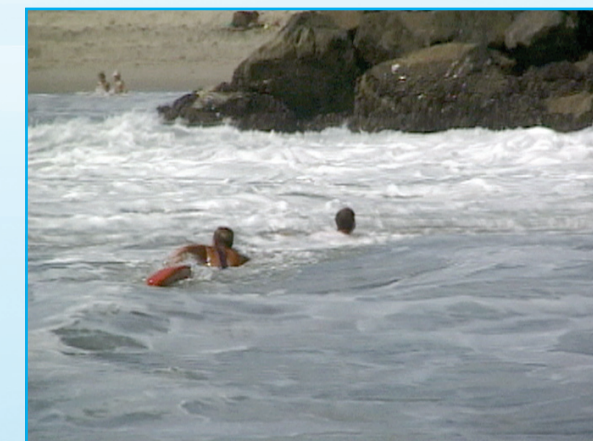
Un salvavidas rescata a un nadador atrapado en la resaca.