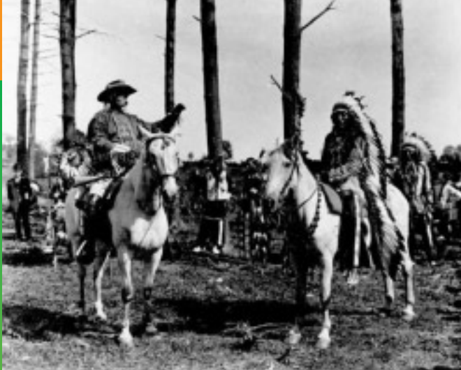
Köne Günbatarda in meşhur adamlaryň biri polkownik Wilýam F. Kodi we indeýler. Suratny alynan wagty belli däl.