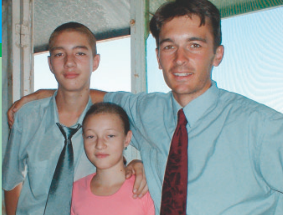
Neýt ýerli oglan we gyz jigileri bilen. «Bu Türkmenistanda iň şadyýan maşgaladyr»

Jogap: Hawa, haçanda men syýahatçylyk üçin ýazylan ktiapçany okanymda şeýle zatlara duş gelýärim. Ýagny onda; «Türkmenabada geljek bolup azara galyp ýörmän, ol ýerde görer ýaly zat ýok» – diýip aýdylýar. Muňa meniň erbet gaharym gelýär. Sebäbi Türkmenabatda, umaman, Türkmenistanda gelip görmäge juda köp zatlar bar. Türkmenistan üçin erbet söz eşitsem ýürekden gynanýaryn.