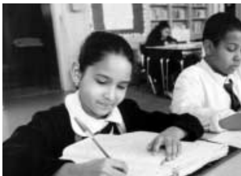
Nýu-Yorkyň mugt okalýan döwlet mekdepleriniň birinde çagalar sapak wagty.

XX-nji asyryň 90-nji ýyllarynda bilim ministrligi şu aşakdaky meselere: ähli okuwçylar üçin bilim standartlaryny ýokary galdyrmaga; okatmagyň hilini ýo-