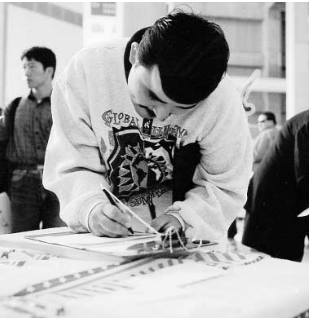
Los Anjelesde saýlawçylaryň hasaba alnyşy. Kaliforniýa ştaty