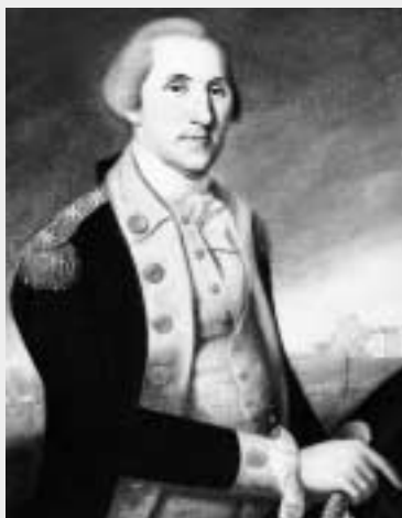
Jorj Waşington Kontinental Goşunyň baş serkerdesi wezipesinde.

Haçanda Filadelfiyada wekillerin ýeterlikli sany ýygналanda, Konstitusion ýygnak biragyzdan Jorj Waşingtony prezident saýlady. Bu wezipe üçin özünde zerur häsiýetlerin ýokdugyny aýtsada, ol wezipäni ikerijiňlenmän kabul etdi. Öz çykyşynda ýygnaga gatnaşyjylaryň buýsanjyna we geljege bolan ynামyna dayanyp: «Geliň baýdagy götereliň, goý onuň astyna hemme akylly we dogruçyl adamlar ýygნansyn» diýdi.