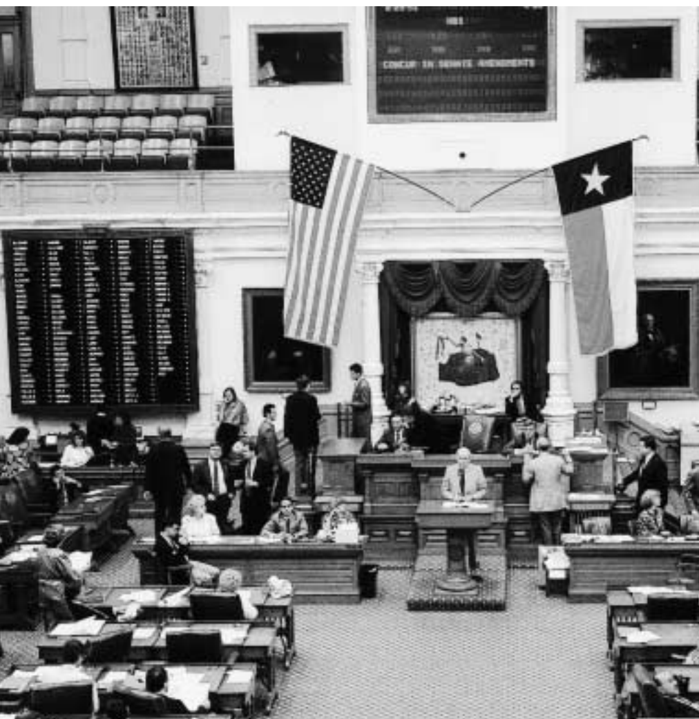
Tehasyň Wekiller palatasynyň kanun çykaryjy guramasynyň Ostindäki Kapitoliýanyň jaýynda geçirýän ýygnaýy.