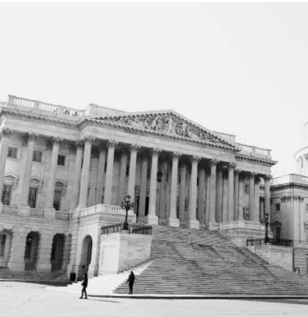
Kapitoliy (ABŞ-yň Kongresiniň binýady)