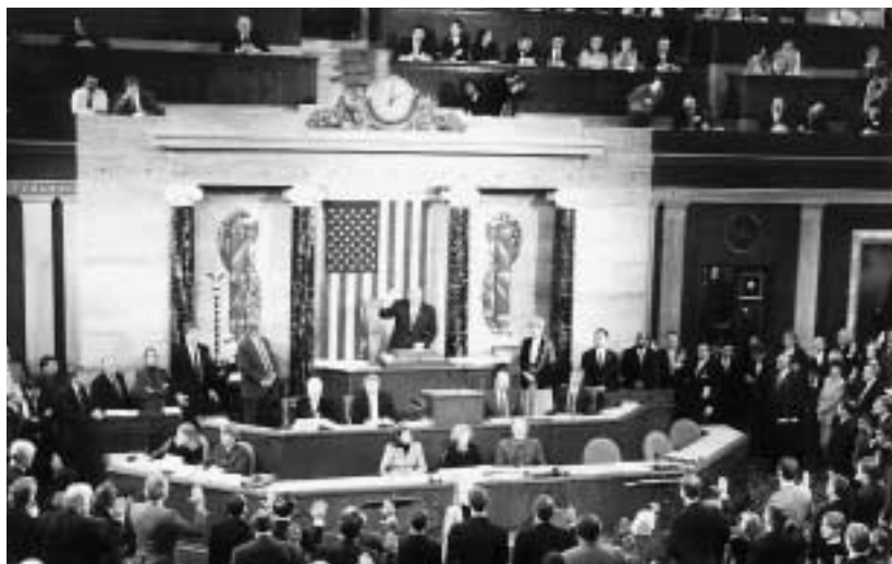
Kongresiň 106-njy çagyrylyşynyň agzalary ABŞ-ýň Wekiller Palatasynyň jaýynda kongresmenleriň kasamyny kabul edýärler. Ýanwar 1999 ý.

ly Waýoming ştatynyň 32 270 000 ýaşajyly Kaliforniýa ştaty bilen deň derejede wekilçiligi bardyr.