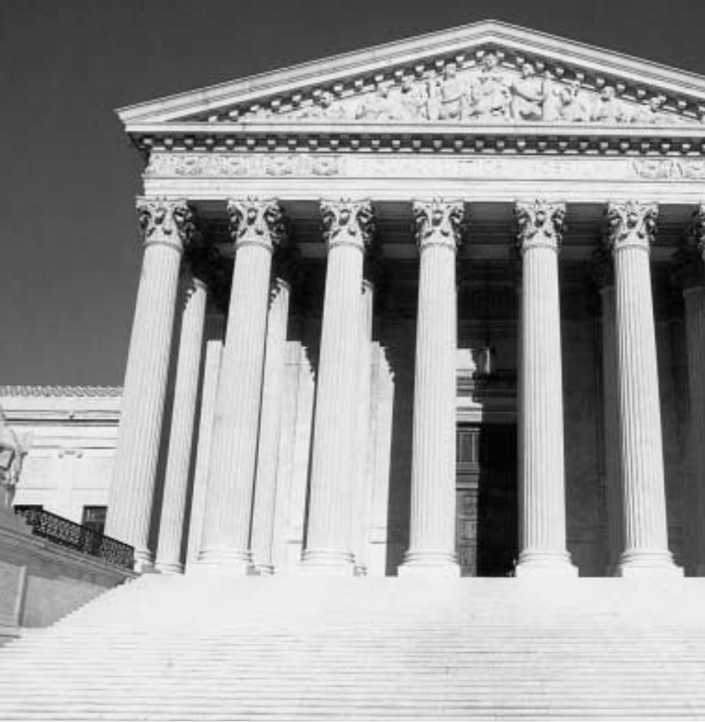
ABŞ-yň Ýokary Sudy