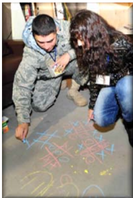
Транзиттик Ташуулар Борборундагы үй-бүлө жана достор күнү