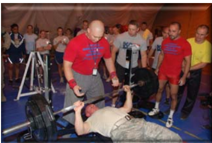
Кыргызстандын күчтүү жигиттери Транзиттик Ташуулар Борборунун жигиттери менен күч сынашууда