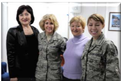
Кыргызстандагы Аялдар Конгрессинин достугу бекемделип жатат