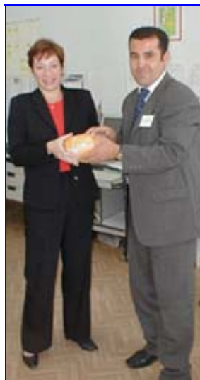
Представитель сыровяленного завода угощает посла продукцией собственного производства

5 октября посол приняла участие в церемонии открытия Ресурсного центра английского языка в этрапском центре Гёроглы (бывший Тагта). Центр, созданный по инициативе волонтеров Корпуса Мира пять лет назад, недавно получил помощь от посольства США и Великобритании, которые профинансировали закупку мебели и оборудования для модернизации этой специальной языковой библиотеки. «В Дашогузском велаяте очень много древних,