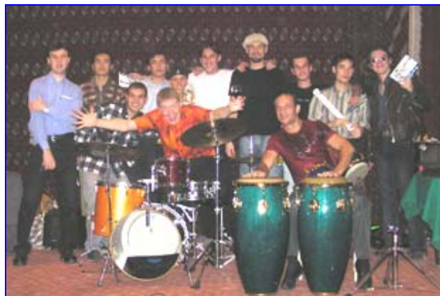
Джазмены «АК4» и местные музыканты на фестивале туркменской и американской музыки.

и студентами Национальной консерватории. Исполнение музыкантами обеих стран своих народных мелодий помогло лучше узнать богатые музыкальные традиции американского и туркменского народов.