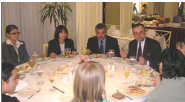
Г-н Фокс во время обеда с членами Правления директоров Национальной ассоциации выпускников обменных программ.

В своем турне по региону г-н Джон Фокс посетил также Узбекистан, Казахстан, Таджикистан и Кыргызстан. В Туркменистан, это был его первый визит.