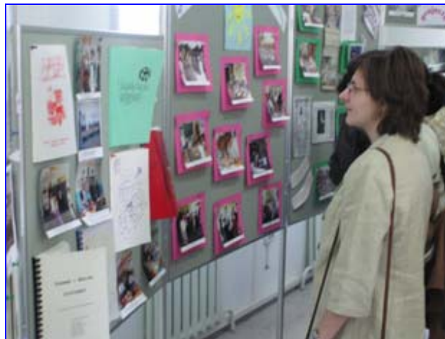
Посетительница передвижной выставки знакомится с достижениями волонтеров Корпуса Мира в Туркменистане.

деятельности, методические пособия для учителей английского языка, медицинские брошюры и многие другие свидетельства гуманитарной деятельности волонтеров в Туркменистане. 86 волонтеров повсей стране приняли участие в концертах, постановках небольших пьес, организовали дискуссии и спортивные мероприятия. Программа праздника, прошедшего по всему Туркменистану, содействовала лучшему пониманию задач и работы миссии Корпуса Мира. Во время проводимых мероприятий их участникам раздавались специальные приуроченные ко Дню Корпуса Мира календари, закладки для книг и различные рекламные материалы, содержащие подборки интересных фактов.