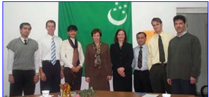
Фото на память: Посол с представителями ЮСАИД и EDP.

4 ноября 2003 года Проект по развитию предпринимательства (EDP) в Туркменистане впервые принимал у себя посла США. Посла Джейкобсон сопровождали Брэдфорд Кэмп, директор ЮСАИД в Туркменистане, и Патти МакКэйб, менеджер программ ЮСАИД (Предпринимательство и финансирование) в Ашхабаде. В своем выступлении посол отметила, что правительство США радо поддерживать EDP и предпринимательские инициативы в Туркменистане вообще. Ее интересовали как деятельность EDP, осуществляемая в стране в настоящее время, так и возможности расширения масштабов проекта, ориентированного на оказание поддержки частному сектору в будущем.