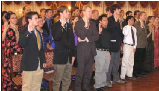
12-я группа волонтеров Корпуса Мира на церемонии приведения к присяге.

13 ноября 2003 года, в связи со знаменательной датой, десятилетним юбилеем работы Корпуса Мира США в Туркменистане, с приветственным посланием к волонтерам обратился Президент Туркменистана Сапармурат Ниязов. «Туркменистан высоко оценивает деятельность Корпуса Мира и поддерживает его благородные устремления, направленные на осуществление гуманитарных проектов, а также расширение и углубление дружественных контактов между