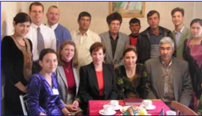
Сотрудники Посольства и представители ТОО «Илкинджилер».