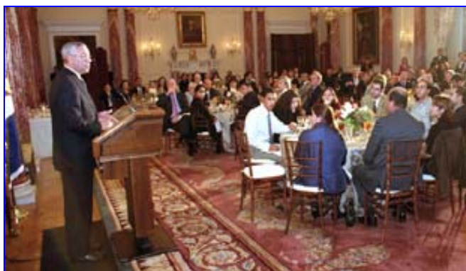
Госсекретарь Коллин Пауэлл обращается к гостям во время ежегодного ужина Ифтаар.

Жительнице Туркменбаши Минаре посчастливилось «дать урок» Госсекретарю Пауэллу о культуре, религии, традициях и культурных ценностях туркменского народа. Позже, вспоминая вечер Ифтаар, Минара сказала: «Из всех моих впечатлений о поездке в Соединенные Штаты, это остается пока самым ярким».