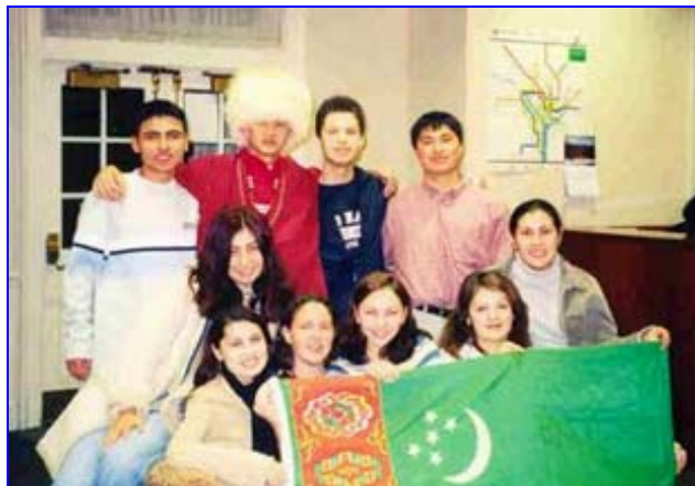
Туркменские участники программы FSAU-03 показывают свое единство на семинаре.