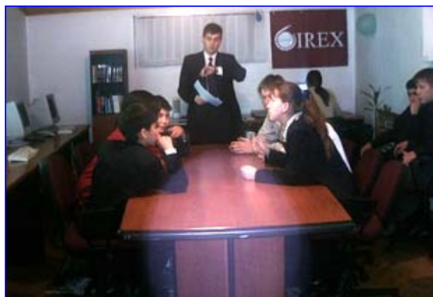
Ашхабадская команда молодых интеллектуалов обсуждает возможные ответы на заданный вопрос.