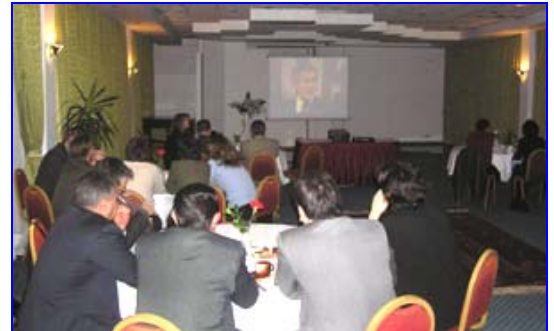
На просмотре Послания Президента США «О положении страны».

В своем ежегодном послании Президент Буш остановился на анти-террористической кампании Америки и на задачах США и международной коалиции в Афганистане и Ираке. Президент США еще раз подчеркнул, что Америка и международная коалиция настаивают на том, чтобы Иран и Северная Корея прекратили разрабатывать программы, связанные с