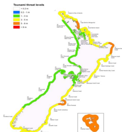
Ejercicio Tangaroa 2010 Mapa de Nivel de amenaza de tsunami: Los colores corresponden a la máxima elevación de agua esperada (es decir, cero a pico) en la zona costera

Durante el transcurso del ejercicio MCDEM continuó monitoreando y evaluando la situación, y emitió información adicional (incluyendo actualizaciones a la hora) según correspondiera. Se declaró teóricamente estado de emergencia nacional y se elaboró un plan de acción para apoyar la coordinación de la respuesta general. El ejercicio permitió probar los mapas de nivel de amenaza de tsunami recientemente elaborados que ilustran los impactos esperados. Se ejercitó la toma de decisiones y las notificaciones hasta la última etapa antes de poner en conocimiento a la población de Nueva Zelanda.