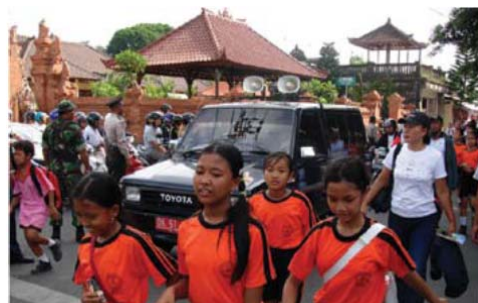
Niños de la escuela de Bali siguen una ruta de evacuación de tsunami como parte del simulacro de tsunami de Indonesia, Diciembre 2006

Se observó la participación en el simulacro de unos 1.000 a 2.000 estudiantes y profesores. El simulacro se realizó basándose en la recomendación de la Mesa Redonda sobre Tsunami en Indonesia de la COI en mayo de 2006. Desde entonces, se han efectuado anualmente en diciembre 26, simulacros similares en provincias de toda Indonesia.