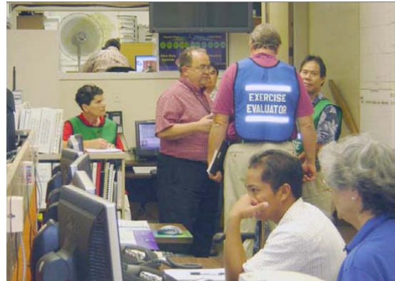
Ejercicio de Tsunami estilo Funcional realizado en el Centro de Operaciones de Emergencia – Defensa Civil del Estado de Hawai circa 2003

El Estado de Hawai, EE.UU., realiza anualmente dos ejercicios funcionales de tsunami tipo puesto de mando, usando escenarios locales y lejanos. El Centro de Alerta de Tsunami del Pacífico adapta los escenarios de tsunami para la Defensa Civil del Estado de Hawai, el organismo del estado que encabeza la coordinación en caso de desastre. Múltiples organismos gubernamentales federales, estatales, provinciales; organizaciones del sector privado y ONG prueban las comunicaciones de emergencia 24/7 y simulan los Procedimientos de Operación Estándar.