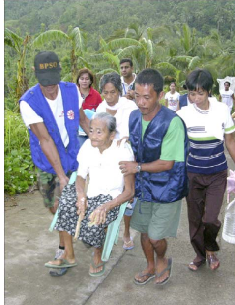
Foto: Una mujer mayor es transportada durante un Simulacro de Evacuación de Tsunami en una villa costera de Filipinas, Mayo 2006

El Instituto de Vulcanología y Sismología de Filipinas (PHIVOLCS) realizó numerosas actividades de planificación de simulacro con funcionarios provinciales, que incluyeron desarrollo de planes de comunicación ante tsunami locales, toma de decisiones sobre las rutas de evacuación y la elaboración de mapas comunitarios. Observadores del Ejercicio apoyados por UNDP y COI participaron en el ejercicio.