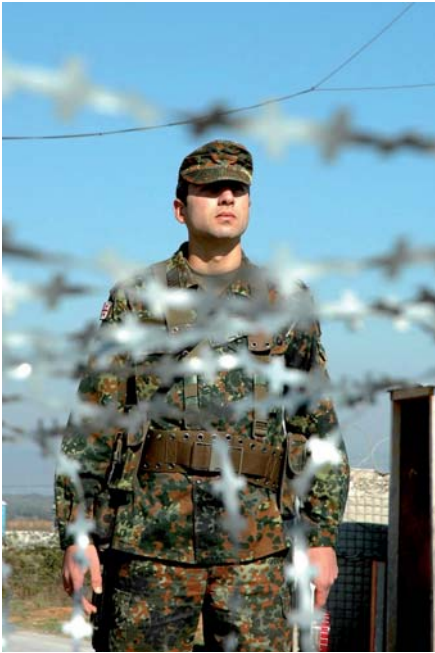
© არჩუნდ აკოფი, ძალები კოსოვოსათვის (KFOR) ქრონიკა

ქართველი ჯარისკაცი „ძალები კოსოვოსათვის“ შემადგენლობის ფარგლებში დგას საგუშაგოზე კოსოვოში, პრიზრენის ბანბაკის აეროდრომზე