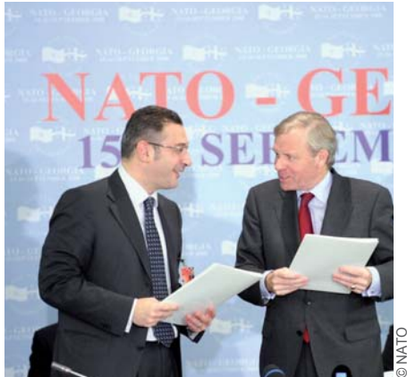
ნატო-საქართველოს კომისიის პირველი სხდომა გაიმართა თბილისში 2008 წლის 15 სექტემბერს საქართველოში ჩრდილოატლანტიკური საბჭოს პირველი ვიზიტის დროს, ნატო-ს უმაღლესი ხელმძღვანელი ორგანოს მიერ.

სამწუხაროდ, 2008 წლის აგვისტოში საქართველოსა და რუსეთს შორის დაპირისპირებამ კულმინაციას მიაღწია, რისი ძირითადი მიზეზები გახლდათ ჯერ სამხრეთ ოსეთში, ხოლო მოგვიანებით აფხაზეთის ტერიტორიაზე გან-