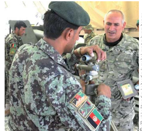
ქართველი ჯარისკაცი თვალყურს ადევნებს ავღანეთის ეროვნული არმიის ჯარისკაცს ყანდაგარში, ავღანეთი, კემპ-ჰეროეში ბაზაზე შეკრების დროს 2001 წლის ივლისი

თავდაცვისა და უსაფრთხოების სექტორში რეფორმების განხორციელების გზაზე კიდევ ერთ პრიორიტეტად განიხილება ნატო-ს მიერ „პარტნიორობა მშვიდობისათვის“ პროგრამის ფარგლებში დემილიტარიზაციის პროექტების მხარდაჭერა, ამისათვის ამოქმედებულ იქნა მიზნობრივი ფონდის მექანიზმი, რომელიც ნებას რთავს ცალკეულ მოკავშირეებსა და პარტნიორ ქვეყნებს, რათა მათ ფინანსური დახმარება შესთავაზონ ნებაყოფლობით საფუძველზე. მიზნობრივი ფონდის ორმა პროექტმა დიდი როლი ითამაშა ის-