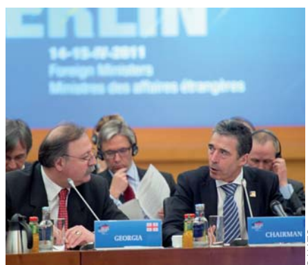
საქართველოს საგარეო საქმეთა მინისტრი გრიგოლ ვაშაძე ესაუბრება ნატო-ს გენერალურ მდივანს ანდერს ფოგ რასმუსენს ნატო-საქართველოს კომისიის სხდომაზე ბერლინში, 2011 წლის 15 აპრილს. მოკავშირეები მიესალმებიან საქართველოს მაღალ მაჩვენებლებს სამხედრო რეფორმის სფეროში და მის ღირებულ წვლილს ნატო-ს ხელმძღვანელობით მოქმედ ოპერაციებში ავღანეთის ტერიტორიაზე.

როგორც დემოკრატიულ ფასეულობებზე დაფუძნებული ალიანსი, ნატო