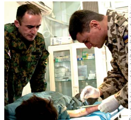
ქართველი სამხედრო ექიმი (მარცხნივ) მუშაობს უკრაინელ კოლეგასთან ერთად ახალგაზრდა ავღანელი ბიჭის მკურნალობის მიზნით, რომელმაც მიიღო დამწვრობა და გადის მკურნალობას სამედიცინო დაწესებულებაში ჩაგჩარანის პროვინციაში, ავღანეთის მრავალეროვნული ალდეგენითი ძალების ფარგლებში