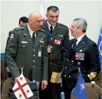
(პირდაპირ და მარცხნიდან მარჯვნივსაკენ) საქართველოს თავდაცვის გაერთიანებული შტაბის უფროსი, გენერალ-მაიორი დევი ჭანკოტაძე, ესაუბრება ნატო-ს სამხედრო კომიტეტის წარმომადგენელს, აღმირალ ჯანაპაოლო დი პაიოლას, ნატო-საქართველოს კომისიის სხდომაზე 2011 წლის 4 მაისს.

(ANP) ფარგლებში. პროგრამა ეფუძნება საქართველოს მთავრობის პრიორიტეტებს და გეგმები ასევე ეფუძნება მოკავშირეთა მხრიდან შემუშავებულ რეკომენდაციებს. მოიცავს ხუთ ძირითად სფეროს: პოლიტიკური და ეკონომიკური საკითხები, თავდაცვითი და სამხედრო საკითხები, რესურსების საკითხები, უსაფრთხოების საკითხები და სამართლებრივი საკითხები. პირველი ეროვნული პროგრამა საქართველოს მიერ წარმოდგენილ იქნა 2009 წლის გაზაფხულზე და მან შეცვალა ინდივიდუალური პარტნიორობის სამოქმედო გეგმა, რომლის ფარგლებშიც ნატო-სა და საქართველოს შორის ურთიერთობა ვითარდებოდა 2004 წლიდან.