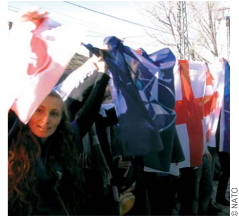
ნატო-ს კვირეულის ფოტო? საქართველოს მოქალაქეები ღიად უჭერენ მხარს ქვეყნის მისწრაფებას გახდეს ალიანსის წევრი. საქართველოს მოქალაქეთა უმრავლესობა მხარს უჭერს ქვეყნის შესვლას ალიანსში.

სამეცნიერო პროგრამა ასევე ესწრაფვის ხელი შეუწყოს და გააძლიეროს სამეცნიერო და აკადემიური პერსონალი სამხრეთ კავკასიის ქვეყნებში. საქართველომ მონაწილეობა მიიღო „აბრეშუმის გზის“ ვირტუალურ პროექტში, რომელმაც ხელი შეუწყო ინტერნეტისადმი ხელმისაწვდომობას კავკასიაში, ცენტრალურ აზიასა და ავღანეთში სამეცნიერო-კვლევითი ცენტრებისათვის თანამგზავრული ქსელის შექმნის მეშვეობით. გარდა ამისა, ქსელური ინსტრასტრუქტურის გრანტებმა ხელი შეუწყვეს სამეცნიერო-კვლევით დაწესებულებებს, მიაწოდეს რა მათ აღჭურვილობა უსაფრთხოების დონის ამაღლებისა და სატელეკომუნიკაციო საშუალებების ხარისხის გაუმჯობესების მიზნით.