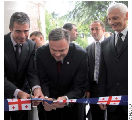
(მარცხნიდან მარჯვნივ) ნატო-ს გენერალური მდივანი ანდერს ფოგ რასმუსენი საქართველოს ევროპული და ევროატლანტიკური ინტეგრაციის საკითხებში სახელმწიფო მინისტრთან ერთად ხსნის ნატო-ს სამეკავშირეო ოფისის განყოფილებას თბილისში, მის უკან დგას ნატო-ს სამეკავშირეო ოფისის ხელმძღვანელი ზბიგნევ რიბაკი

კომისიაში მუშაობა მიმდინარეობს ყოველწლიური ეროვნული პროგრამის