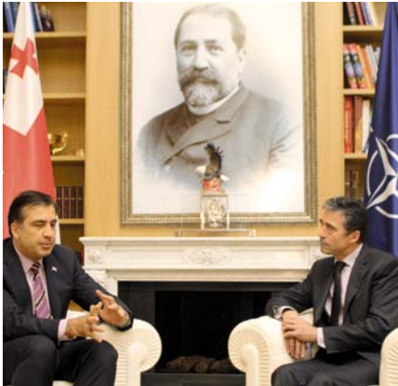
Генеральный секретарь НАТО Андерс Фог Расмуссен встречается с Президентом Грузии Михаилом Саакашвили в Тбилиси 1 октября 2010 года. Он подтверждает неуклонную приверженность НАТО территориальной целостности и суверенности Грузии и решения, принятые на Бухарестском саммите.

В подтверждение неуклонной приверженности членов НАТО решению, принятому на Бухарестском саммите несколькими месяцами ранее, в сентябре 2008 года была сформирована Комиссия НАТО-Грузия. Ей было поручено руководство процессом, в результате которого Грузия сможет вступить в НАТО, а также содействием Североатлантического союза Грузии после конфликта.