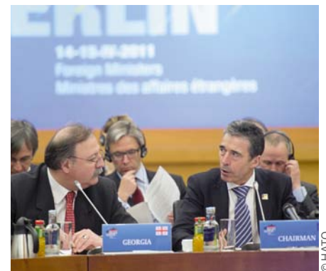
Министр иностранных дел Грузии Григол Вашадзе беседует с Генеральным секретарем НАТО Андерсом Фогом Расмуссенем на встрече Комиссии НАТО-Грузия в Берлине 15 апреля 2011 года. Члены НАТО приветствовали успехи Грузии в реализации оборонной реформы и ее ценный вклад в МССБ под руководством НАТО в Афганистане.

Будучи основан на демократических ценностях, НАТО предъявляет высокие требования к странам-кандидатам и призывает Грузию продолжать масштабные реформы на пути к евроатлантической интеграции. Члены НАТО настоятельно призывают