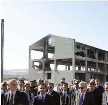
Генеральный секретарь НАТО Яап де Хооп Схеффер и послы государств-членов НАТО посещают лагерь в Гори 16 сентября 2008 года, в котором после августовского конфликта нашли убежище около 2200 перемещенных лиц.