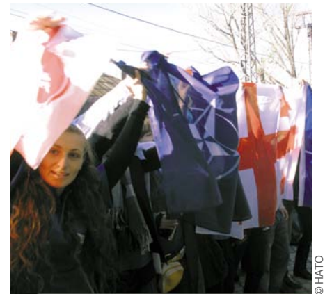
Большинство граждан Грузии выступает за вступление страны в Североатлантический альянс.

Главнейшая цель с точки зрения общественной дипломатии, как для правительства Грузии, так и для НАТО, — информировать, просвещать и управлять ожиданиями населения в отношении членства в НАТО, включая связанные с этим права и обязательства. Грузия идет по правильному пути и добилась больших успехов в реализации обширного пакета реформ. Теперь надо продолжать следовать данному курсу, принимать и осуществлять дальнейшие реформы, чтобы реализовать свои планы относительно членства в НАТО.