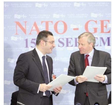
15 сентября 2008 года во время визита в Грузию высшего руководящего органа НАТО — Североатлантического совета — проходит в Тбилиси инаугурационное заседание Комиссии НАТО-Грузия.

Союзники по НАТО откликнулись на запрос Грузии о предоставлении содействия в ряде областей. Это содействие включает оценку ущерба, нанесенного гражданской инфраструктуре, состояния объектов Минобороны и Вооруженных сил, помощь в восстановлении воздушного транспорта и консультации по вопросам киберзащиты.