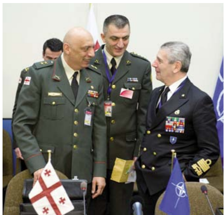
(Первый ряд, слева направо) Начальник Генерального штаба Грузии генерал-майор Деви Чанкотадзе беседует с председателем Военного комитета НАТО адмиралом Джанпаоло Ди Паола в рамках встречи Комиссии НАТО–Грузия 4 мая 2011 года.

чий план Военного комитета с Грузией. В нем детализированы совместно согласованные направления сотрудничества, его цели и задачи, и расставлены приоритеты бюджетных ассигнований. Обширный комплекс мероприятий должен повысить оперативную совместимость и помочь Грузии выполнять свои обязательства по участию в операциях под руководством НАТО. Данные мероприятия также являются важным подспорьем в проведении оборонных реформ и достижении целей в области безопасности и обороны, фигурирующих в ЕНП.