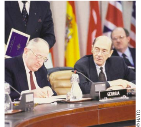
Министр иностранных дел Грузии Александр Чиквадзе подписывает Рамочный документ программы «Партнерство ради мира» 23 марта 1994 года. Тем самым был заложен фундамент для практического двустороннего сотрудничества между НАТО и Грузией и сформулированы ключевые ценности и обязанности партнерства.

Наряду с СЕАП и программой ПРМ, эти обязательства служат целям укрепления доверия и открытости, ослабления угрозы миру и построения прочных отношений безопасности между союзниками по НАТО и партнерами в Евроатлантическом регионе.