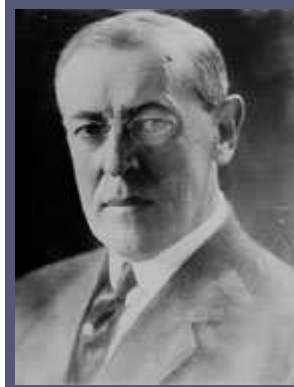
伍德罗·威尔逊总统(Woodrow Wilson)

《华盛顿邮报》一名记者在报导1919年春埃及反抗英国统治的斗争时指出，埃及的民族主义者受到"威尔逊理想的激励"，"在示威时，骚乱的人群呼喊着威尔逊的教导"。埃及民族主义者引用威尔逊的信条请求美国参议院支持埃及独立，但威尔逊拒绝了他们的要求，重申了美国对英国统治埃及的支持。虽然美国在战争期间和战后对自由的支持基本上停留在语言上，但事实证明威尔逊的主张在二十世纪推广民主的运动中发挥了关键作用。