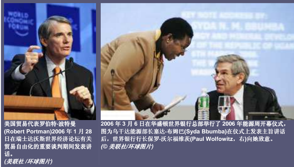
美国贸易代表罗伯特·波特曼 (Robert Portman) 2006 年 1 月 28 日在瑞士达沃斯世界经济论坛有关贸易自由化的重要谈判期间发表讲话。