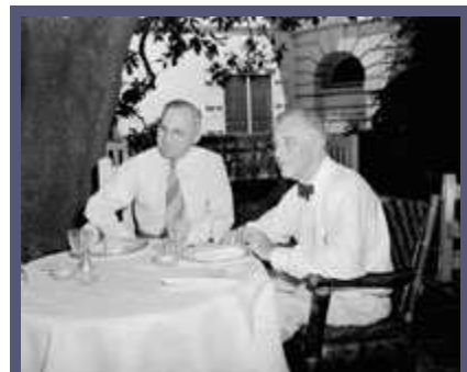
1944 年，富兰克林·罗斯福总统(右)在白宫与副总统哈里·杜鲁门会晤。

这种高尚的理想主义很快成为各种因素的牺牲品，导致克林顿改变对中国的贸易政策。这些因素包括美国在中国的商业利益、五角大楼因北韩测试核武器造成迫在眉睫的危机而施加的压力以及与北京之间一系列激烈的公开对抗。克林顿总统认为，可以通过将中国融入全球经济来最好地推广美国的理想，因此他奉行接触的政策，并于 1994 年 5 月宣布对中国的贸易地位与其人权问题分别处理。财部长罗伯特·鲁宾(Robert Rubin)在解释这一政策变化时说，符合美国利益的做法是“帮助加快中国经济融入世界经济的步伐……毫无疑问，在人权、宗教自由、安全以及经济问题上，我们与中国有着严重分歧……问题在于，什么是推进我国利益和信仰的最佳途径。我们认为，接触是在与中国的所有这些问题上取得进展的最可能行之有效的方式。”1996 年秋，克林顿总统开始了为期三年的推动中国加入世界贸易组织的工作。中国加入这一全球经济体系的过程并非一帆风顺，但此一结果普遍被誉 b 为是克林顿外交政策的最大成就，它再次突显了美国理念与利益之间的冲突。