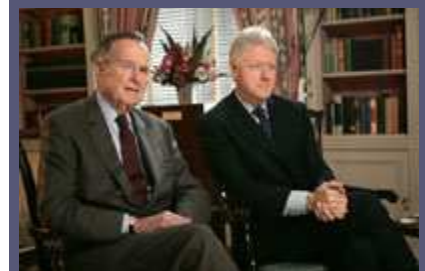
前总统老布什(左)和克林顿总统 2005 年在白宫。