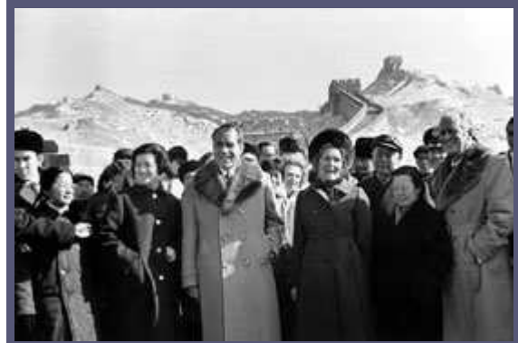
1972年2月24日，尼克松总统(中)和夫人帕特在北京附近游览长城时与一群中国公民合影。最右边是国务卿威廉·罗杰斯。

在美国，中国的敌意、因冷战而更加恶化的国内反共浪潮以及支持蒋介石的美国人展开的游说等一系列原因，导致决策者在 50 年代和 60 年代未能与北京建立联系。确实，尽管艾森豪威尔总统( Dwight Eisenhower )提出孤立中国是一个错误，但华盛顿仍然利用其影响将中国排斥在联合国之外。