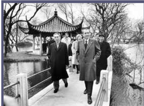
1972年2月26日，尼克松总统(右)和夫人(中间靠后)与中国总理周恩来在杭州西湖的一座桥上漫步。

中国共产党1949年在中国内战中取得胜利，对美国产生了极大震撼。在20世纪上半叶，从西奥多·罗斯福总统开始的美国决策者，均主张推动中国的强大和繁荣。他们认为中国会成为美国的友邦。一个世纪以来，美国人在中国广泛开展慈善活动，例如在中国创办基督教学院，为中国现代教育制度开了先河。再如洛克菲勒基金会(Rockefeller Foundation)为乡村建设项目和培养中国一流医生的北京协和医科大学提供了资金。很多美国人认为，自从美国政府向欧洲列强发出"门户开放照会"(Open Door Notes)—当时中华民族的生存存在1899年和1900年受到威胁—美国一直支持中国反抗日本和欧洲列强的事业。而最明显的是，美国在二次大战期间领导了将中国从日本侵略者的铁蹄之下解放出来的斗争。