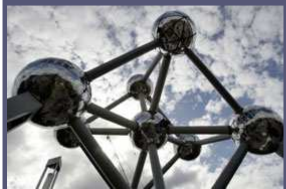
在 1958 年比利时世界博览会上展出由沃特金(Andre Waterkeyn)设计的原子球。其结构为放大 1650 亿倍的铁晶体。这座已有 48 年历史的标志性建筑最近进行了全面的修复。这次世博会是二次世界大战后的第一次，为美国与苏联之间的文化冷战拉开了序幕。

除了冷战时期的文化竞争外，这次世界博览会的特点在于种类繁多的科学产品，包括有声百科全书、电子字典、经过巴氏消毒法处理的奶酪、可在数秒钟内传输数百万字符的磁带以及可以在 15 分钟内检索一千张支票的邮政机器。最令游客印象深刻的是为了宣传本国经济发展而主办这次世博会的比利时展出的标志性展品：这是一个原子球状的巨型未来派建筑，它强调了原子时代的积极方面；此外还有其巧克力，在 58 世博会期间，比利时每天生产的巧克力达五吨。