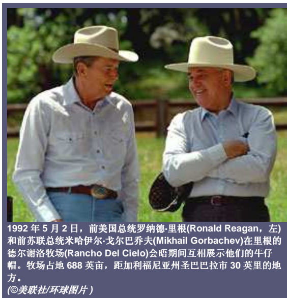
1992年5月2日，前美国总统罗纳德·里根(Ronald Reagan，左)和前苏联总统米哈伊尔·戈尔巴乔夫(Mikhail Gorbachev)在里根的德尔谢洛牧场(Rancho Del Cielo)会晤期间互相展示他们的牛仔帽。牧场占地 688 英亩，距加利福尼亚州圣巴巴拉市 30 英里的地方。

这是一个令人欢欣鼓舞的时刻，可惜好景不长。怀疑论者(包括作者本人)认为世界上仍存在许多冲突，它们不过因冷战而被淡化或掩盖罢了。换言之，只要美、苏这两个阵营之间的对立继续存在，在当时显得较为次要的其他各种冲突就不会暴露出来。然而，似乎违反常理的是，冷战在某种程度上起到了维护世界秩序的作用，是一个稳定因素。