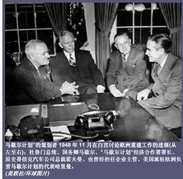
马歇尔计划的策划者 1948 年 11 月在白宫讨论欧洲重建工作的进展(从左至右): 杜鲁门总统、国务卿马歇尔、“马歇尔计划”经济合作署署长、原史蒂倍克汽车公司总裁霍夫曼、也曾经担任企业主管、美国派驻欧洲负责马歇尔计划的代表哈里曼。

当时并存的三种情况是导致美国在 1947 年春制订这项为西欧提供帮助的新计划的动因。首先是战后欧洲大陆在 1946-1947 年冬发生的酷寒造成的恶劣物质条件。第二是杜鲁门主义(Truman Doctrine)的失败。杜鲁门主义明确表示要帮助希腊和土耳其对抗苏联的压力，但它未能指出向前推进的具有建设意义的途径。第三是国务卿马歇尔在 1947 年 3 月至 4 月为解决德国未来的问题专门举行的莫斯科外长会议(Moscow Conference of Foreign Minister) 期间艰难的经历。