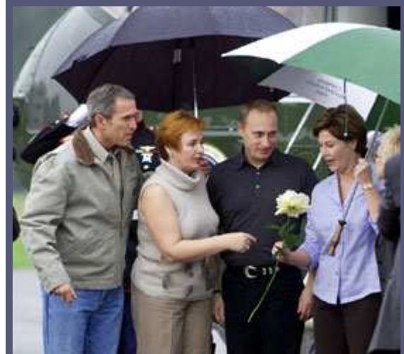
俄罗斯总统弗拉基米尔·普京(Vladimir Putin)偕夫人柳德米拉·普京(Lyudmila Putin)(中)于2001年11月14日抵达位于得克萨斯州克劳福德的布什牧场，受到布什总统和夫人劳拉欢迎。

冷战结束，美国成为唯一的超级大国，这意味着它对世界和平担负着重大责任。没有任何别的国家曾经处于类似地位——不仅仅要维护其自身安全，还要应对全世界所面临的威胁。但是，就连一个超级大国也不是无所不能，它行使其国际义务的能力有限。它不能也不应单独行动，而应该在国际行动中充当领袖，尽量通过说理争取合作，而只在必要时使用压力。