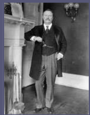
西奥多·罗斯福总统(Theodore Roosevelt)

但是，威尔逊推广民主自由的运动与务实的现实主义是结合在一起的。例如，虽然他谴责土耳其人残酷对待亚美尼亚人，但却因担心危及美国传教团在中东的工作而抵制对土耳其发动战争的强烈要求。确实，由于美国不愿出兵支持，第一次世界大战后兴起的国家亚美尼亚很快灭亡。威尔逊在战争中的表现也毫无理想主义可言，尽管他坚称"不惜一切代价动用武力"，并威胁要充份发挥美国战争机器的全部威力。因此，基于美国在一次世界大战中所扮演的角色，我们看到的战略是一个狭隘利益取向和根深蒂固的传统原则交互作用的产物。