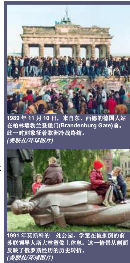
1989年11月10日，来自东、西德的德国人站在柏林勃兰登堡门(Brandenburg Gate)前。此一时刻象征着欧洲冷战终结。

正是基于这一"多米诺理论"，美国在干预"边缘地区"时遭遇了最惨重的失败——越南。在日本于 1945 年投降后，法国重新控制越南的努力遇到了顽强的抵抗。美国决策者有心敦促法国撤离印度支那，重演推动荷兰离开印度尼西亚的一幕。但法国领导人警告说，法兰西帝国如遭受这一损失可能导致法国沦为受共产主义控制。华盛顿不愿冒这一风险。从对法国提供支持开始，美国逐步派去培训人员和部队——到 1969 年在越南的美军达近 55 万人，付出了巨大的生命和财富代价，最终并未能阻止北越共产党政权统一整个越南。