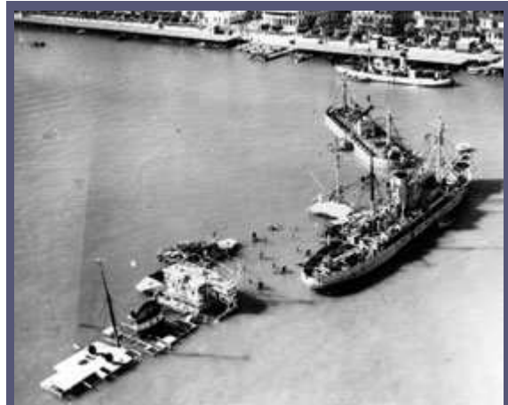
1956年，在以色列、英国和法国进攻埃及后，埃及为堵塞苏伊士运河通道而将船只在运河入口处沉入水中。

苏伊士运河危机于1956年7月爆发。为了表明他一心摆脱殖民统治的立场，对英美拒绝提供经济援助进行报复，攫取苏伊士运河公司在埃及赚取的利润，纳赛尔将这家由英国人和法国人控制的公司收归国有，从而引发了一场历时四个月的国际危机。在这场危机中，英国和法国逐渐在该地区