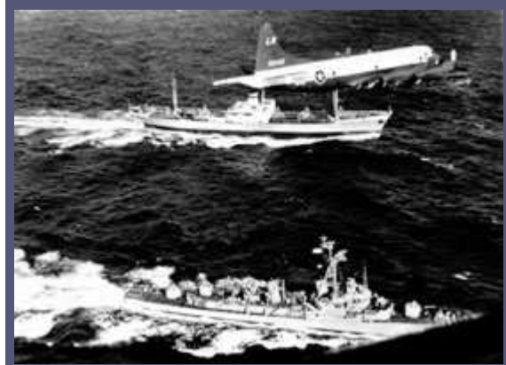
1962年11月10日，美国海军“巴里”号驱逐舰(Barry)在大西洋上在俄罗斯“安诺索夫”号运输舰(Anosov)旁停下检查货舱。一架美国海军侦察机在上空飞行。苏联舰船运载的是1962年古巴导弹危机结束时撤出古巴的导弹。

1918年，美国曾一度半心半意地加入企图推翻苏维埃革命政权的协约国集团，但该目的最终未能实现。因此，早在二次世界大战以前，苏联与西方之间就存在着怀疑和敌意，只不过反对纳粹德国的需要使双方成为不情愿的盟友。