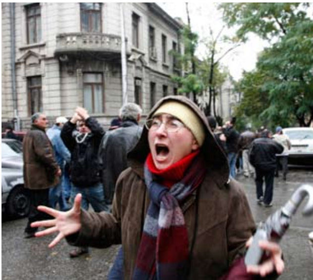
Страсти накалились во время уличных столкновений в Тбилиси между участниками антиправительственной демонстрации и силами безопасности в ноябре 2007 года.