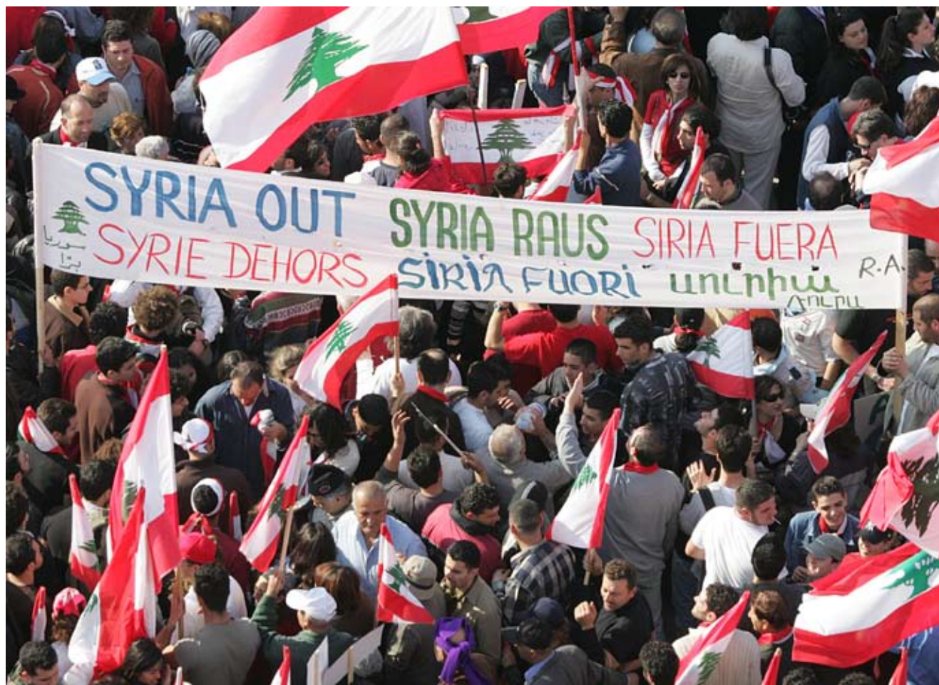
Ливанские демонстранты требуют вывода сирийских войск на уличных митингах, которые были организованы в 2005 году отчасти с помощью текстовых сообщений, передававшихся по сотовым телефонам.

«Все больше и больше правительств осознает, что интернет может играть ключевую роль в борьбе за демократию, и они вводят новые методы цензуры, – указала организация в своем докладе «Всемирный индекс свободы печати» за 2007 год. – Правительства репрессивных стран теперь берут на прицел блоггеров и сетевых журналистов так же,