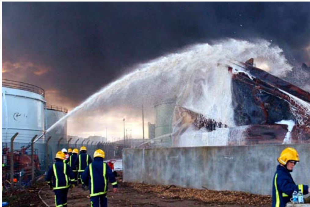
События на нефтебазе «Бансфилд» в Хертфордшире (Англия) положили начало новой эпохе в передаче новостей, когда в СМИ стали проникать материалы, подготовленные пользователями.

Но, пожалуй, еще более знаменательное событие произошло 11 декабря 2005 года, когда взрыв на нефтебазе «Бансфилд» в Великобритании вызвал