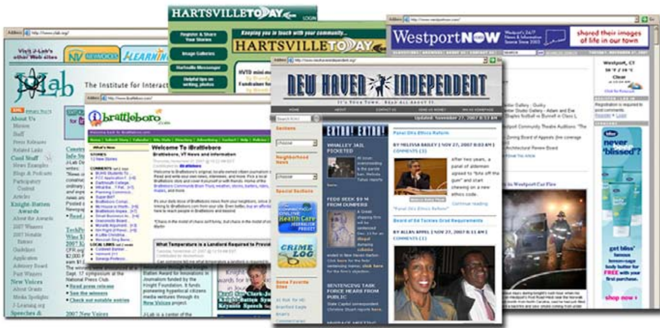
Эти снимки дают представление о некоторых американских чисто местных сайтах

Благодаря новым технологиям СМИ, обычные люди, живущие по соседству в городах и небольших поселках, могут помещать в интернет информацию, которую не отражают традиционные СМИ, то есть крупные газеты, телевидение и радио. Такое отражение событий на «микроуровне» позволяет гражданам объединяться в группы и сообща решать местные проблемы. Так формируется основа для участия людей в политической жизни.