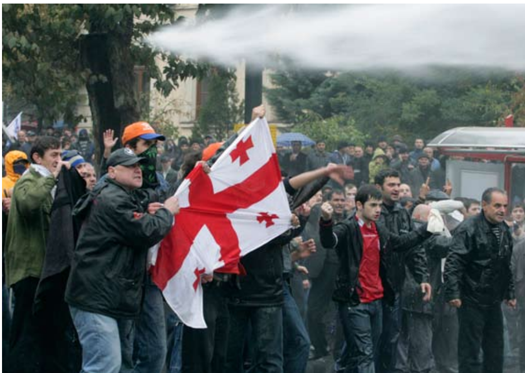
Силы безопасности разгоняют граждан водометами в столице Грузии Тбилиси.

Грузинские СМИ не получили такой же свободы, как их коллеги в других странах, где политические реформы были доведены до конца. Причины этого не вполне понятны. В докладе «Свобода печати в 2007 году», изданном некоммерческой правозащитной группой «Фридом хаус», давалась такая оценка положения СМИ: