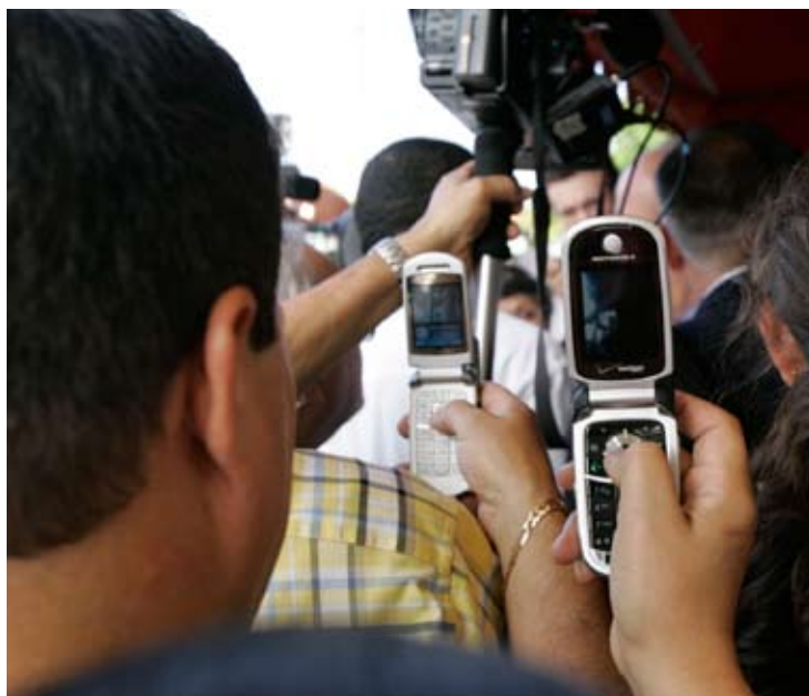
Очевидцы, используя камеры сотовых телефонов, снимают журналистов на предвыборном мероприятии в США.