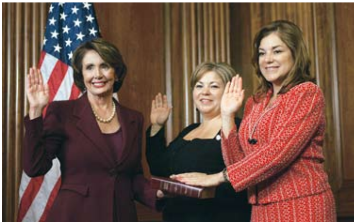
Спикер Палаты представителей Нэнси Пелоси (слева) приводит к присяге двух сестер, Линду (в центре) и Лоретту Санчес; обе были избраны в Палату от штата Калифорния.

В рядах конгрессменов партийная дисциплина соблюдается не так строго, как в других парламентских системах. Члены Конгресса с большой степенью свободы могут голосовать по политическим вопросам так, как сочтут полезным для своего переизбрания. В результате, лидерам Конгресса приходится с великим трудом сколачивать большинство, уговаривая одного депутата за другим, вместо того чтобы получить автоматическую поддержку дисциплинированной партийной фракции. Из-за этого каждая законодательная победа в Конгрессе дается ценой огромных усилий. Таким образом, выборы в Конгресс важны для страны по причине того, что Конгресс обладает большими полномочиями и трудно предсказуем, как, впрочем, и каждый конгрессмен в отдельности.