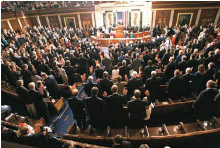
Члены 109-го Конгресса принимают должностную присягу в Палате представителей на Капитолийском холме, 2005 год.

Несмотря на то, что две основные партии доминируют в правительстве на национальном, штатном и местном уровнях, различия в их идеологиях и программах представляются менее четко очерченными, чем у политических партий во многих других демократических странах. Доминирование в политическом процессе этих основных партий объясняется их готовностью к прагматической адаптации соответственно нуждам политического развития страны.