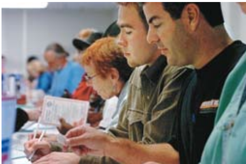
Избиратели заполняют документы перед голосованием, Сан-Диего, 2004 год.

Итак, раз в четыре года американцы избирают президента и вице-президента, раз в два года избираются все 435 конгрессмена и приблизительно одна треть из 100 сенаторов. Представители штатов в Сенате избираются на шестилетний срок согласно графику переизбрания одной каждые два года.