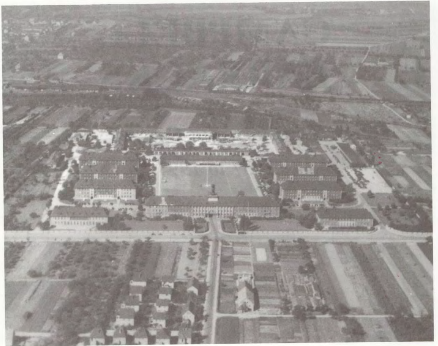
Campbell Barracks, 1948

The barracks were published by Headquarters, United States Army, Europe, and located along the US/EUROPEY in December 1948. It was revised by the Military History Office of the Secretary of the General Staff (AGS), AGS 12-48/107A, which, throughout, was prepared for the Office of the Deputy Chief of Staff, Information Management, AGS 12-48/107A, and revised by the Special Staff, Information and Publications Center, Europe, France, in accordance with the AGS 12-48/107A and AGS 12-48/107A. The original drawing was prepared by the AGS 12-48/107A.