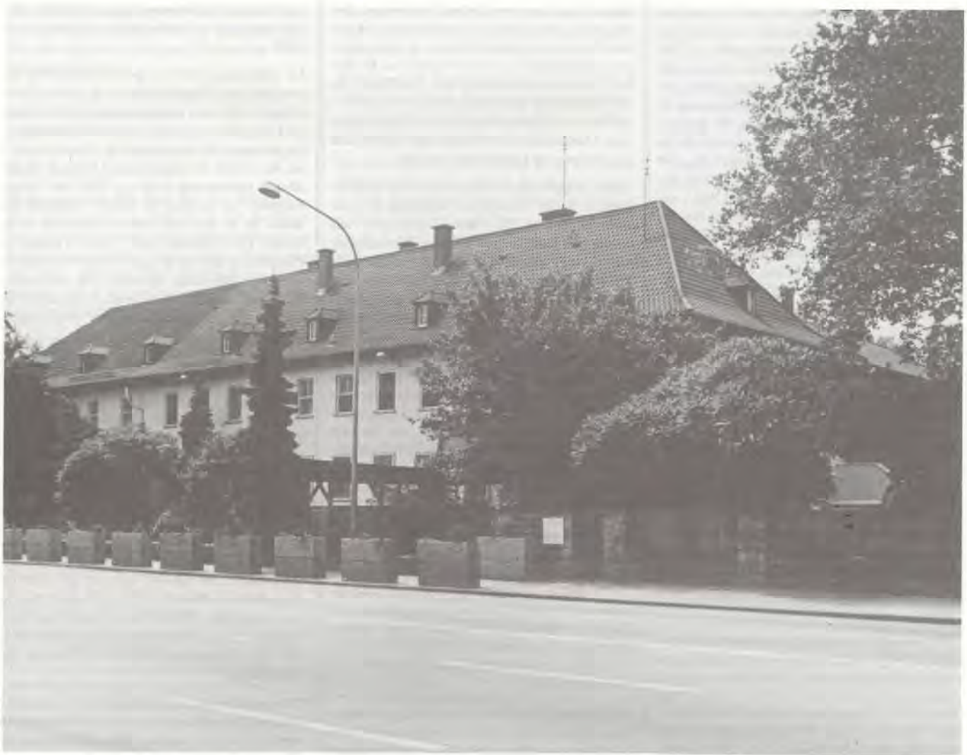
Note the different colored roof sections that show where a section was added to the building. Die verschiedenen Farben des Daches zeigen die Stelle an denen das Gebäude erweitert wurde. Les couleurs différentes du toit montrent les parties où une annex fut ajoutée au bâtiment.

floor suite in the south wing of the Keyes Building became the office of the Deputy Commander in Chief, USAREUR, and the office of the Chief of Staff, HQ USAREUR/7A, moved to the ground floor.