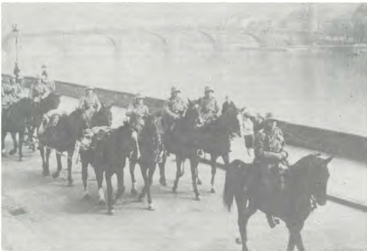
To mark the opening of Großdeutschland-Kaserne , the 110th Infantry Regiment marched through Heidelberg on 7 October 1937. Zur feierlichen Eröffnung der Großdeutschland-Kaserne fand am 7. Oktober 1937 eine Parade des Infanterieregiments 110 durch Heidelberg statt. A l'occasion de l'ouverture de la Großdeutschland-Kaserne, le 110ème Régiment d'Infanterie fit la parade à Heidelberg le 7 octobre 1937.

Avec cette organisation réduite le régiment poursuivit les combats durant l'été et l'automne de 1944 et fut décimé pendant la retraite de l'hiver 1944-45. A la mi-février 1945, le régiment était tellement réduit en effectif que les personnels restants furent affectés à d'autres unités et le régiment lui-même fut dissous.