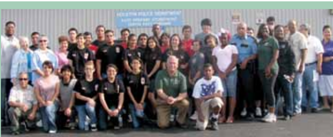
El Congresista y unos voluntarios de la comunidad en la 10ª Anual Limpieza del Área North Channel el 28 de abril. El Congresista también habló sobre asuntos sobre el medio ambiente.

En conjunto con Park Place Civic Club Charlton Park 8200 Park Place Blvd Houston, TX 77017