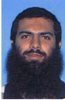
2002 صورة مأخوذة عام