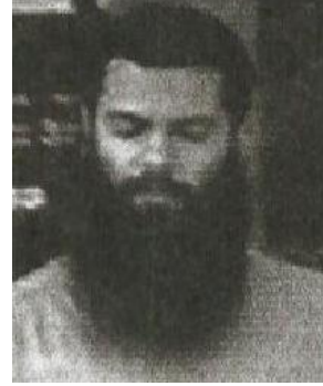
2002 صورة مأخوذة عام