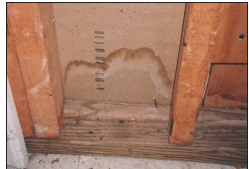
Mancha de agua en la pared de un sótano – ubicar y corregir prontamente la fuente del agua.

Se riega tome nota: El moho muerto puede seguir causando reacciones alérgicas en las personas, por lo tanto no es suficiente matar el moho, sino que también se debe eliminar.