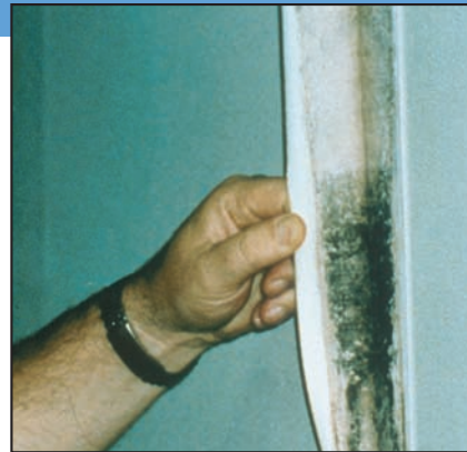
Moho creciendo detrás de un empapelado.

Sospecha de moho escondido Puede sospechar que existe moho escondido si un edificio huele a moho, pero que no puede ver su origen o si sabe que hubo daños causados por el agua y que los residentes se quejan de problemas de salud. El moho puede esconderse en lugares tales como la parte trasera de las planchas de yeso o drywall, empapelado, revestimientos de madera, la parte superior de baldosas de techo, la parte inferior de moquetas y tapices, etc. Las ubicaciones posibles del moho escondido incluyen zonas dentro de paredes alrededor de tuberías (con tuberías con pérdidas o condensación), la superficie de paredes detrás de muebles (en las que se forma condensación), en los conductos interiores, y en los materiales de techados encima de las baldosas de techos (debido a goteras en el techo o aislamiento insuficiente).