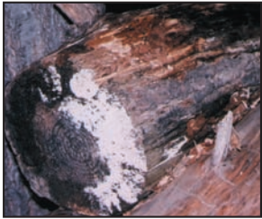
Moho creciendo sobre leña al exterior. Los mohos tienen varios colores, esta foto enseña ambos mohos blanco y negro.

Los mohos forman parte del medio ambiente natural. Al exterior, los mohos juegan un papel en la naturaleza al desintegrar materias orgánicas tales como las hojas que se han caído o los árboles muertos. No obstante, al interior, es necesario evitar el moho. Los mohos se reproducen mediante esporas; las esporas son invisibles a simple vista y flotan en el aire exterior e interior. Las esporas de mohos se hallan normalmente presentes en el aire exterior e interior. El moho puede crecer al interior cuando las esporas