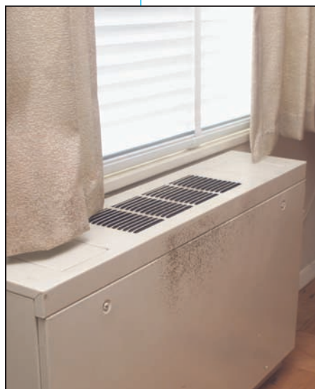
Moho creciendo sobre la superficie de un ventilador.

■ Cuando ocurran pérdidas o derrames de agua en el interior, ACTÚE RÁPIDAMENTE . Si se secan los materiales o las zonas mojadas o húmedas en las 24-48 horas que siguen una pérdida o derrame, no crecerá el moho en la mayoría de los casos.