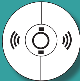
Alimenté par pile Élément mural/au plafond