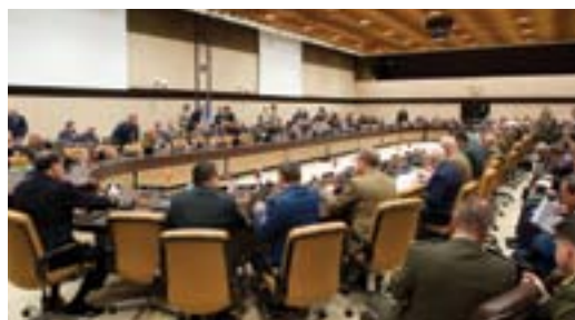
Rolul principal al Comitetului Militar este de a furniza orientări și recomandări pe probleme de politici și strategii militare. De asemenea, Comitetul Militar recomandă autorităților politice ale NATO măsurile necesare pentru apărarea comună a zonei de responsabilitate a NATO și implementarea deciziilor referitoare la operațiile și misiunile NATO.