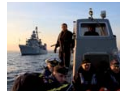
Conducerea operațiilor de combatere a pirateriei din Cornul Africii din cadrul Operației Ocean Shield.