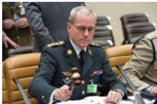
Generalul danez Knud Bartels, actualul președinte al Comitetului Militar, este autoritatea militară cea mai înaltă a Alianței. Ales de către șefii apărării țărilor membre NATO, președintele conduce toate ședințele Comitetului, având funcție de decizie la nivel internațional. Șefii apărării se întâlnesc de cel puțin trei ori pe an, lucrând zilnic prin intermediul reprezentanților militari permanenți la sediul NATO din Bruxelles.