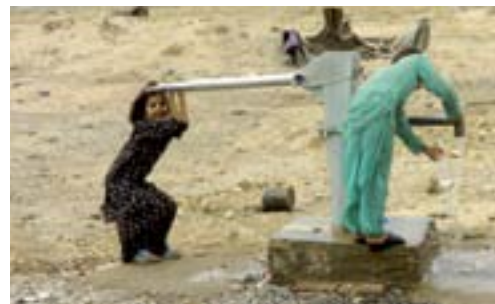
Copii afgani din satul Sayad Pacha, din sudul Afganistanului, utilizând o pompă de apă finanțată de militari în cadrul cooperării dintre civili și militari.