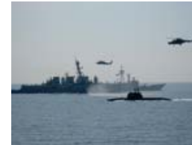
Operația Active Endeavour este acțiunea NATO de supraveghere și escortă maritimă în lupta împotriva terorismului. Avându-și baza în Marea Mediterană, forța militară ale cărei efective sunt furnizate de câteva țări (pentru un timp și de Rusia și Ucraina), a utilizat mai mult de 100.000 de nave.

Operații, Capabilități, Cooperare, Transformare