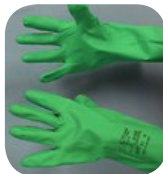
Ejemplo de guantes de nitrilo