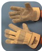
Ejemplo de guantes de cuero