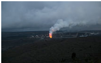
Columna de descarga de SO 2