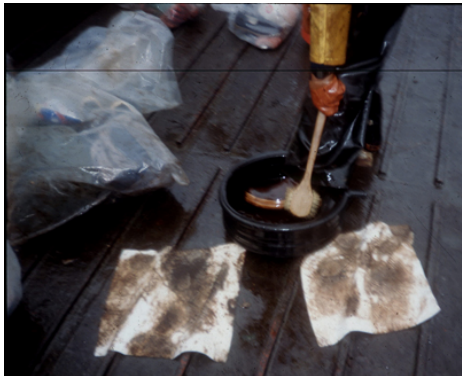
Lavado de botas de descontaminación de campo