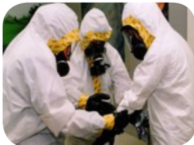
Nivel C de PPE con traje antisalpicaduras y máscara respiratoria filtrante Tyvek®