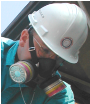
Máscara de ½ cara con cartuchos P-100/OV/AG

En caso de duda sobre los respiradores, consulte con su supervisor!