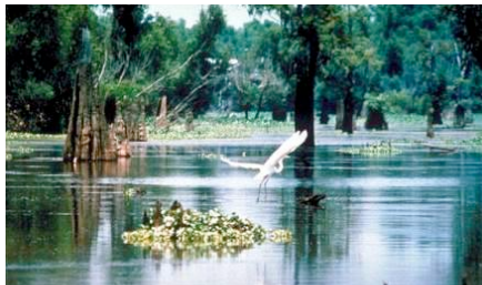
Escena de la Cuenca de Atchafalaya