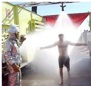
Descontaminación masiva: Foto cortesía de IUOE